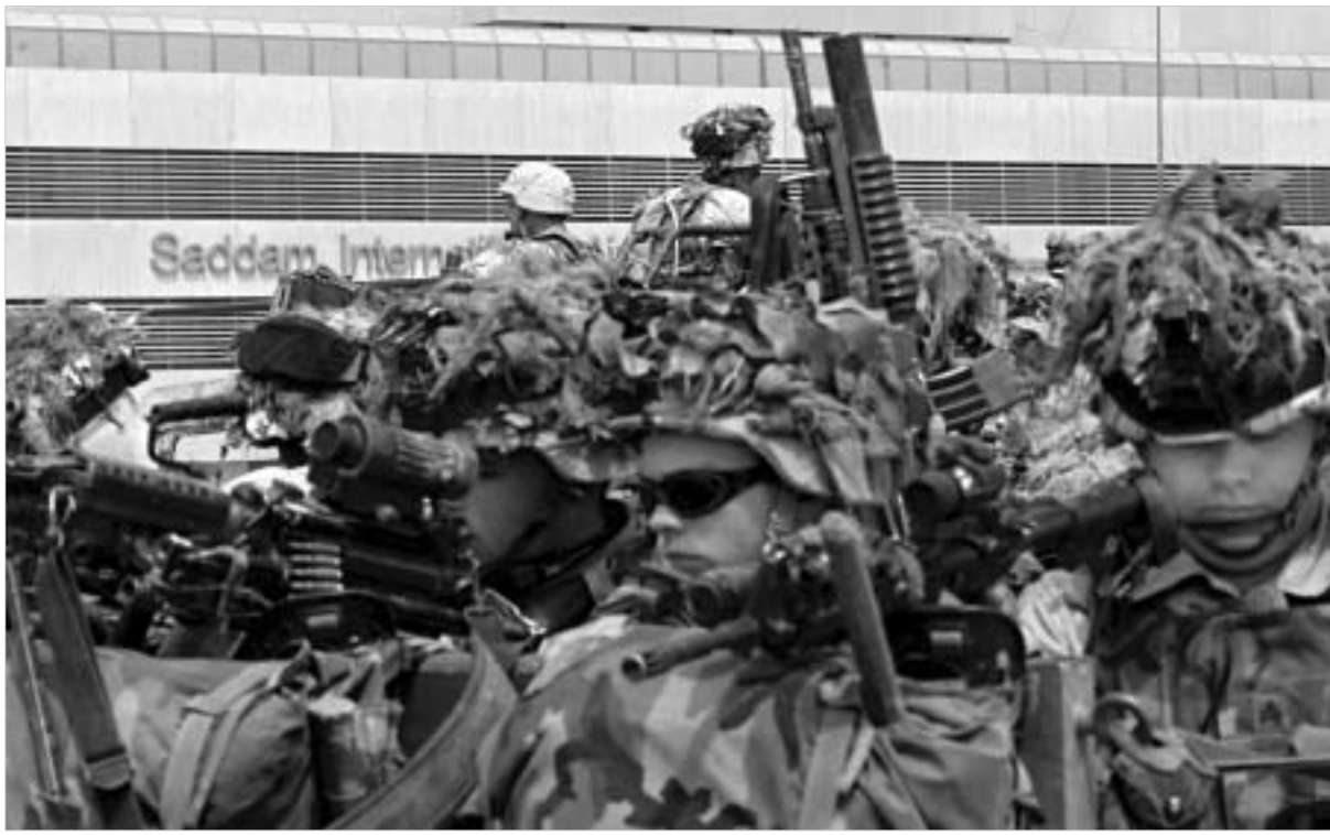
მზარდი მსხვერპლის მიუხედავად აშშ ირანში ჯარის გაყვანას არ აპირებს.

ამერიკის კონგრესმა ხმების უმრავლესობით უარყო რეზოლუციის პროექტი, რომელიც ჯორჯ ბუშის ადმინისტრაციას მოუწოდებდა, დაუყოვნებლივ გამოეყვანოს ირანში ამერიკელი ჯარები. დემოკრატ-კონგრესმენის, ვიტ-ნამის ომის ვეტერანის ჯონ მურ-