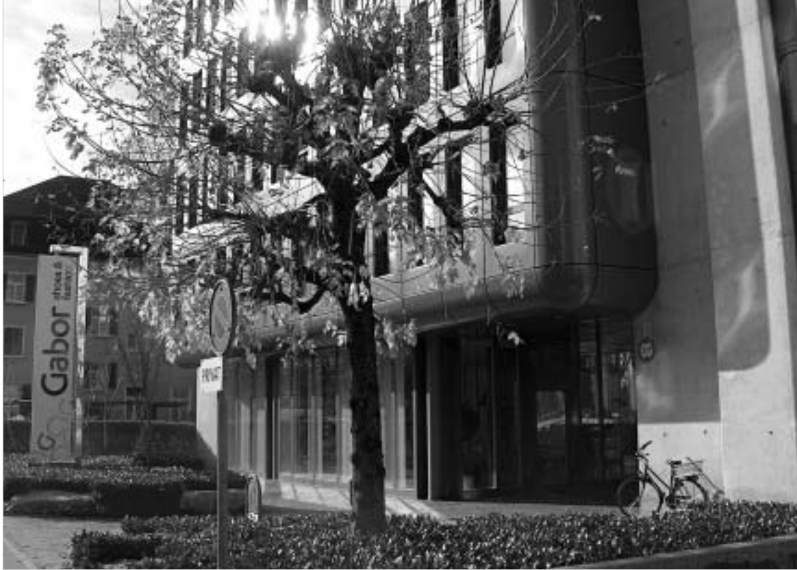
შენობა. სადავო „სიერა ოილი“ ინკოგნიტოდ არსებობს.