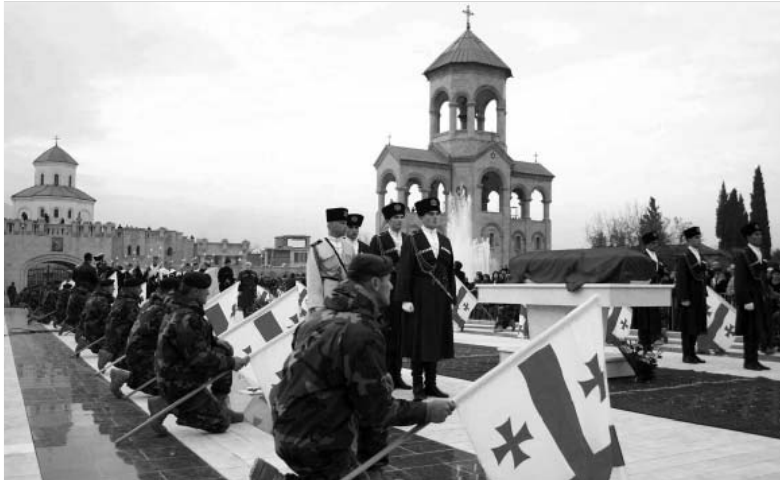
გმირის წინაშე მუხლმოდრეკილი საქართველო.

თვითმფრინავმა, რომელიც თბილისის საერთაშორისო აეროპორტში გუშინ, 14 საათსა და 40 წუთზე დაეშვა, პარიზიდან თბილისში ქაქუცა ჩოლოყაშვილის ნეშტი ჩამოასვენა. საქართველოს ეროვნული გმირის ანდრობო გარდაცვალებიდან 75 წლის შემდეგ აღსრულდა. ნეშტის გადასვენების ცერემონიას ესწრებოდნენ საქართველოს პრეზიდენტი, სრულიად საქართველოს კათოლიკოს-პატრიარქი, უწმინდესი და უნეტარესი ილია მეორე, საქართველოს პარლამენტის