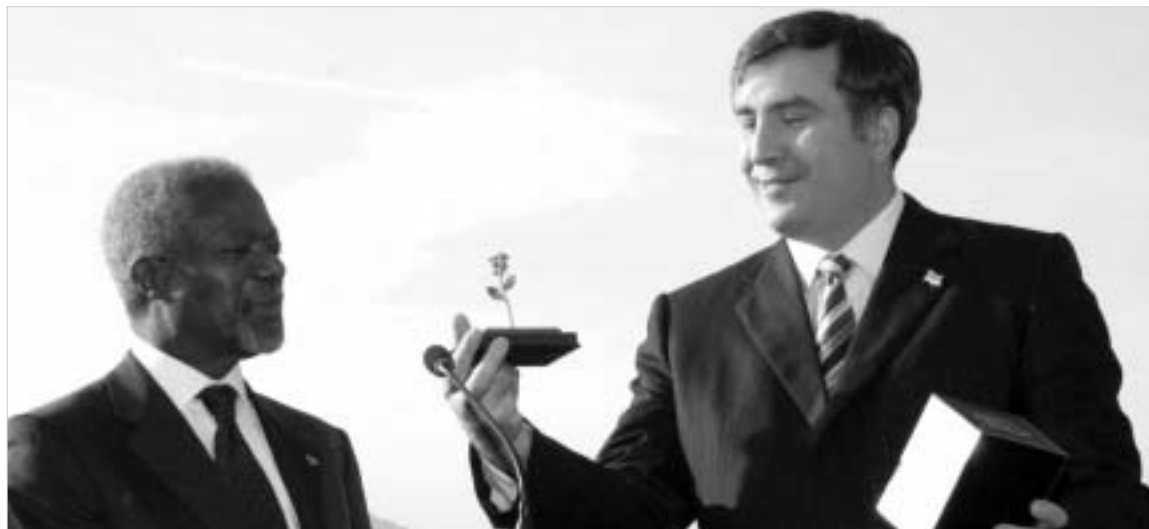
ბრიტნი ლია ცის ქვეშ.