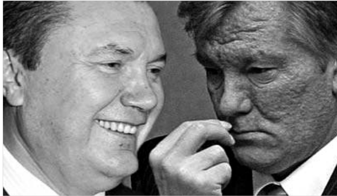
გუმინ ჩვენი დროით 23 საათისთვის, უკრაინის ნაციონალური ეგზიზტის მონაცემებით. საპარლამენტო არჩევნებში გაბარებული პრეზიდენტობის დამარცხებული კანდიდატის ვიქტორ იანუკოვიჩის ბლოკმა უკრაინის რეგიონებში მოიპოვა. მის ხმების 33 პროცენტი მიიღო. იულია ტიმოშენკოს ბლოკმა - 22 პროცენტი. ხოლო პრეზიდენტ იუშენკოს ბლოკმა - 15 პროცენტი.