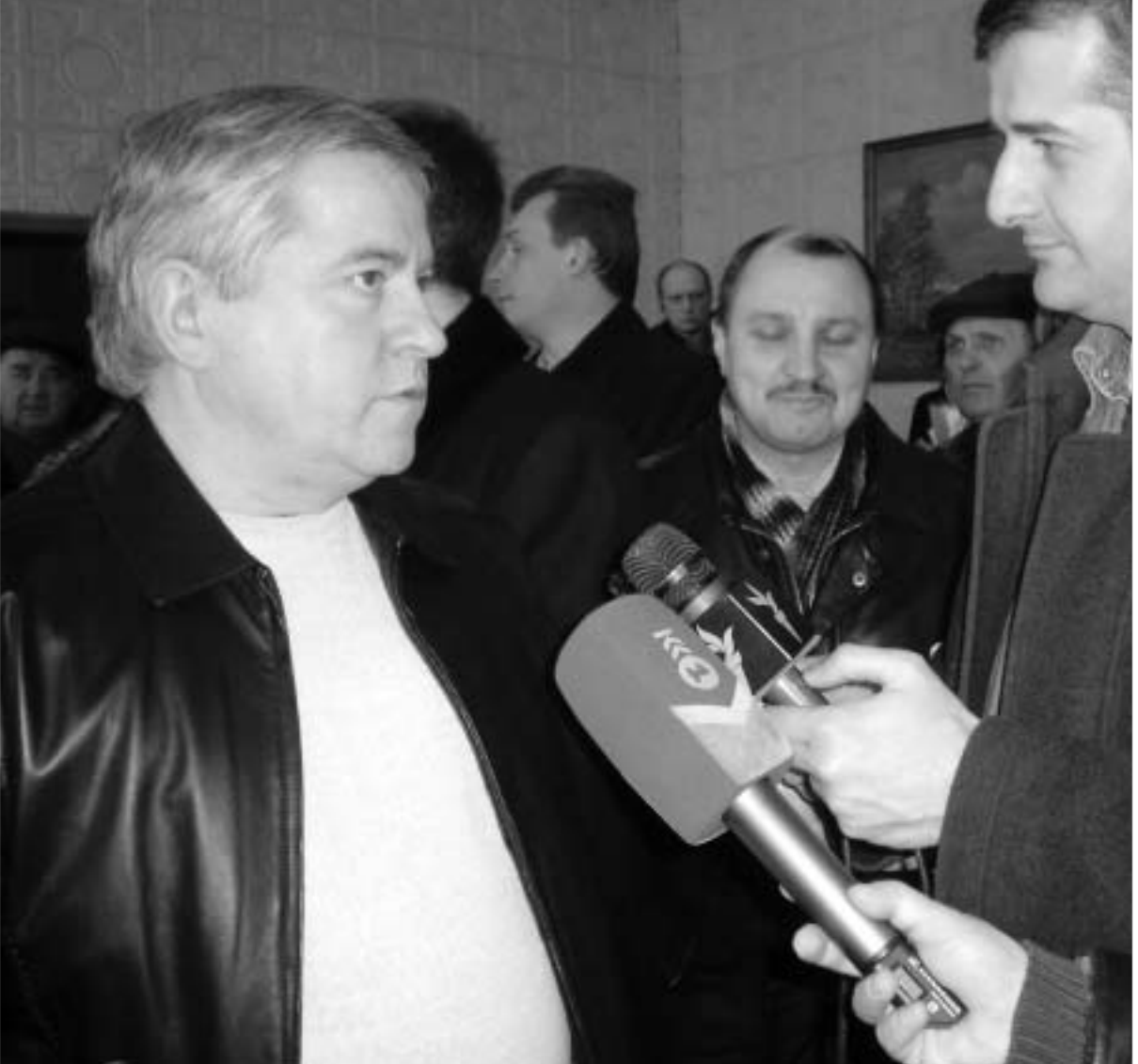
ასწლეულების წინ, ეს ძლიერი ფუნდამენტია ურთიერთნდობი და ქვეყანათა შორის მეტოქეობის საფუძველი ჩაეყარა კონსტიტუტურის საგნად. აბოლუტურად დარწმუნებული ვარ, რომ უკრაინა და საქართველო ურთიერთობას აღმავალი ხაზით

- აი სწორედ ეს არის უბადრუკი, მიმდინარე კონსტიტუტურა. ვინაიდან არსებობს ფასეულობები, რომელიც არ შეიძლება იქცეს ვაჭრობის საგნად პოლიტიკური კონსტიტუციის პირობებში. ეს ფასეულობები - ენა, რელიგია, ტერიტორიული მთლიანობა და ინტეგრაცია. ამიტომ ყველაფერს გავაკეთებთ, რომ უკრაინელმა ხალხმა სიმართლე იცოდეს და არ დაუშვას ნეგატიური სტერეოტიპების გავრცელება. ნატი, თანამედროვე პირობებში, ეს არის უსაფრთხოების სიტყმა. სიტყმა, რომელიც შესაძლებლობას იძლევა, განვავითროთ დემოკრატიული პროცესები, ვეპრობოთ ისეთი მოვლენები, როგორცაა საერთაშორისო ტერორიზმი, ტექნოგენური გამოწვევები, ნარკობიზნესი და უკრაინის მიგრაცია. უკრაინამ აირჩია სტრატეგია ევროატლანტიკური ინტეგრაციისა და ამ კურსის შეცვლას არავითარ შემთხვევაში არ ვაპირებთ.