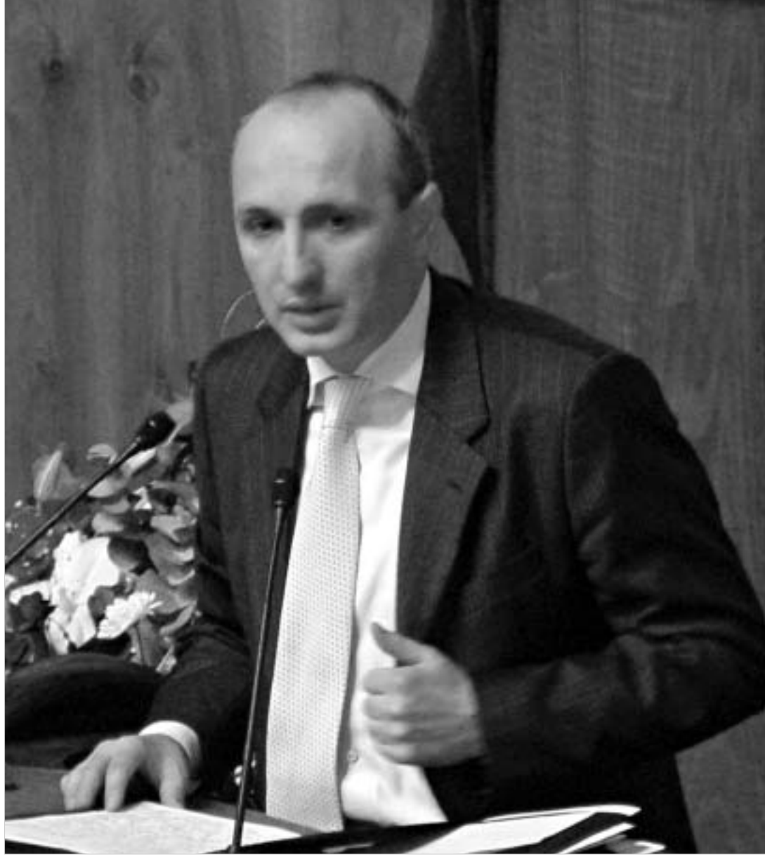
მინისტრი და პოლიტიკური ფიგურა პარლამენტის წინაშე.