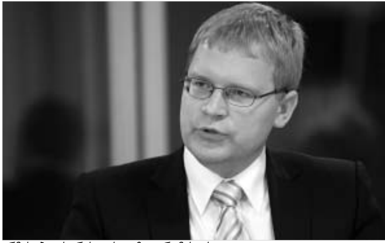
ურმას პაეტს რუსეთის ვიზა არ მისცეს.

ესტონეთის საგარეო საქმეთა სამინისტროს ცნობით, ქვეყნის ნომერ პირველი დიპლომატი პეტერბურგის საერთაშორისო თანამშრომლობის ცენტრში მიიწვიდა. ესტონეთის საგარეო საქმეთა სამინისტროს პრესმდივანის განცხადებით, ურმას პაეტს ოფიციალურად მიიღო