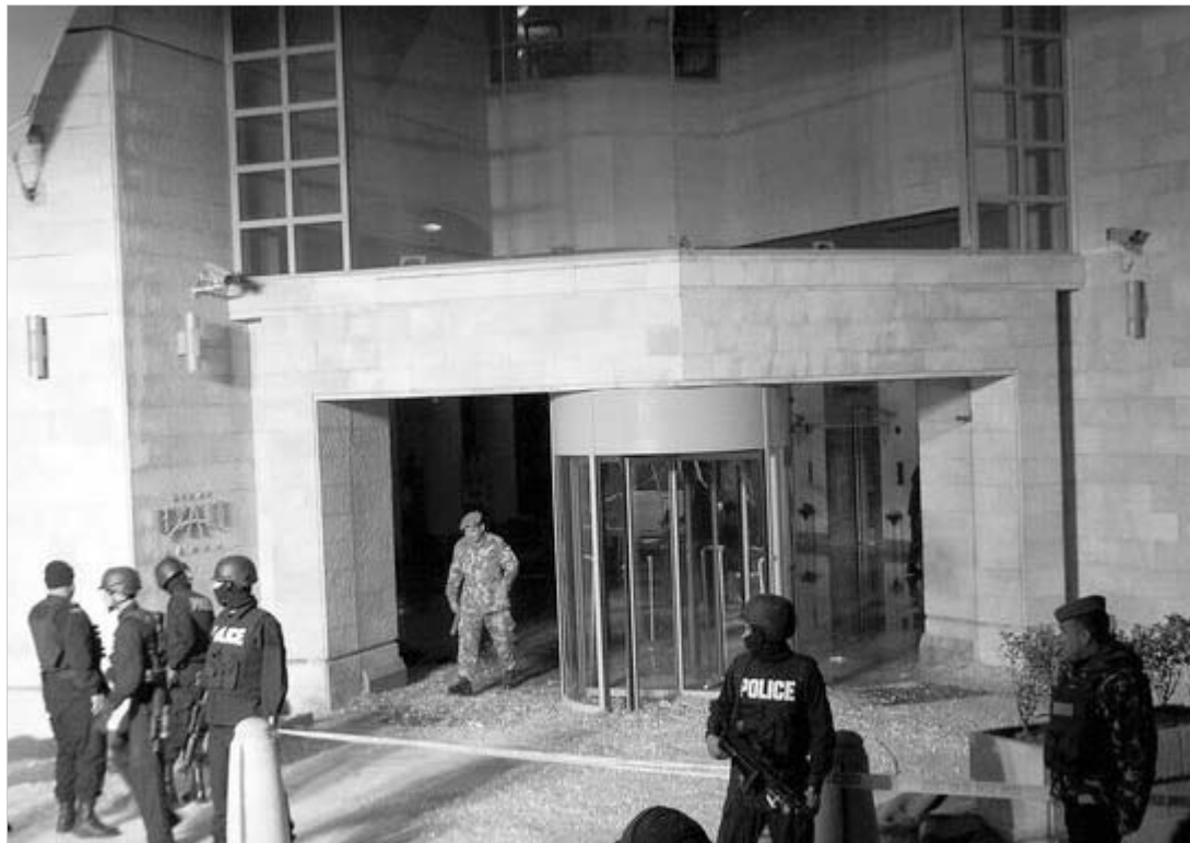
ერაყთან სიახლოვის მიუხედავად იორდანიის აქამდე წყნარ და მშვიდობიან ქვეყნად ითვლებოდა.