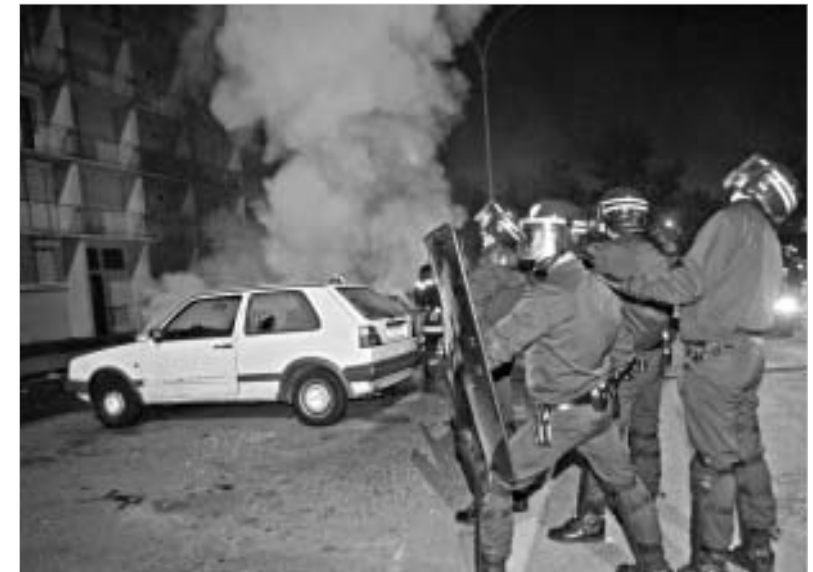
ზურვისტი. თუმცა, საეჭვოა, ამან სიტუაცია დიდად შეცვალოს. დღემდე პოლიციის ქმედებებს ნა-

ემალეობდნენ, დენმა დაარტყა. პარიზის შემოგარენში დაწყებული მძვინვარება არა მარტო საფრანგეთის სხვა ქალაქებს, არამედ ევროპის ზოგიერთ ქვეყანასაც გადაედო. კერძოდ, ავტომანქანების დაზიანების შემთხვევები დაფიქსირდა ბელგიასა და გერმანიაში. პარიზის მახლობლად მდებარე ქალაქ რენსის მერი კანონის ძალაში შესვლას არ დაელოდა და საგანგებო მდგომარეობა სამშაბათს დილითვე გამოაცხადა. მისი თქმით, ამ ზომას იმისთვის მიმართა, რომ თავიდან აეცილებინა ტრაგედია. საფრანგეთის პრემიერ-მინისტრმა დომინიკ დე ვილპენმა ორშაბათს სადამსჯელ განაჯანსა, რომ ქვეყნის იმ რაიონებში, სადაც უნესრიგობები გრძელდება, ხელი შეუწყოს პოლიციელთა დამატებითი ძალების შეყვანას. ამ მიზნით მოზღვიანებული იქნება 1500 რე-