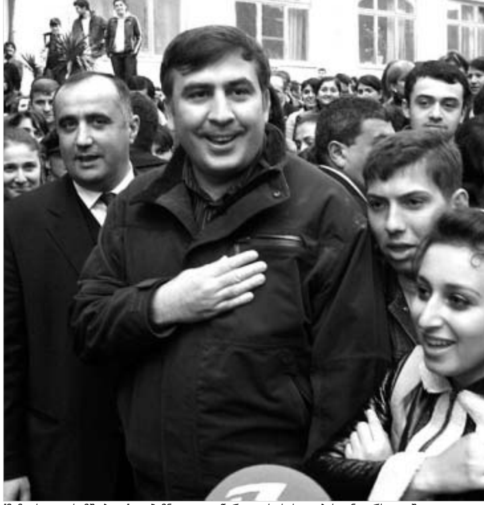
ქუთაისში „მოგზაურობა ყარაბაღში“ - ჯიშინი აკაკი წერეთლის სახელობის უნივერსიტეტში.

საქართველოს რევოლუციური პრეზიდენტის შეხვედრის ქუთაისის მოსახლეობა დიდხანს ელოდა, მიუხედავად იმისა, რომ მის კარიერაში ქუთაისის ერთგვარი სიმბოლოური დატვირთვაც აქვს: ზუსტად ორი წლის წინ მიხეილ სააკაშვილმა რევოლუციური მსვლელობა ამ ქალაქიდან დაიწყო და რამდენიმე თვის შემდეგ პრეზიდენტად კურთხევაც ქუთაისთან ახლოს, გელათის მონასტერში მიიღო. მისი მმართველობის პერიოდში იმერეთმა და ქუთაისმა ოთხი მთავრობა გამოიცვალა. საქმე იქამდეც მივიდა, რომ მოსახლეობამ ქუთაისში საპრეზიდენტო მმართველობის გამოცხადებას კი მოითხოვა. ამის მიუხედავად, მ ნოემბერს ქუთაისში ვიზიტად მყოფ სააკაშვილს ქუთაისში შექმნილ პოლიტიკურ და სახეობისუფლებო პრობლემებზე არ უსაუბრია. იგი მხოლოდ იმ ობიექტების მონახულებით შემოიფარგლა, რომლებიც ამ ბოლო ორი წლის განმავლობაში აშენდა ქუთაისში.