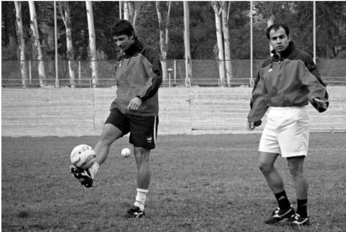
"ალანიაში" დემეტრადის მომავალი ბუნდოვანია.

გუშინდელმა ვარჯიშმა ორ საათის ვაჟთა გუნდი ლიდერობს. ჩინეთთან 2,5:1,5 დაამარჯვებინ უკრაინის ნაკრები. ლიდერს ნახევარი ქული ჩამორჩება რუსეთი, რომელიც ამჯერად სომხებს გაუსწორდა - 2,5:1,5. ამერიკის ნაკრებმა კი გაანადგურა ჩინეთის ქალთა გუნდი - 4:0. ამრიგად, ექვსე ტურის შემდეგ სატურნირო ცხრილში ასეთი მდგომარეობაა: ჩინეთი (ვაჟები) - 16, რუსეთი - 15,5, აშშ - 11,5, სომხეთი - 11, უკრაინა - 10,5, ისრაელი - 10, საქართველო - 9,5, კუბა - 7, ჩინეთი (ქალები) - 5.