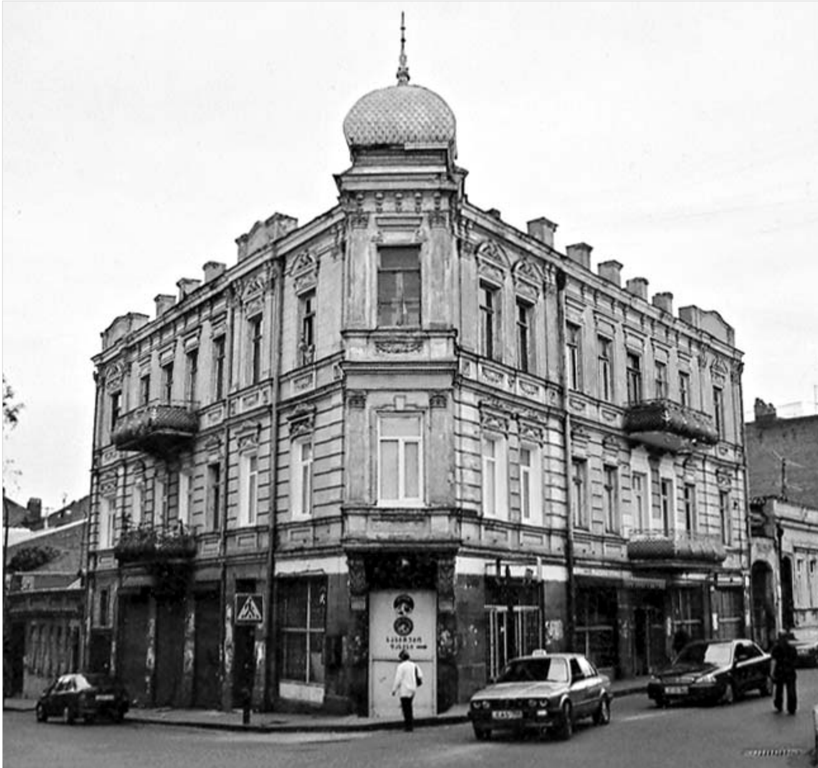
სახლი ჯავახიშვილის ქუჩაზე.

რაც შეეხება შენობის ავტორს: გიორგი ლაზარაშვილი საკუთარი სახლის პროექტს სახელმწიფო ოსტატს გრიგოლ ქურდიანს უკვეთავს. 1898 წელს ხარკოვის უმაღლესი ტექნიკური სასწავლებლის კურსდამთავრებული ინჟინერი გრიგოლ ქურდიანი (1873-1957) წარმოშობით სოფელ საგარეჯოდან იყო. საშუალო განათლება თბილისის რეალურ სასწავლებელში მიიღო. მთელი მისი პროფესიული მოღვაწეობაც თბილისთან არის დაკავშირებული. ჯერ თვითმმართველობაში მოუწევია საქალაქო ტე-