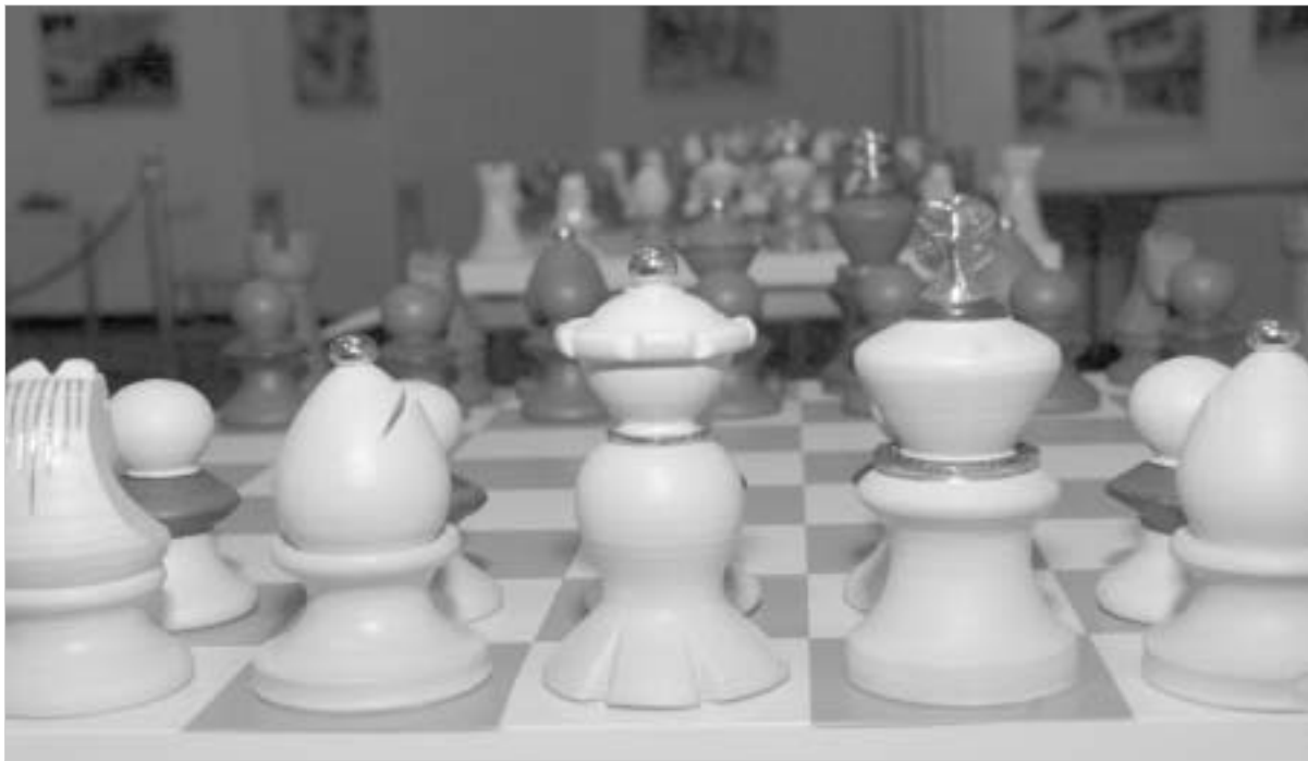
საქართველოს ნაკრებმა ჩინეთის ქალთა გუნდს ვერ მოუგო.

ისრაელის ქალაქ ბერ-შივაში მიმდინარე მსოფლიოს გუნდურ ჩემპიონატზე მეხუთე ტურის მატჩები გაიმართა. გასულ უქმეებზე ჩვენი ქვეყნის ნაკრებს საშუალება ჰქონდა სატურნირო ცხრილის შუაგულისკენ წაენია, მაგრამ ჩვენმა დიდოსტატებმა შაბათს ვერ დამარცხეს ტურნირის უპირობო აუტსაიდერი ჩინეთის ქალთა გუნდი (2:2) და ეს შანსი დაკარგეს. კვირას კი საქართველოს ვაჟთა ნაკრები ჩინეთის გუნდს შეხვდა და გამანადგურებელი მარცხი იწვინა - 3:5:0. ამრიგად, ხუთი ტურის შემდეგ ჩვენი ქვეყნის ნაკრებს 6,5 ქულა აქვს და ბოლოდან მისამე, ანუ სატურნირო ცხრილში მეშვიდე ადგილზეა. ქართველები ნახევარი ქულით უსწრებენ კუბას და