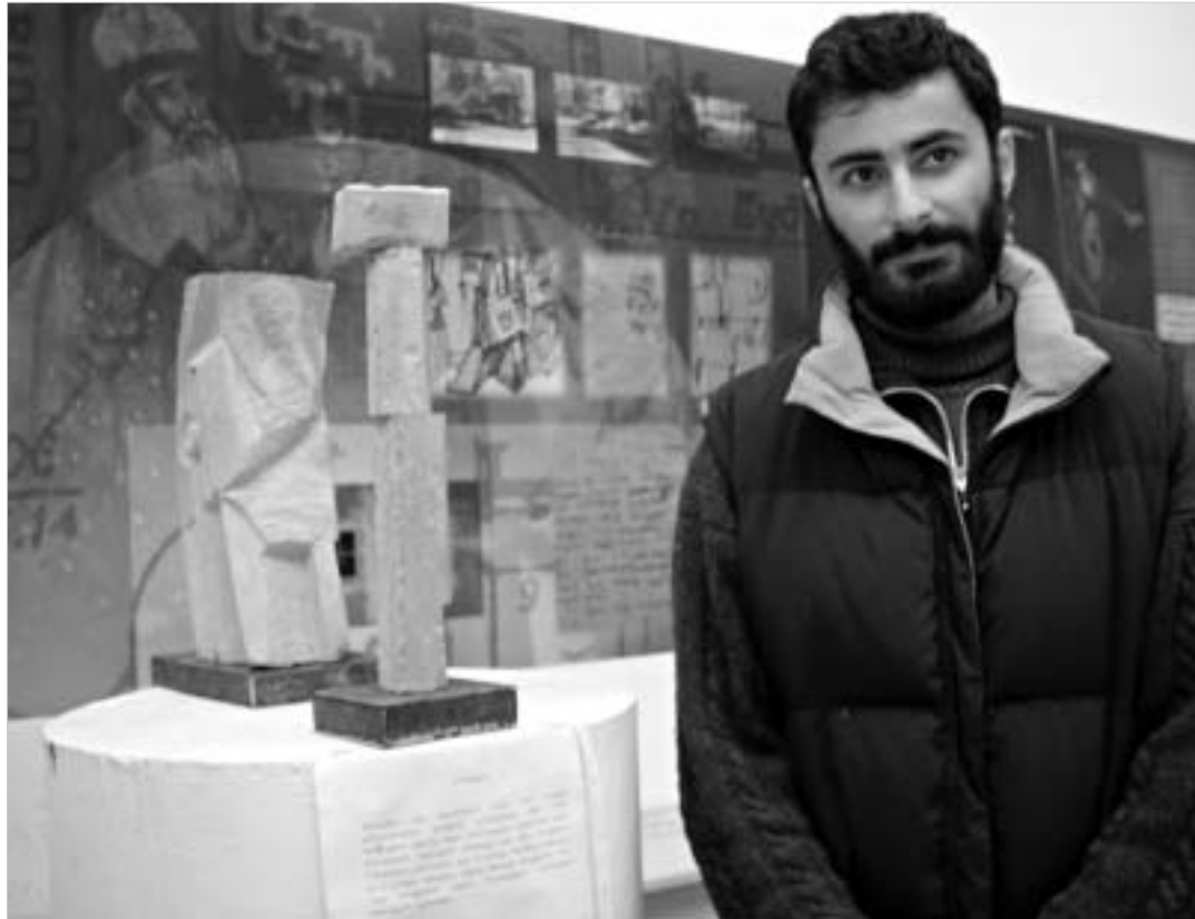
გამარჯვებული ნამუშევარი და ავტორი.