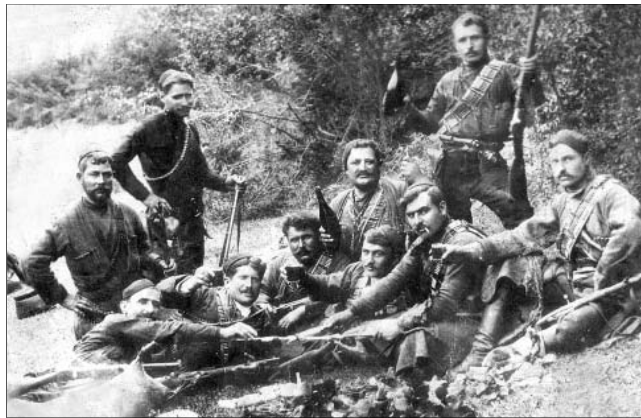
ხარება და გოგია რაზმთან ერთად შუამთის ტყეში.