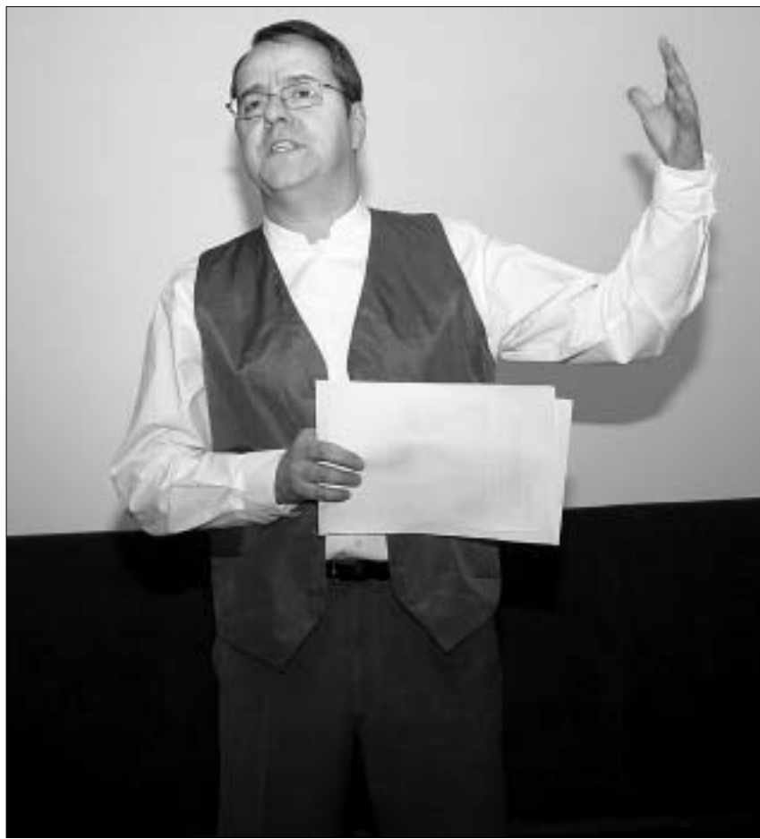
ფრანსუა ლორანი საინტერესო ფილმებს გვპირდება

14 ივნისს სამაქტიან, 224 წუთიან "ტრისტან და იზოლდას" (110 წუთი), მოვისმენთ.