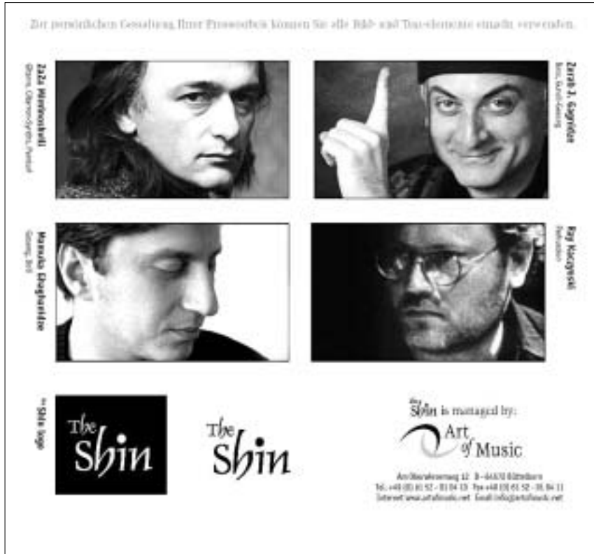
"შინის" გერმანელი ალბომი

ნენ გერმანელი. კონცერტის ბოლოს გერმანულმა ჯგუფმა "ლაოდა" მრავალპიანო და დაგუგუნდა და ქართველი მსმენელის შესაბამისი ოვაცია გამოიწვია.