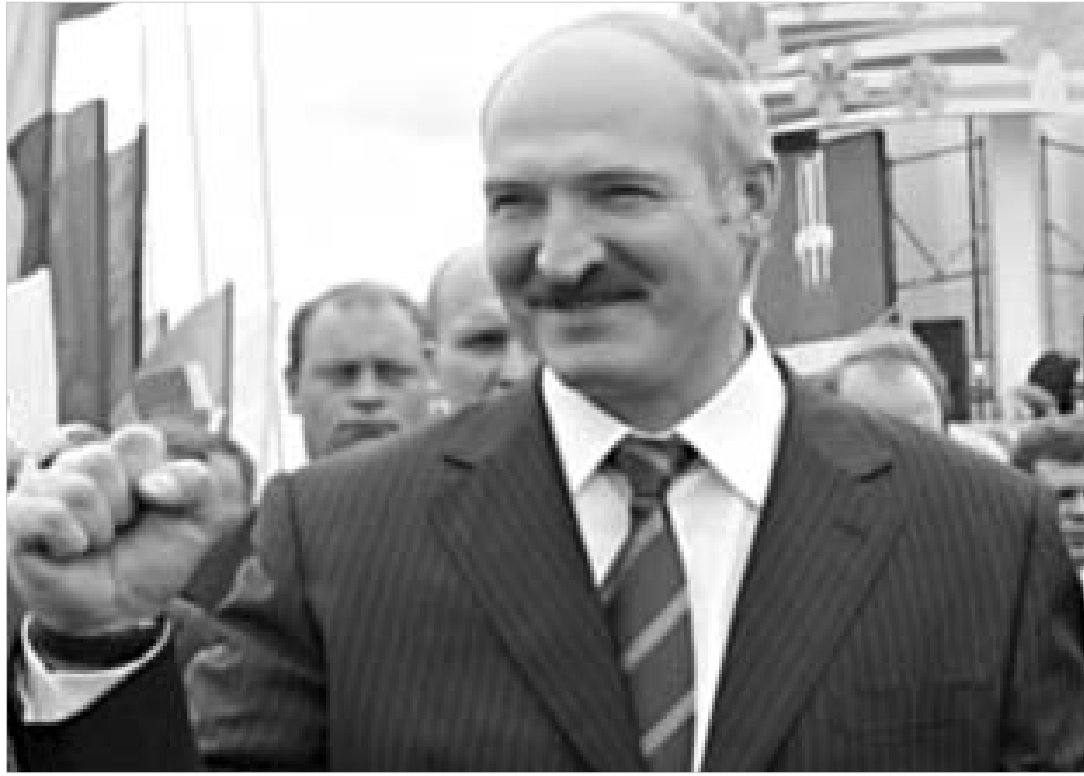
ამ დღისთვის მუშის უკან ევროპის უკანასკნელი დიქტატორი იმალემა.