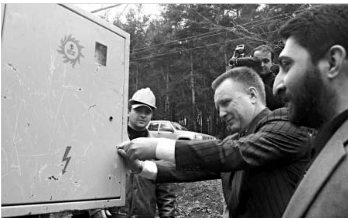
გამორცხველიანების პროცესი დაიწყო.