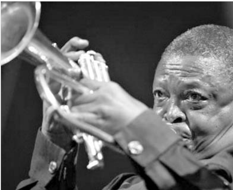
ჰიუ მასაკელა ახალ ორლენში.

ასე რომ, ნახევრად დაცარიელებული ქალაქის მიუხედავად, კულტურული ცხოვრება ხელ-ნე-