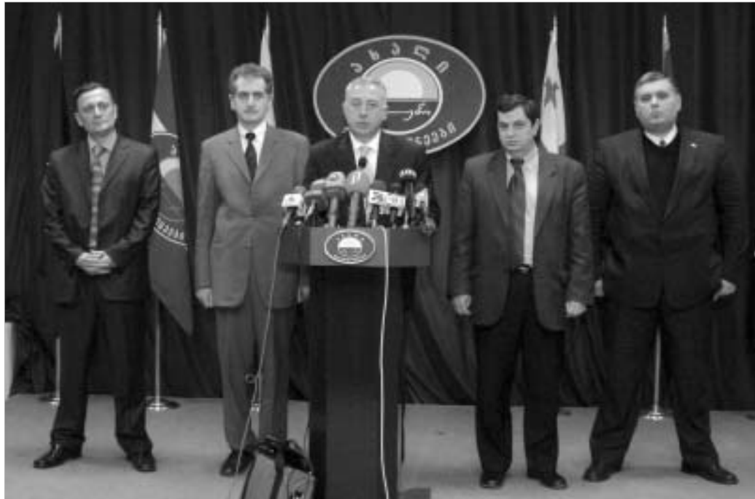
ოპოზიცია საერთაშორისო საზოგადოებაზე იწყებს აპელირებას.