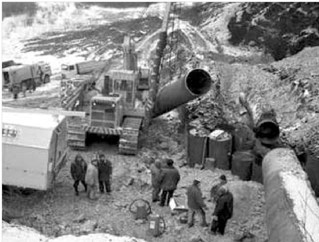
მაგისტრალური გაზსადენი საქართველოს სატრანსპორტო ფუნქციის გაძლიერების სტრატეგიული ბერკეტი.