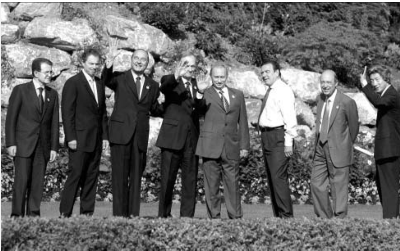
დიდი რვიანის საიტები სახელმწიფოთა ლიდერების მოკლევადიან შეხვედრებებს ემსახურება.

სწორედ საიტის წინ, ამერიკის პრეზიდენტმა სცადა ამ საკითხზე კრიტიკა თავიდან აეცილებინა და განაცხადა, რომ ღარიბ ქვეყნებში შიდსთან ბრძოლისათვის ამერიკა 15 მილიარდ დოლარს გაიღებს. ჰუმანიტარულმა