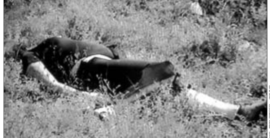
სასაფლაოზე აღმოჩენილი გვამი.

თავარ კაცობაში მუხათგვერდის სასაფლაოსთან, ხრამში, შემთხვევით გამკვლვმა მწყემსებმა თავმოჭრილი ქალის გვამი იპოვეს. ინფორმაციის მიღებისთანავე შემთხვევის ადგილზე გასულმა ქალაქის პოლიციის მთავარი სამმართველოს და ვაკე-საბურთალოს რაიონის პოლიციის თანამშრომლებმა გვამის შორიასლის მკვლელობის იარაღი, სისხლიანი მკვრე ზომის დანასაც მიაგნეს. სამდღიანი მუშაობის შემდეგ, გუშინ ვაკე-საბურთალოს რაიონის პოლიციაში გამართულ პრესკონფერენციაზე თბილისის პოლიციის მთავარი სამმართველოს უფროსმა ლევან მაისურაძემ მკვლელობა გახსნილად განაცხადა. დღისათვის უკვე დადგენილია, როგორც მოკვლევის ვინაობა, ასევე დაკავებული არიან მკვლელობაში ეჭმიტანილები.