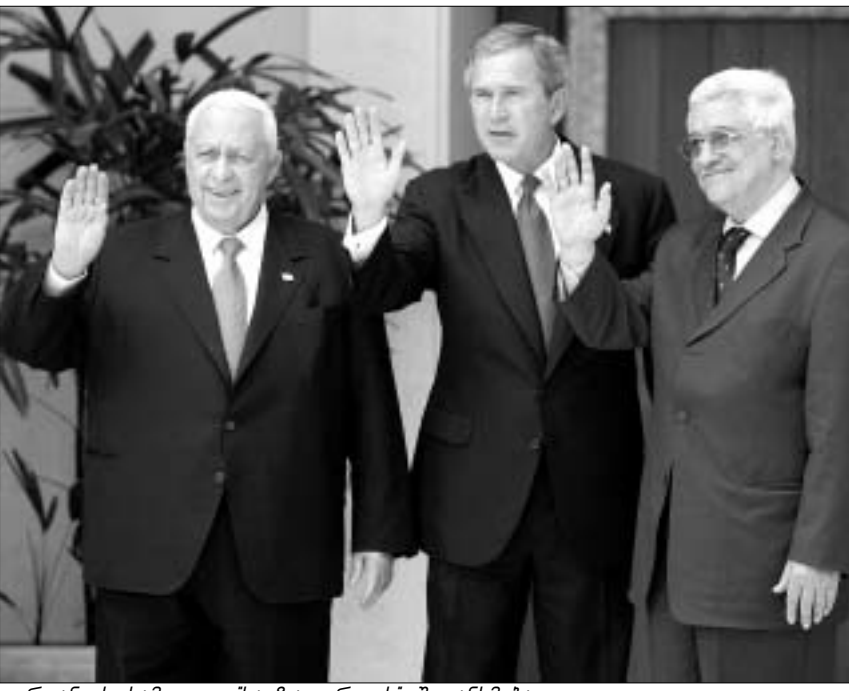
იორდანის სამიტი - "საგზაო რუკის" შეთანხმება.

"პრეზიდენტი დარწმუნებულია, რომ პრემიერ-მინისტრი მაჰმუდ აბასი თავის სამშვიდობო განცხადებაში გულწრფელია" განაცხადა თეთრი სახლის ოფიციალურმა წარმომადგენელმა. ცხადია, მაჰმუდ აბასი ყველანაირად შეეცდება, რომ ვაშინგტონის ნდობა გაამართლოს. ამის დემონსტრირება და უკომპრომისო ინტეგრირება უნდა დასრულდეს და ჩვენი მიზნების მისაღწევად მშვიდობიანად საშუალებებზე უნდა გადავიდეთ." განაცხადა აბასმა. მან რადიკალიზირებული განაღებულა და უსაფრთხოდ უნდა იცხოვროს.