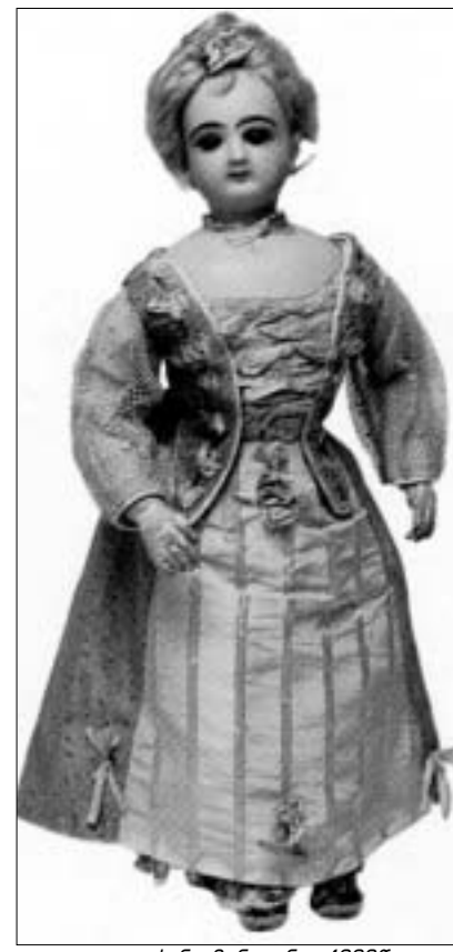
Jumeau თოქინა-მანეკინი. 1880წ.