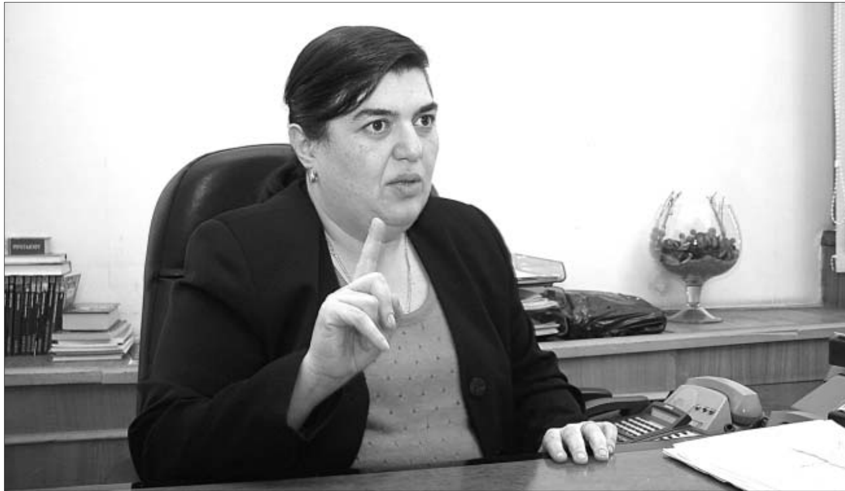
ამ ცესკო-მ არჩევნები არ უნდა ჩაატაროს.