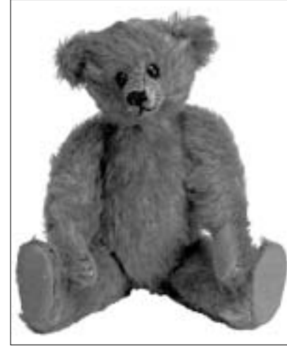
Farnell პლუმის დათვი. 1920წ.

ადგილობრივი წარმოებები სწრაფად გადაერთვნენ პლუმის დათვების დამზადებაზე, გაჩნდა ბევრი ახალი ფირმა Farnell, Deans, Chad Valley. როგორც ამბობენ სწორედ ბრიტანულ ფირმაში Farnell შეიქმნა ორი-ნაწილი ვინი პუში, რომელმაც შთააგონა ბრიტანელი მწერალი ლან ალექსანდრ მაილნი ცნობილი მოთხრობების დასაწერად. მეორე მსოფლიო ომის შემდეგ დათვების სტილი შეიცვალა – მათი ბუნე უფრო ფუმფულა გახდა, დაუმოკლდათ თათები და სახე კი მიბრტყელებული გაუხდათ. მსუბუქი და ხარისხიანი ირლანდიური მოჭერი სინთეტიკური მასალებით შეიცვალა.