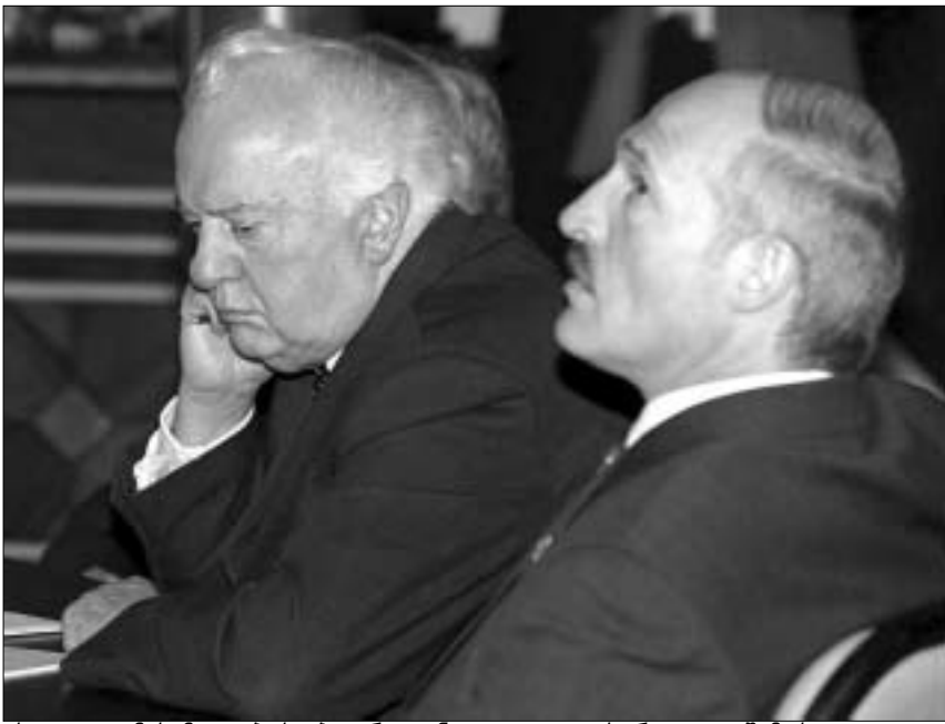
ეს ფოტო მესამედ იბეჭდება. რადგან კვლავაც გასარკვევია შემთხვევით სხედან გვერდი-გვერდ შევარდნაძე და ლუკაშენკო?

ნუთუ ამის გამო უნდა უიხრათ სოროსის, რომ საქართველოში ვეღარ იქნება? და ვის ბაძავთ ამით? რუსეთს და უკრაინას?