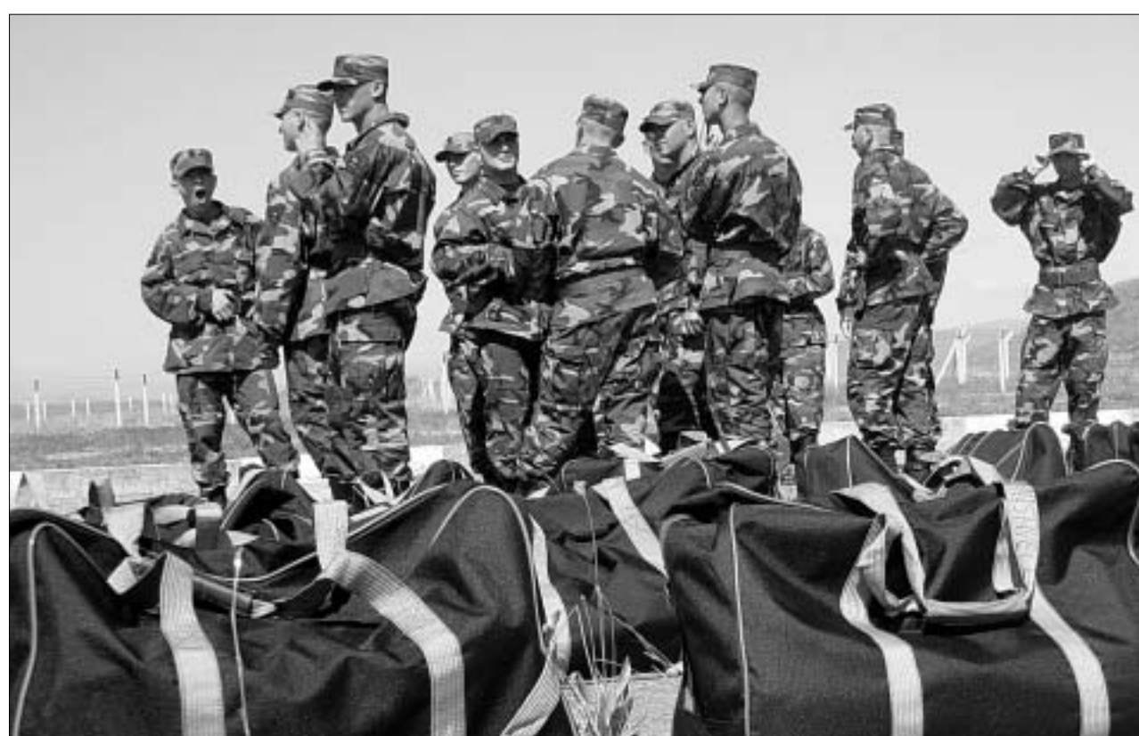
ქართველი მშვიდობისდამცველები თვითმფრინავის მოლოდინში.