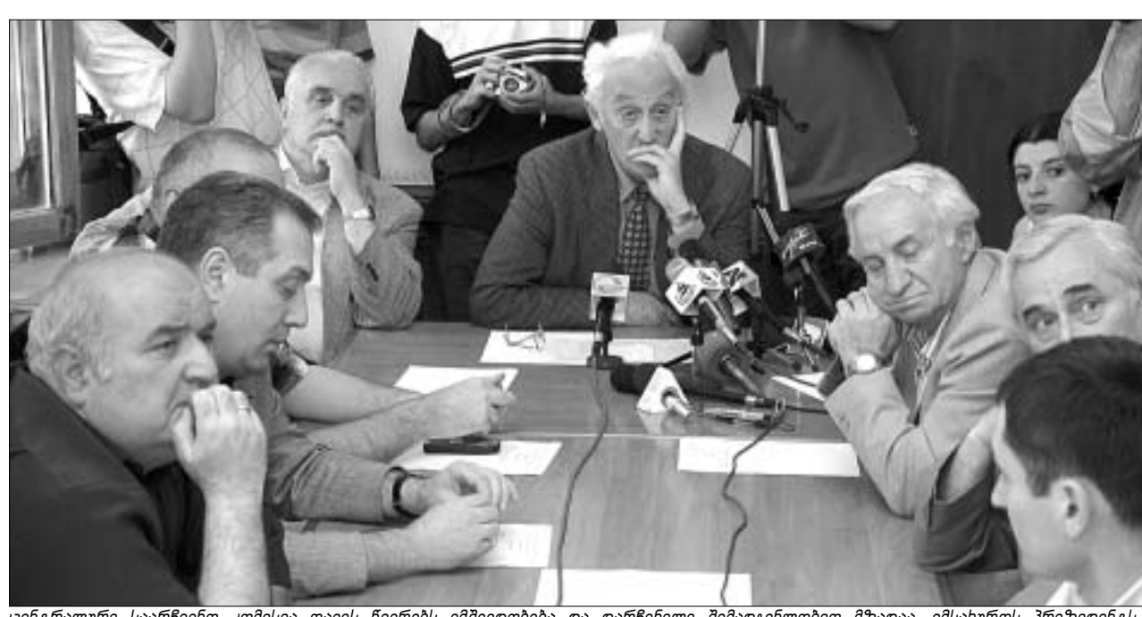
ცენტრალური საარჩევნო კომისია თავის წევრებს ემზიდობება და დარჩენილ შემადგენლობით მზადდა. ემსახურს პრეზიდენტს.