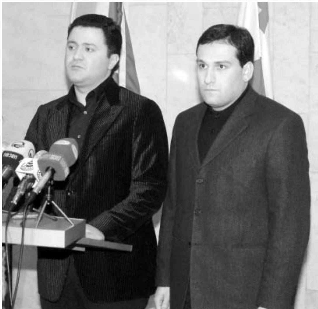
საზოგადოების მოთხოვნა შესრულებულია.