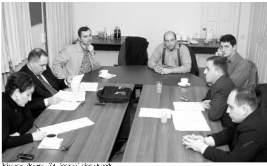
მრგვალი მაგიდა "24 საათის" რედაქციაში.