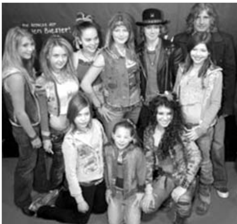
ფილმში მონაწილე ბავშვები