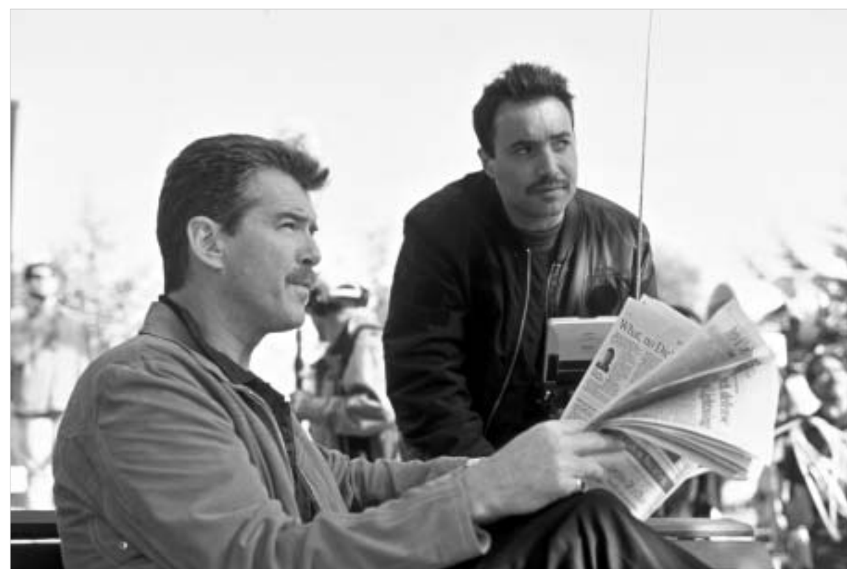
პირს ბროსნანი ახალი იმიჯი იქნა

"მატადორში" პირს ბროსნანის ვიზუალური გარდასახვა მართლაც 100 პროცენტით შედგა. იან ფლეგინგის ქარიზმატული აგენტის როლის შესრულებისას ხომ მსახიობს არასდროს დასჭირვებია ფეხის ფრჩხილებზე ლაქის გადასმა, თინეჯერი გოგონასავით გამოწყობა, ანდა სასტუმროს ვესტიბულში ტრუსითა და კოვბოის ჩექმით სიარული. არასდროს დასჭირვებია, მაგრამ როცა ამის შანსი მიეცა, უარი არ თქვა. ნიუ იორკელი რეჟისორი აცხადებს: "პირს ძალიან უნდოდა, რამე ახალი შეტევა აეღო საკუთარ თავზე. მზად იყო თავისი კარიერაც გაერისკა. ფილმი რომ არ გამოგვევლიოდა, ის ალბათ ძალიან სასაცილო სანახვი იქნებოდა მაყურებლის თვალში. მაგრამ ყველაფერი კარგად დამთავრდა.