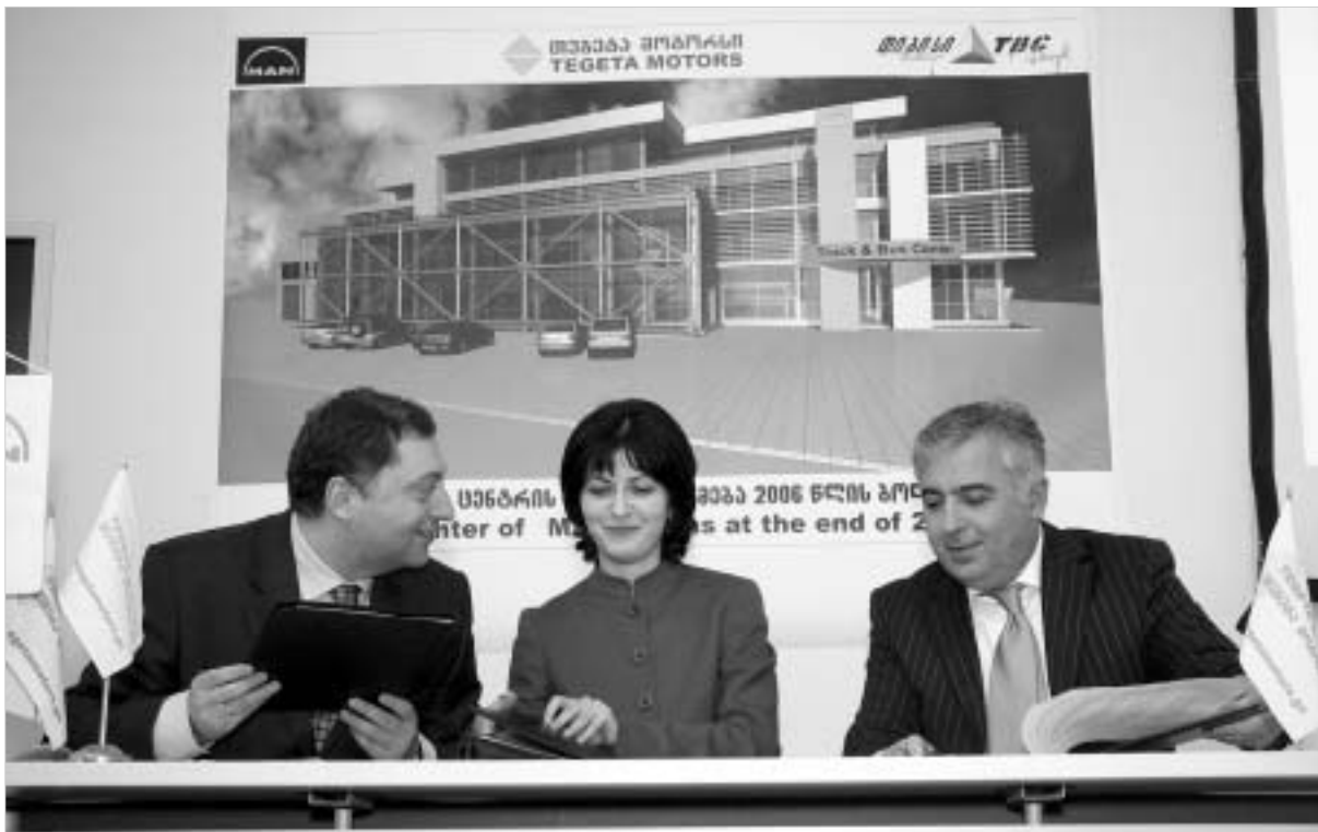
ურთიერთთანამშრომლობის მემორანდუმის ხელმოწერა.

"თიბისი ბანკი" MAN-ის ტექნიკის შექმნას თავის კლიენტებს 100 პროცენტით დაუფინანსებს. სხვა შემთხვევებში ბანკი MAN-ის ტექნიკის ღირებულების 80 პროცენტის დაფინანსებას აიღებს საკუთარ თავზე. ტექნიკის შექმნა შესაძლებელია როგორც საბანკო სესხის, ისე ლიზინგის საშუალებით - სალიზინგო მომსახურებას კლიენტებს კომპანია "თიბისი ლიზინგს" გაუწევს. "თეგეტა მოტორსი" და "თიბისი ბანკის" ეს ერთობლივი მომ-