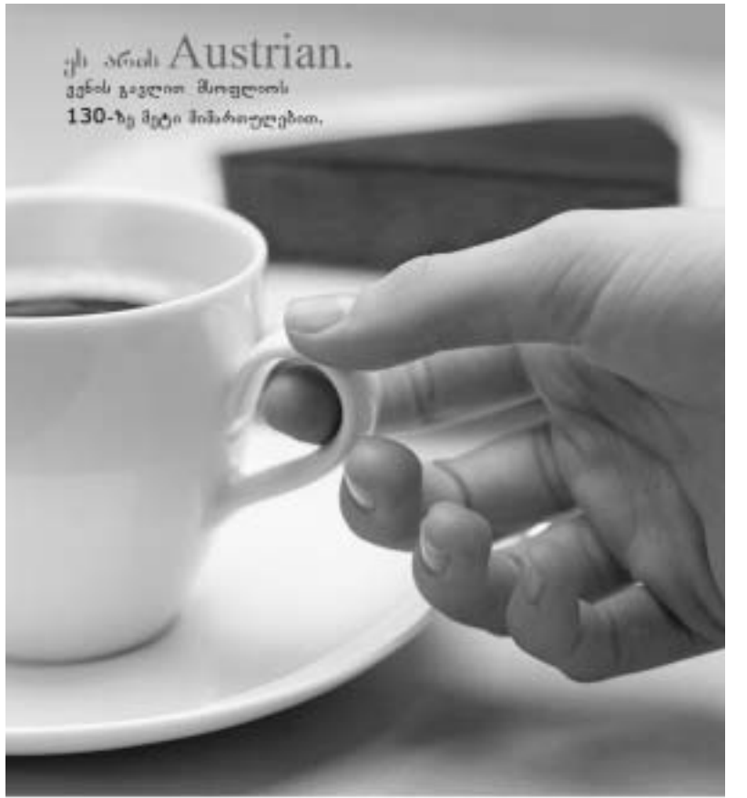
გაფანტული ავსტრიის ივიანზეები ვენის საერთაშორისო ავიაპორტის ვაგონში, რომელიც ევროპის უსწრაფესი და ყველაზე კომფორტული სტრატეგიული ავიაპორტია და აღიარებულია როგორც მსოფლიოს კლასის მომსახურებით, ასევე ავსტრიული მუგობრული სტუმართმოყვარეობით. დამატებითი ინფორმაციის და დაქვანისთვის, გთხოვთ დაეკავშირდეთ www.aus.com/ge , ☎ 77 45 06/10 ან დაეკავშირდეთ თქვენს სამოგზაურო სააგენტოს.