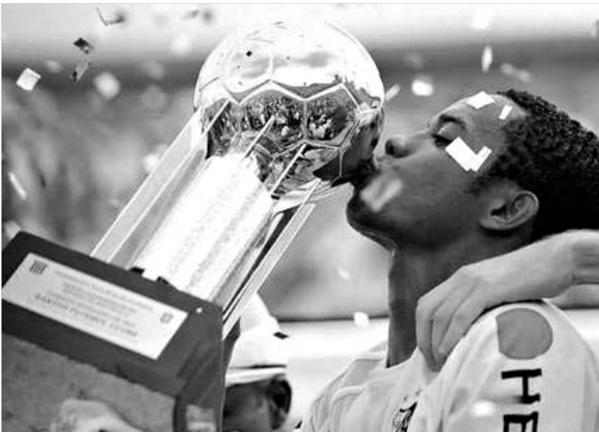
რობინიო ლუბიშურგოს ფავორიტია.

არ ვიცი. მე ფეხბურთელებს მინდორზე სრულ თავისუფლებას ვანიჭებ. ამავე დროს ვთხოვ, საკუთარ თამაშს ბუნებრივად ელფერი არ მოაკლინ. რობინიო მსოფლიოს საუკეთესო ფეხბურთელი გახდება. ამაში ერთი ნუთითაც არ შეპარება ეჭვი.