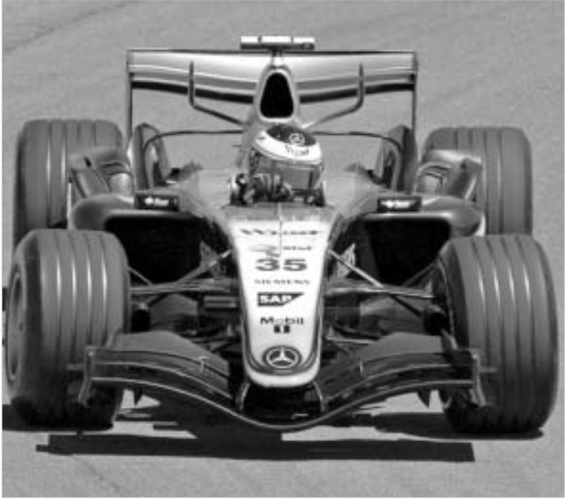
ფორმულა 1-ში წესები კვლავ იცვლება.

ამ სიახლის თაობაზე ითქვა 22 ოქტომბერს ლონდონში, ავტოსპორტის საერთაშორისო ფედერაციის (FIA) მიერ მონეობილ სამუშაო შეხვედრაზე, რომელშიც მონაწილეობა მიიღეს "სამეფო რბოლის" ათივე გუნდის წარმომადგენლებმა. გადამწყდა, რომ 2006 წელს საკვალიფიკაციო სესია სამ წინააღმდეგობრივად 15-ნუთიანი მონაკვეთის შემდეგ გათამაშებას გამოითქვება ის ხუთი ბოლიდი, რომლებიც წრეს ყველაზე ცუდი შედეგით დაფარავენ. იგივე ხედვრს გაიზიარებს ის ხუთი პილოტიც, რომლებიც მეორე 15-ნუთიან მონაკვეთზე დაფიქსირებენ უარეს დროს. ფინანსურ სესიაზე კი, რომელიც 20 ნუთს გავრცელდება, დარჩენილი ათი ბოლიდი და მათი პილოტები პოლიპოზიციონა და დანარჩენი პოზიციების მფლობელების ვინაობას გაარკვევენ. ფორმის ასე რადიკალურად შეცვლა გუნდების და სატელევიზიო