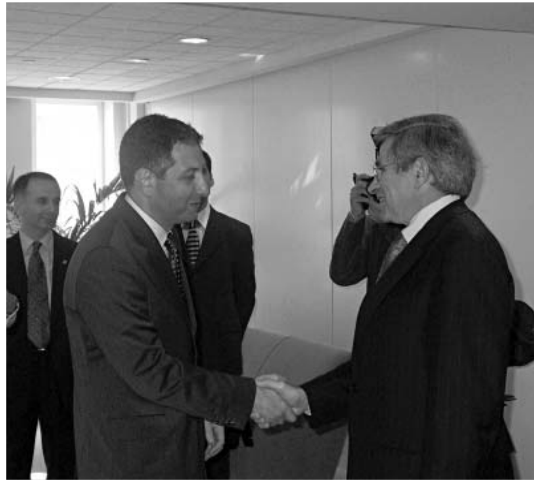
ზურაბ ნოღაიდელის შეხვედრა მსოფლიო ბანკის პრეზიდენტთან პოლ ვულფოვიტთან.