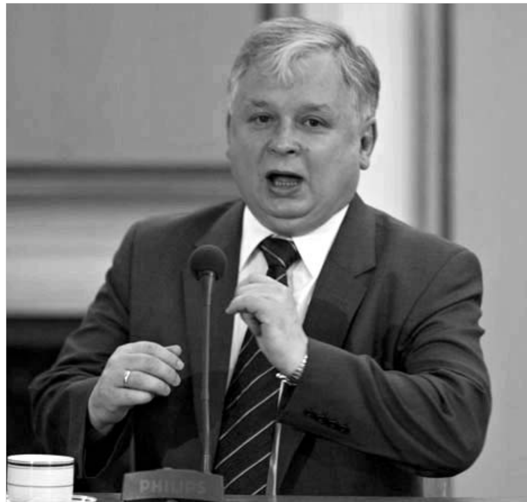
გამარჯვებულმა ლუბ კაჩინსკიმ რუსეთისთვის ულტიმატუმთა წამოყენება დაიწყო.