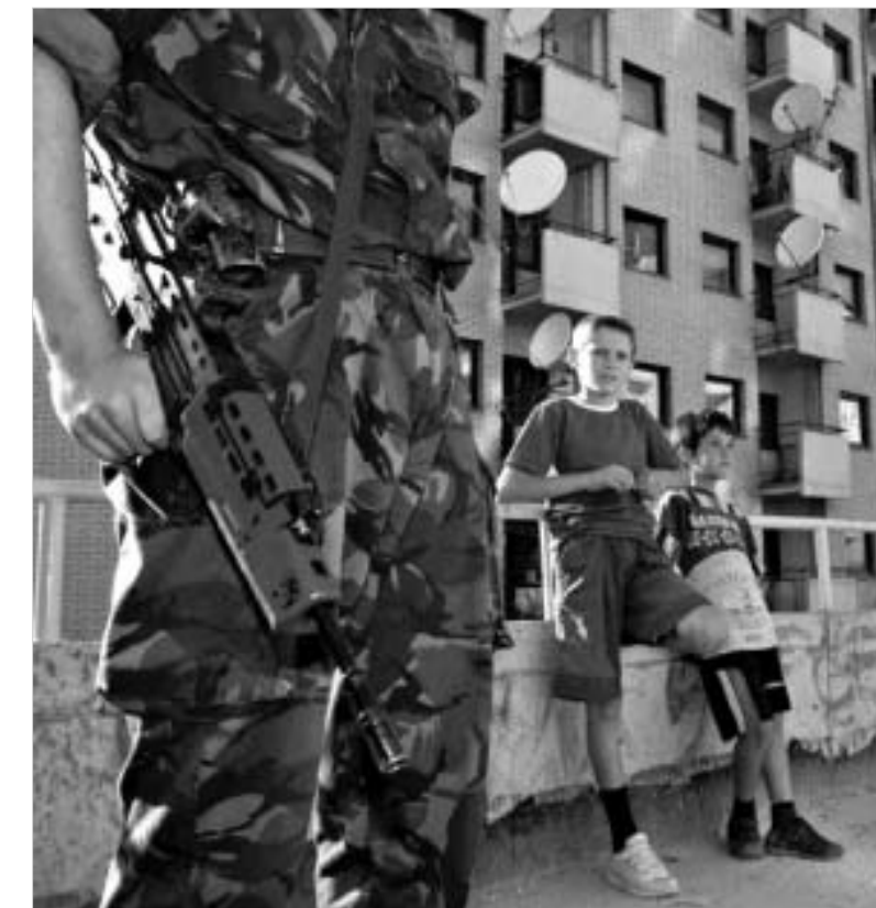
საერთაშორისო ინსტიტუტები კოსოვოში არსებულ სტატუს-კვოს არმდგარად მიიჩნევენ.

კოსოვოს გაეროს წარმომადგენლის კაი ეიდეს აზრით, იმისთვის, რათა გადაწყვეტი კოსოვოში სერბი ლტოლვილების დაბრუნების საკითხი, აუცილებელია, განისაზღვროს კოსოვოს სტატუსი. "შეგრა, რომ დღეა დრო, დაიწყოთ მოლაპარაკება კოსოვოს სამომავლო სტატუსზე. შარშანდელიდან მოყოლებული - აქტიური საერთაშორისო მხარდა-