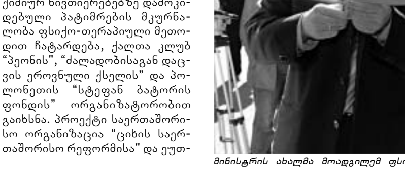
მინისტრის ახალმა მოადგილემ ფსიქო-სარეაბილიტაციო ცენტრი გახსნა.

მსივე თემით, აღნიშნული პროექტი ამერიკისა და ევროპაში აპრობირებული მეთოდი და ამავეარი სარეაბილიტაციო ცენტრ-