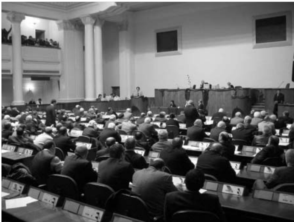
საპარლამენტო სესიის დროს

მით უფრო ძლიერია ოპოზიციაც. ერთადერთი შემთხვევა სიმართლედ რომ მხოლოდ კამათში დგინდება. საინტერესოა, ეტყობა, ჩვენ აქაც დამსწრე სტადიაში ვიმყოფებით. მე იმ დროზე ვიცნობდი, როდესაც საქართველო დროის დანატოვარ გლობალურ პრობლემებს გადალახავს და ცივილიზებული სახელმწიფოსათვის აუცილებელი ნიშან-თვისებების სპექტრს მიაღწევს და დაკრულზე არ ბეჭდები ერთ-ერთ უმთავრესად კი ობიექტურ უნარს მქონე ოპოზიციას და ამ ოპოზიციის მიყურადების, მოსმენის და აზრის გათვალისწინების უნარს მქონე ხელისუფლებას მივიჩნევ. ოპოზიციას, რომელიც ნარჩენების უნარის მქონე ოპოზიციის პრინციპი ქვეყნის კეთილდღეობა და არა ხელისუფლებასთან ბრძოლა იქნება. ოპოზიციას, რომელიც ვინაღაცა მხოლოდ ქვეყანაზე იფიქრებს და ვინორ ხიდზე შეხვედრილ ჯიხურს და მისი დახმარება უნდა მოსამართლეებზე, სალარო აპარატურაზე უფრო ჩამოყალიბებულია. რაც უფრო ძლიერია ხელისუფლება,