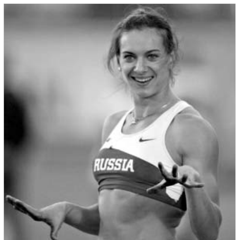
ინინბაევა მსოფლიო ჩემპიონატის სახეა.