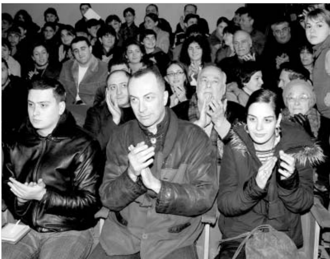
დასმურ საზოგადოებამ კლიმის ჩვენება რამდენჯერ მოითხოვა.