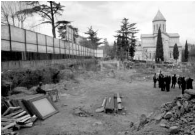
ჩვენ აქ ავაშენებ...

რუსთაველის 7. უკვე დიდი ხანია, რაც ეს ადგილი საკმაოდ მეტად ცარიელი გვეჩვენება და ამ მოჩვენებების გარდა ბევრი არცთუ სასიამოვნო ამბავიც გვაკონტაქტებს. გავლა-გამოვლისას კი არაერთხელ დაგვბადებია კითხვა, მაინც როდის მოეცლება სივრცეს, რომელიც ამკარად ითხოვს გასუფთავებასა და პატრონობას. თუ ამ ბოლო დროს გუდიაშვილის ქუჩაზე ამ ადგილას გავივლით, მიხვდებოდით, რომ პატრონი გამოჩნდა. თუ გამოკიდულ ბანერსაც ახედავდით, იმასაც მიხვდებოდით, რომ იქ იმაზე მეტის გაკეთებას აპირებენ, ვიდრე უბრალოდ გასუფთავება გახლავთ.