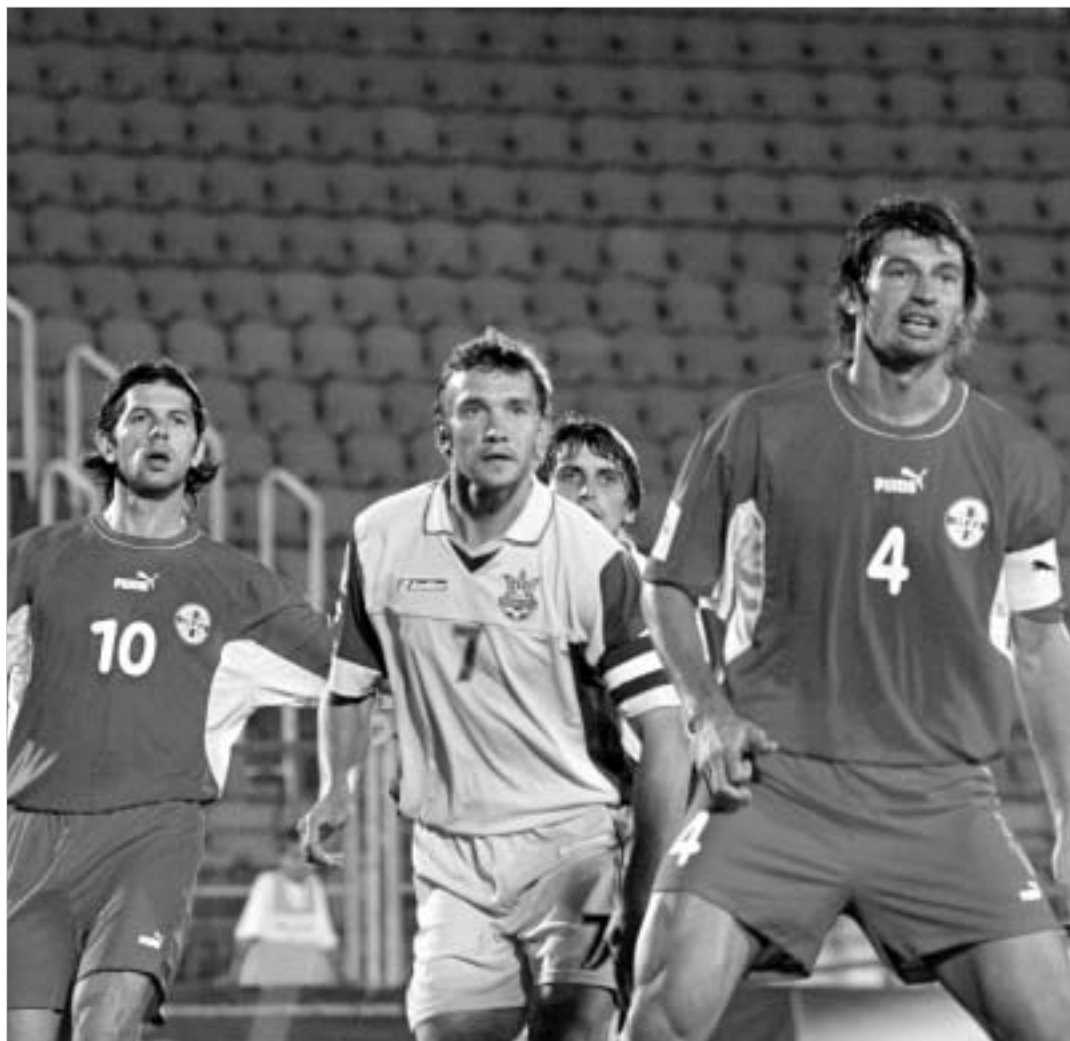
უკრაინა-საქართველოს მატჩში ერთმანეთს დაუპირისპირდებიან თანაურნი კლდით და მუქარა, რომელიც საქართველოს ნაკრებისთვის ყველაზე დიდი თავსატეხი იქნება.