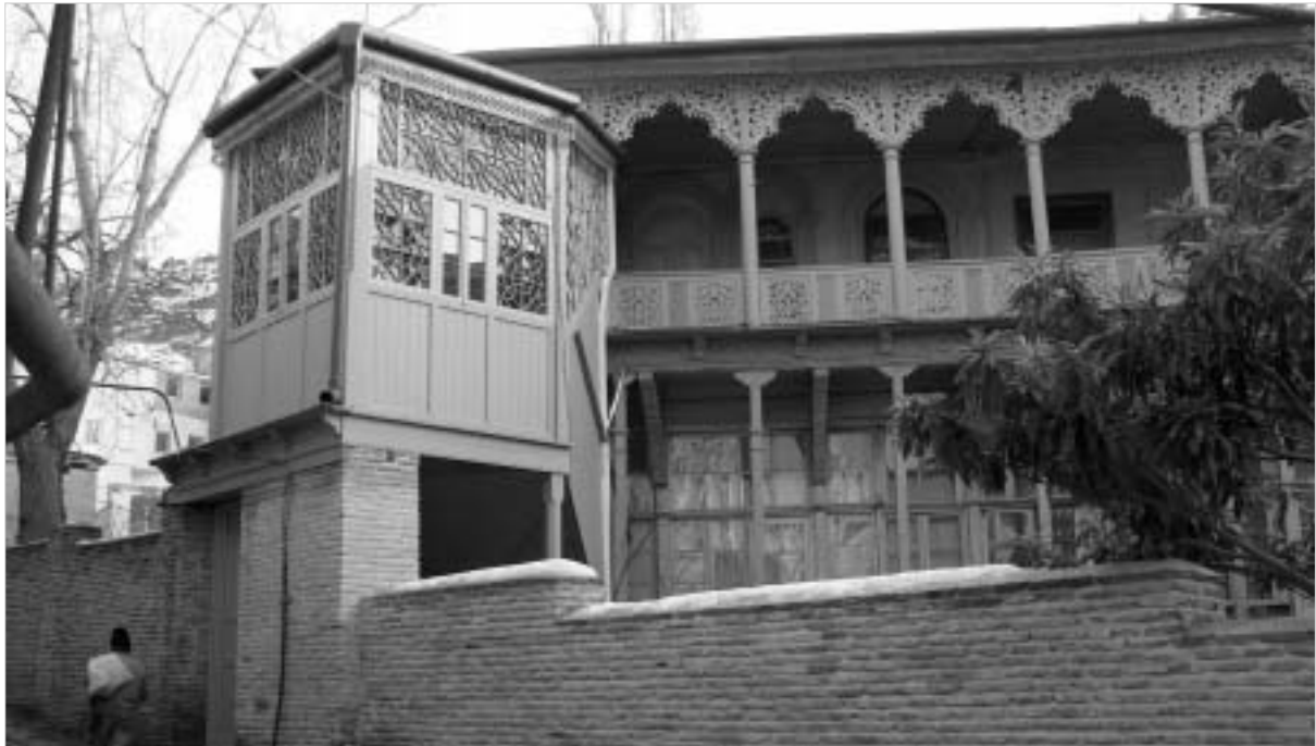
სახლი ბეთლემის ქუჩაზე

მართლაც, უკანასკნელ ხანს აქ ძალიან ბევრი სასიკეთო რამ განხორციელდა. ამჯერად მხოლოდ ერთ მაგალითს შევხვებით: როდესაც დააკვირდებით თუნდაც მშენებელთა რეაბილიტირებულ ნაგებობას ბეთლემის ქუჩა N 3 (რომელიც არცთუ დიდი ხნის წინ საგალალო მდგომარეობაში იყო), რწმუნდებით: ქალაქის ძველ უბანთან რეკონსტრუქციის უტოლია სრულებითაც არ არის. ეს ნაგებობა, თავისი ულამაზესად მოწყობილი მორთულობით ნათელიყოფს, რომ ამქრული ხელოვნების ფუნდამენტური ტრადიციის საფუძველზე ჩვენი თბილისური საცხოვრებლის მართლაც ბრწყინვალე, უდავოდ საერთაშორისო ფასეულობის ნიმუშები იქმნებოდა. ამ სახლში მეტად ორიგინალური ზურთმოდირების ენით გაჯანსაღებულია სამყაროს საიდუმლოთა ამოცნობის შემოქმედებითი სიხარული, თარგმანებული მისი ფანტასტიკური დეკორაციის მწყობრ აღნაგობაშიც, სივრცის გულდასაძვრებულულობაშიც, და საზოგადოდ, მაღალი პარამონის აუნერულ განცდაშიც.