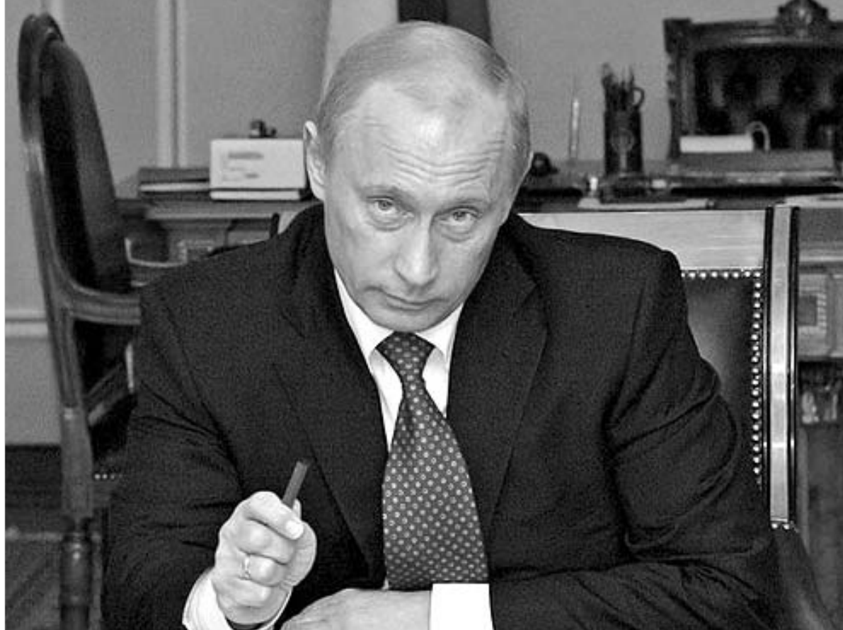
მ-7 ერთმნიშვნელოვნად უნდა განაცხადოს, რომ არ გახდება თავის მეზობლებზე რუსეთის ჰეგემონიის აღდგენის თანამონაწილე

მას შემდეგ შროიდერი პოლიტიკურ სცენას ჩამოსცილდა და, ცხადია, მხოლოდ უზარალო დამთხვევაა, რომ მას რუსულ სახელმწიფო კომპანია “გაზპრომში” მიმნიღველი თანამდებობა შესთავაზეს. მის შემგვიდრ ანკლავი მერკელს კრემლის წინაშე მუხლზე შედგომს