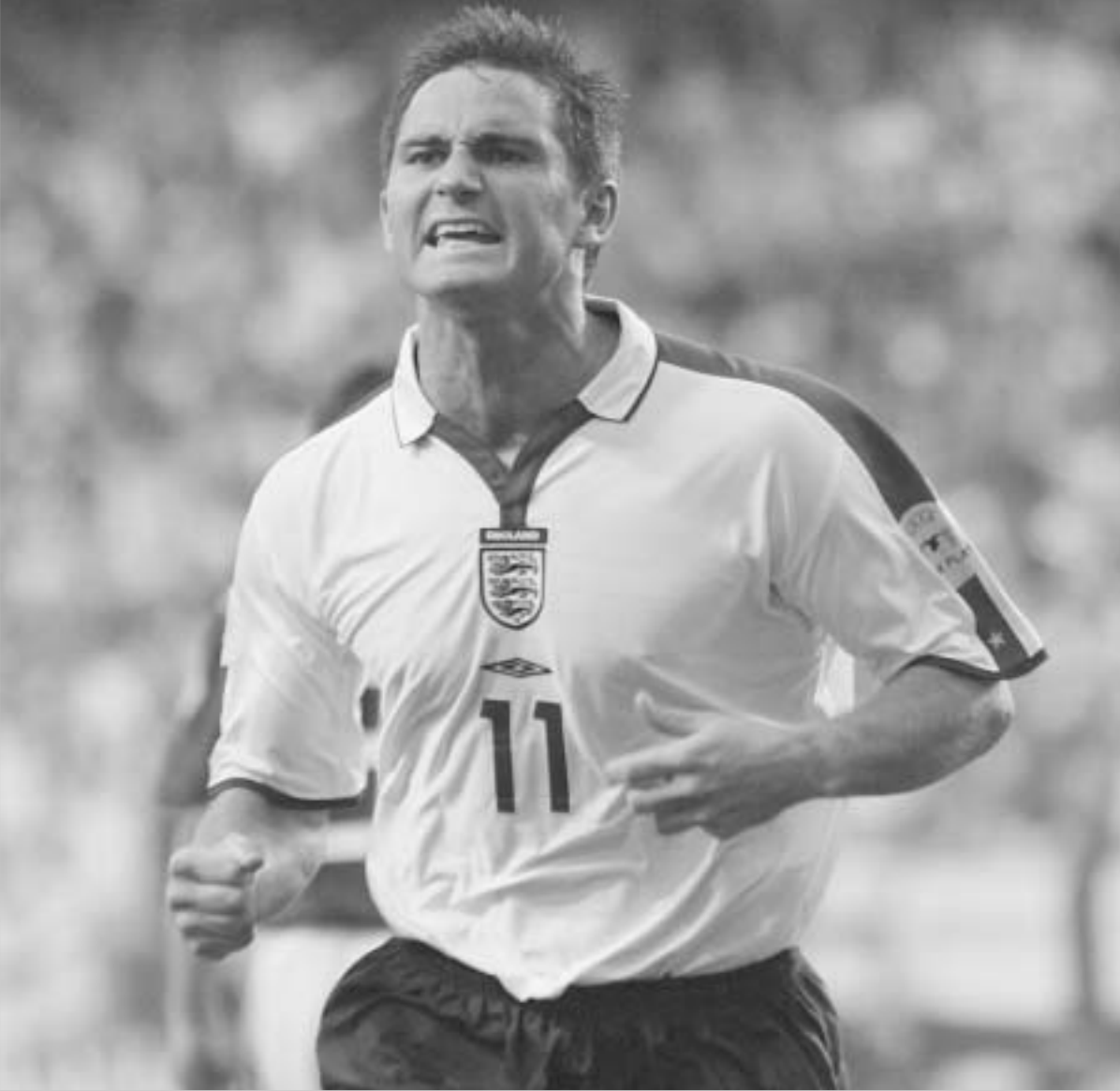
ფრენკ ლამპარდმა ინგლისის ნაკრები მსოფლიო ჩემპიონატზე გაიყვანა.

პოლანდიის, პოლონეთის, ინგლისის, იტალიის და ხორვატიის ნაკრები გუნდები მომავალი წლის ზაფხულში გერმანიაში მსოფლიო ჩემპიონატზე გავმგზავრებიან. ასეთი გახლავთ გუმბინში ევროპაში გამართული შესარჩევი შეხვედრების მთავარი შედეგი.