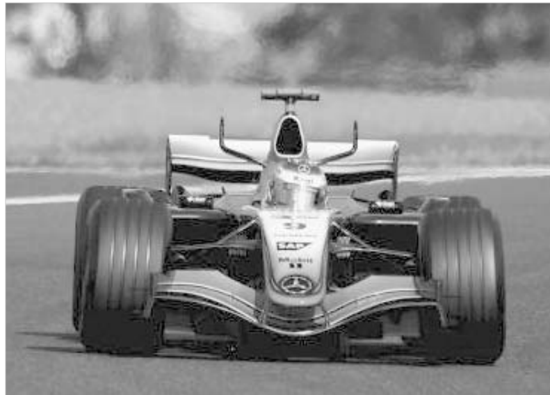
რაიკონენმა იაპონიის დიდი პრიზი ბოლო წრეზე მოიგო.

არ შეეცდებით თუ ვიტყვით, რომ "იაპონიის დიდი პრიზი" წინამორბედი რბოლებისგან ამ კარად თვალსაჩინო გამოდგა. სწორედ ასეთ რბოლებზე ოცნებობდნენ სამეფო ბოლოადა გულშემატკივრები. ფორმულა 1-ის მსოფლიო ჩემპიონატის ბოლოს წინა ეტაპზე მოვლენები კალიდოს კოპური სისწრაფით იცვლებოდა. რბოლის კულმინაცია კი ბოლო წრე გამოდგა, როდესაც ფინელმა კიბი რაიკონენმა სეზონის მეორე გამარჯვებისკენ მიმავალ იტალიელ ჯანკარლო ფიზიკელს გვერდი აუქცია და სეზონის მეშვიდე გამარჯვება მოიპოვა.