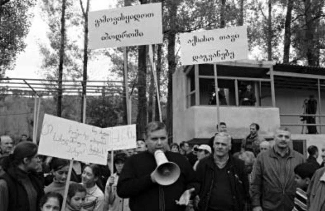
საპროტესტო აქცია იბრძომისთვის.