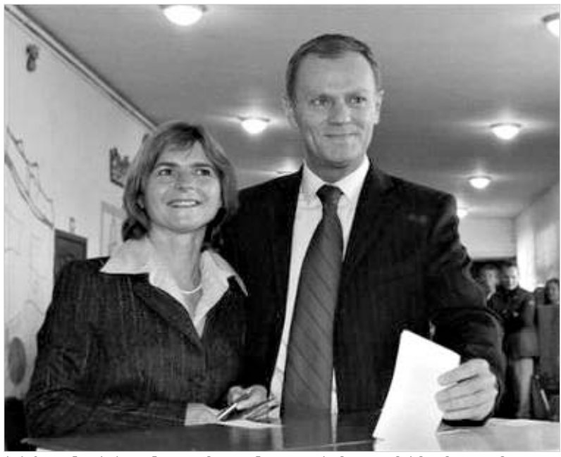
პრეზიდენტობის კანდიდატმა დონალდ ტუსკმა და მისმა მეუღლემ ქალაქ სოპოტის ერთ-ერთ საარჩევნო უბანზე მიესალმნენ.

პოლონეთში სპრეზიდენტო არჩევნების პირველი ტური შედგა. ქვეყნის ევროკავშირში გაწევრიანების შემდეგ გაუმძინდელი არჩევნები პოლონეთის პირველი საპრეზიდენტო არჩევნები იყო. საარჩევნო უბნები მთელი ქვეყნის მასშტაბით, ადგილობრივი დროით, დილის 8 საათზე გაიხსნა და ხმის მიცემის პროცედურა საღამოს რვა საათამდე გაგრძელდა. ქვეყნის პირველი პირის თანამდებობის დასაკავებლად თავისი კანდიდატურა თორმეტმა პოლიტიკოსმა წამოაყენა. ნინასნარ ჩატარებულ გამოკითხვის მიხედვით, სპრეზიდენტო არჩევნებში გამარჯვების მოპოვების რეალური შესაძლებლობა ორ პოლიტიკოსს აქვს, კერძოდ – პოლიტიკური პარტია "სამოქალაქო პლატფორმის" წარმომადგენელ დონალდ ტუსკსა და "კანონი და სამართლიანობის" წევრ ლუბკაჟსკისკ. ვარშავის მერი ლუბკაჟსკი ამჟამინდელი პრეზიდენტის ხელისუფლებას აქტიურად აკრიტიკებს და მას კორუფციამ ადანაშაულებს. საგულსსმობო ისიც, რომ პარტია "კანონი და სამართლიანობა" ლუბკაჟსკიმ თავის ტყუილად მასთან ერთად შექმნა. აღნიშნულმა პარტიამ, რომლის თავმჯდომარეც ლუბკაჟსკის ძმაა, ორი კვირის წინ გამართულ საპარლამენტო არჩევნებში ხმათა უმრავლესობა მოიპოვა. ლუბკაჟსკი თავის პრიორიტეტად კონსტიტუციურ ღირებულებათა დაცვას მიიჩნევს და, გამარჯვების