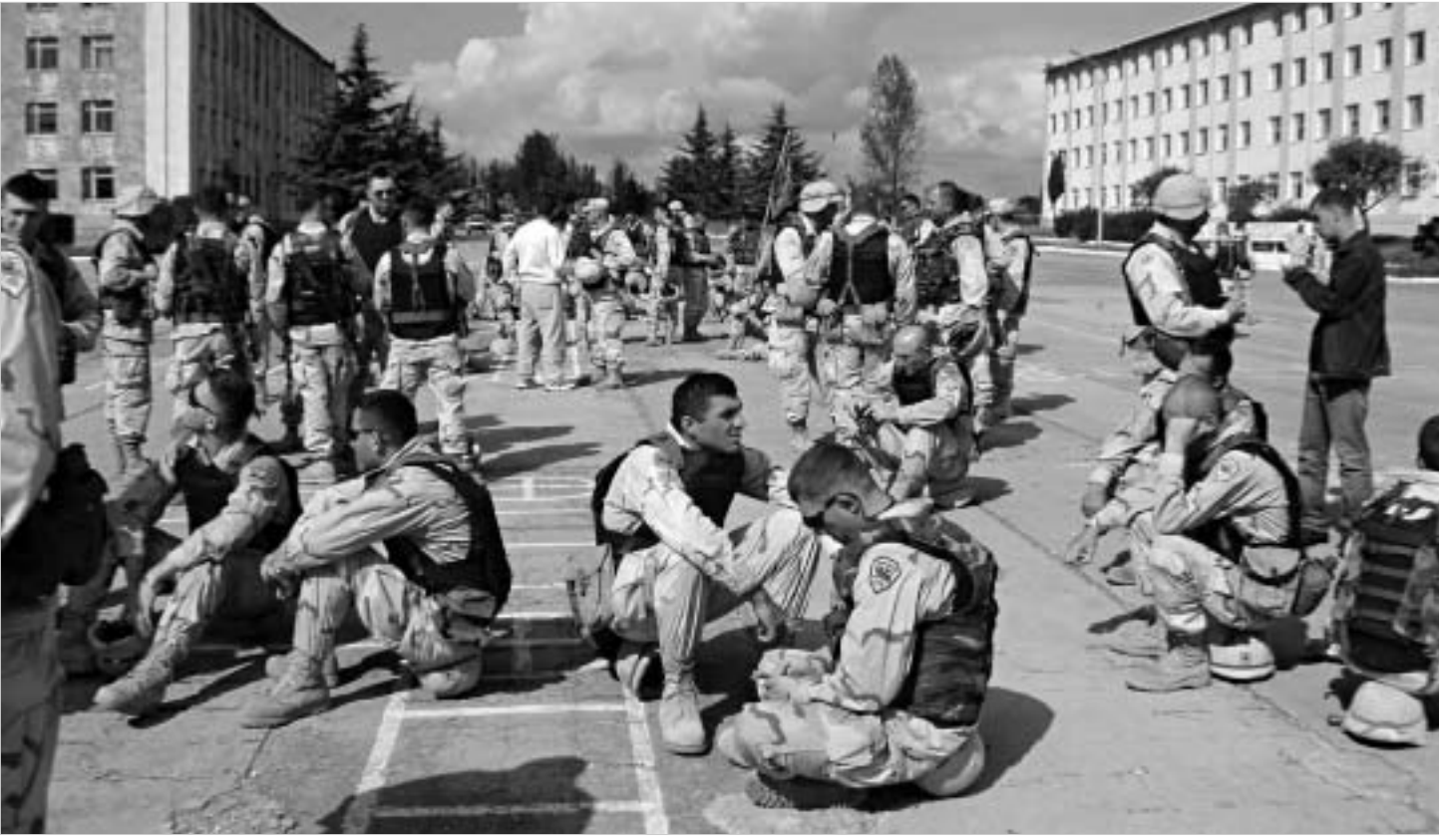
დანაყოფი საქართველოში სრული შემადგენლობით დაბრუნდა.

ვაზიანის სამხედრო ბაზაზე, გუშინ, ერაყში მოქმედი პირველი ქვეითი ბრიგადის - შავნაბადს ბატალიონის დაბრუნება საზეიმოდ აღინიშნა.