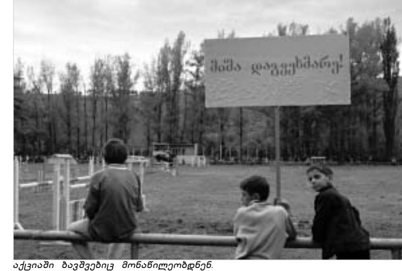
აქციაში ზამთრებზე მონაწილეობდნენ.

დღეს აქციის მონაწილეები იგეგმი მთხოვნით მერიის შენობასთან შეკრებას გეგმავს.