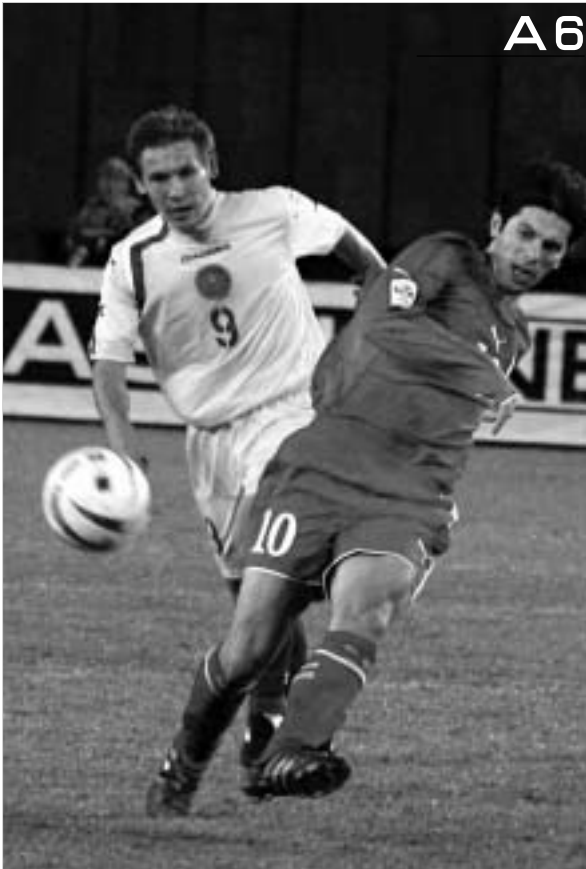
საქართველოს ნაკრებმა კიდევ ერთი უსახური თამაში ითამაშა.