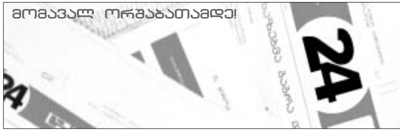
ომბუდსმენს შეგიძლიათ დუკავშირდეთ მახათობით ტელ: 20 24 24 ან ნებისმიერ დროს ელ-ფოსტით: nledaria@24hours.ge

არ გვევლინება, ჩემს პირად პობლემებს გახვედით თავზე — უბრალოდ, ვარბუნი სინამდვილეში ისე ვართ ჩართულნი და თვით სინამდვილეც იმდენად შემტყიდრობდა...