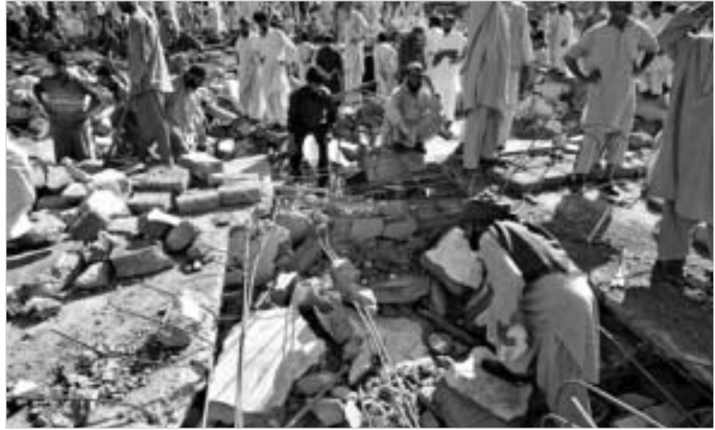
7,6 ბალიანი მიწისძვრის შედეგი.

ფარუქს თქმით, ამ რეგიონის ზოგიერთი ქალაქი და დასახლებული პუნქტი მთლიანად განადგურდა. მასშტაბური წვრილი ალიანის ქაშმირის პაკისტანური ნაწილის დედაქალაქ მუზაფარაბადში, რომელიც ქალაქ ბაჯინში, რომელიც მუზაფარაბადიდან სამხრეთ-