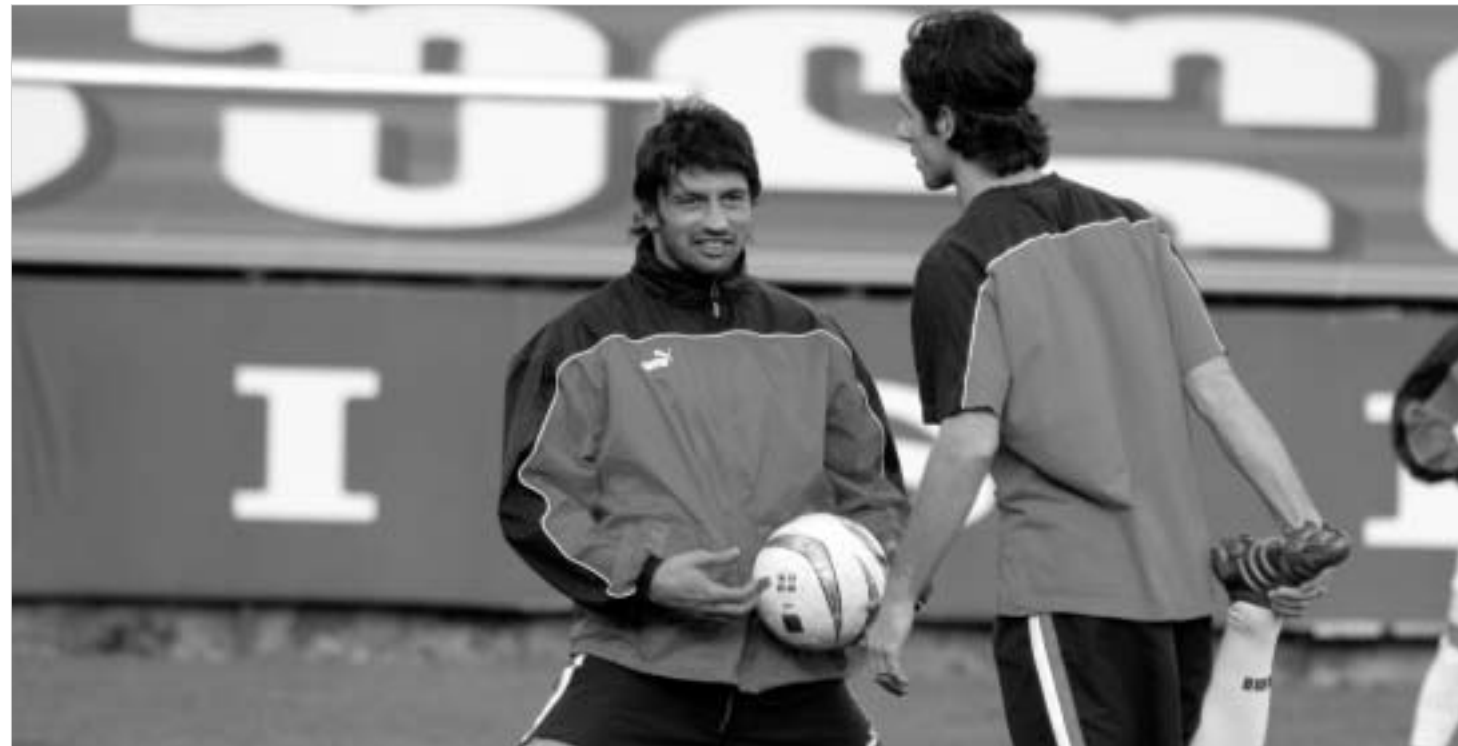
საქართველოს ნაქრების ლიდერები: კალაძე და კობიაშვილი.