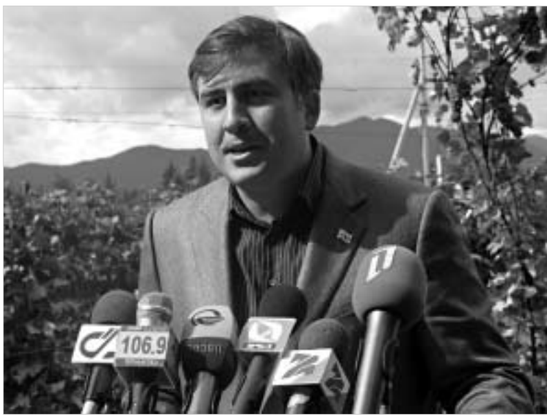
ვენახების დონზე. პრეზიდენტმა ვაზის ჩაყრისკენ მოუწოდა კახელებს.

ამ ყველაფერს კი მიხედავს სააკაშვილი "აგრესიულ" საგარეო პოლიტიკას მიანერს. მისი თქმით, ამ დროისთვის საქართველომ უკვე შეძლო გაემყარებინა ქართული ლევიის ბაზარი უკრაინაში და ყაზახეთში, გაუმჯობესება შეიმჩნევა რუსეთის ბაზარზე. ამ დროისთვის კი ინტენსიურად მიმდინარეობს მოლაპარაკებები თურქეთის რესპუბლიკის ბაზრების დასაპყრობად. "ეს იმას ნიშნავს, რომ ჩვენ უკვე როგორც მეტ ყურადღებას ვთმობთ, ვიდრე საქართველოს დემოკრატიული ქვეყნის მშენებლობის დროს," აღნიშნავს პრეზიდენტი. სწორედ ამის გამო იგი კახელებს, ვენახის გაჩეხვის ნაცვლად, გაშენებისკენ მოუწოდებს და მათ ასეთ დახმარებას პირდება: "შე მინდა ვუთხრა კახელებს, გაეაქრონ ისეთი ყურძნის ჯიშები, რომლის მიერ ნაწარმოებ ღვინოს მსოფლიო ბაზარზე ექნება გასავალი. მე თქვენ დაგეგმავთ იმას, რომ ერთად ვამუშაოთ ტექნოლოგიები და ბოლო მოელოს საღებავებით და ნვენებით დამზადებულ ღვინოებს." დაიპყრობს თუ არა საქართველო ლატვიის ლევიის ბაზარს, ამის პროგნოზირება ჯერ ძნელია, რადგან ვიარა ვიკე-ფრაიბერგამ პირველად ნახა, თუ როგორ იხრებოდა მამაპაპურ სანაწარმე ნამდ-