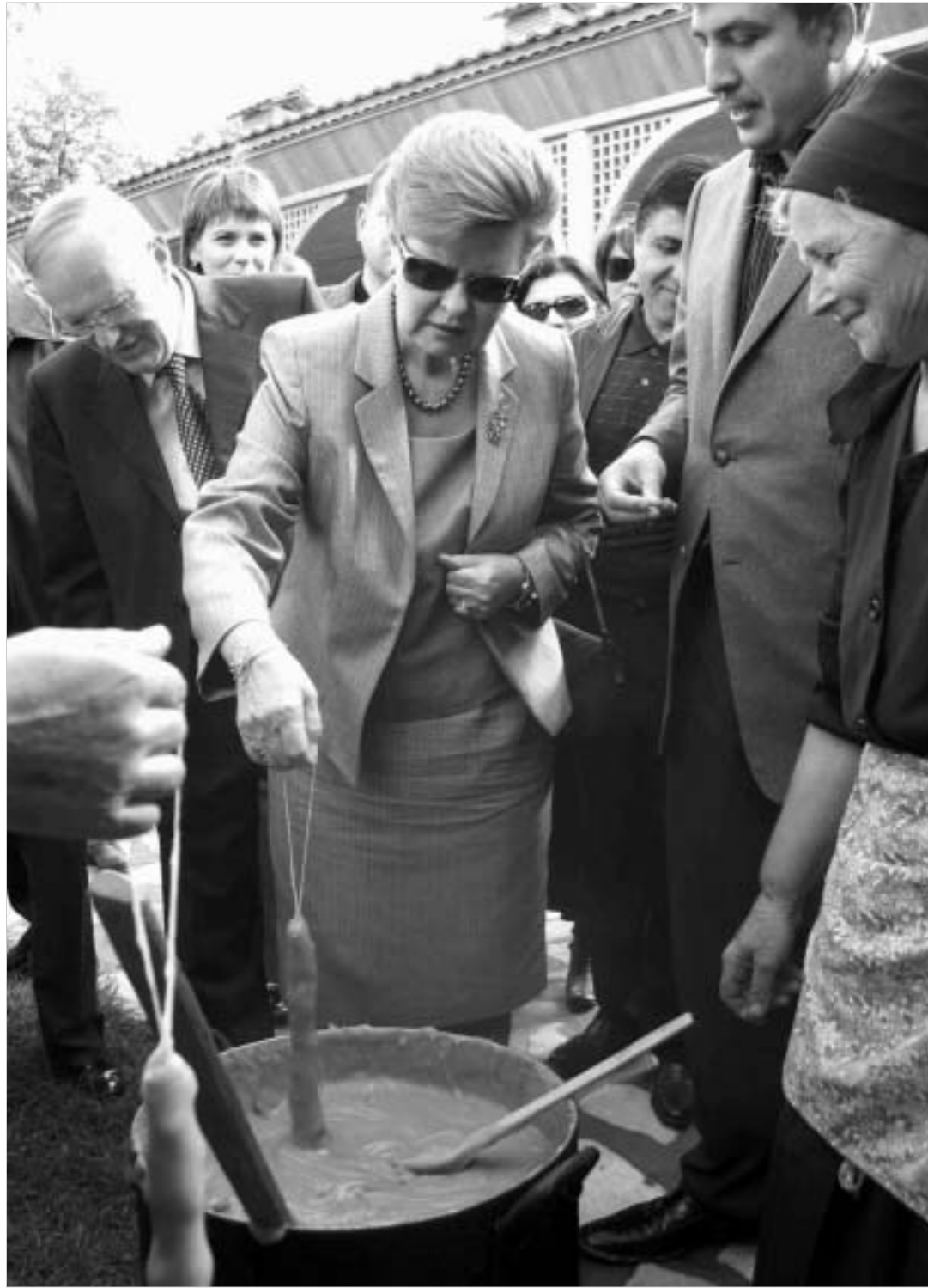
ლატვიის პრეზიდენტმა და მისმა მეუღლემ დიდი ხალხით ამოავლეს ჩურჩხელები.