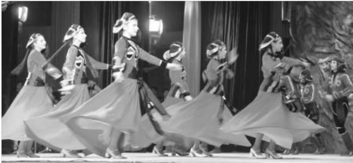
"ჩვენებურების" საფინალო კონცერტი.

ფესტივალი "ჩვენებურები" ერთი წლით დაგვიმზივდება