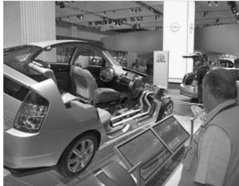
მეტი თვალსაჩინოებისთვის ტრიოტამ ასეთი ექსპონატებიც წარმოაჩინა