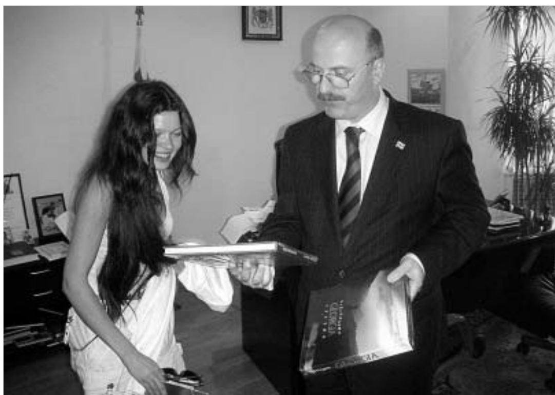
რუსლანა არაერთხელ შეხვდა საქართველოს სრულფასოვან ელჩს უკრაინაში გრიგოლ ქათამაძეს.

ამ მიზნით რუსლანა არაერთხელ შეხვდა საქართველოს სრულფასოვან ელჩს უკრაინაში გრიგოლ ქათამაძეს და მიზნის განხორციელებისთვის საჭირო თანადგომას სთხოვა. როგორც ცნობილია, მომღერალი საქართველოს მთიანი რეგიონების ფოლკლორზე გააკეთებს აქცენტს. გრიგოლ ქათამაძემ უკვე გამოთქვა რუსლანას დახმარების სურვილი, რადგან ამ პროექტით ქართული ხალხური შემოქმედების პოპულარიზაციაც მოხდება. პროექტის წარმატებით განხორციელებით დინამიკურად საქართველოს პრეზიდენტი მიხეილ სააკაშვილიც, რომელიც ნებისმიერი სახ-