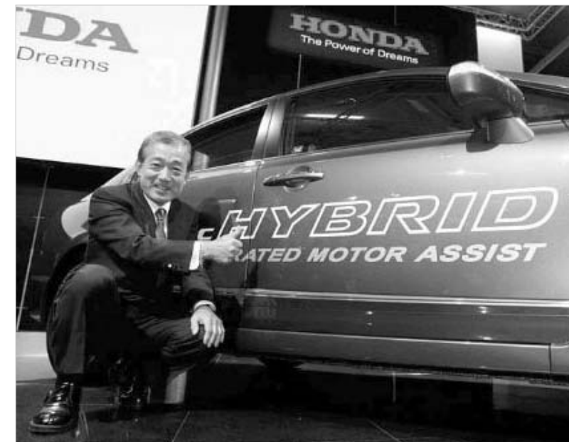
ჰონდის აღმასრულებელი ტაკეო ფუკუი პირიველ ავტომობილს უკეთეს რეკლამას