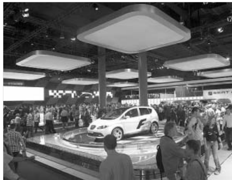
სეატის მთავარი სიახლე სპორტული ალტა FR იყო