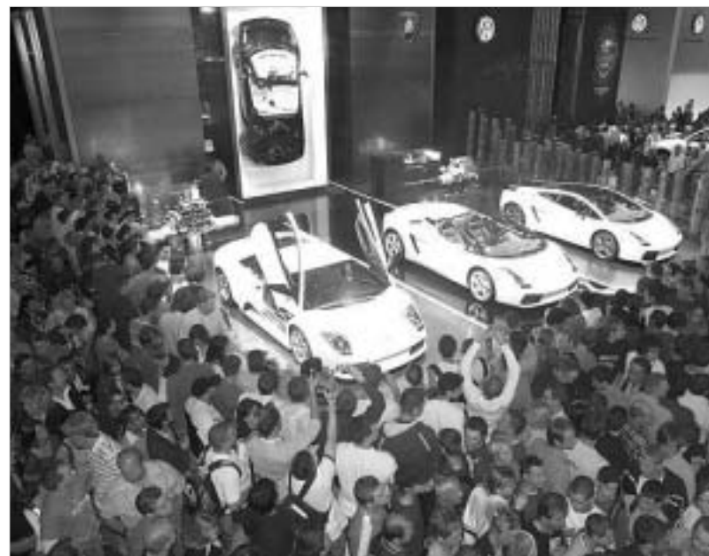
ლანბორგინის სტენდთან ყველაზე მეტი ხალხი იყრიდა თავს.

ასეთი, ხისტი და დასაკეცი სახურავიანი კაბრიოლეტების ხილვა დამთავლიერებელს "ფოლკსვაგენის", "ნიანისა" და "ვოლვოს" სტენდებზე შეელო. ეგ კი არა, ახლა ასეთ სახურავებს უკვე ექსკლუზიური ავტომობილების მწარმოებლებიც კი იყენებენ. მაგალითად, "ლამბორგინი", "პორშე", "ბემვემ" და "ბენტლი". "ლამბორგინი" თავისი კუპე "გალიარდო" სპაიდერად აქცია, "ბენტლიმ" კი იგივე ოპერაცია ჩაუტარა თავის "კონტინენტალს".