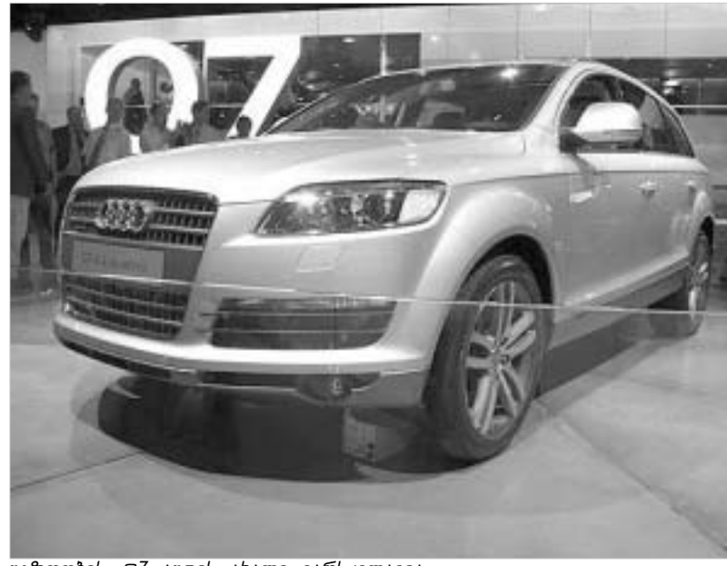
უგზობის Q7 აუდის ახალი ვარსკვლავია