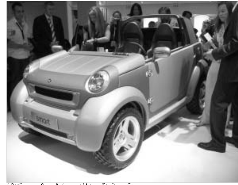
სმარტი უგზობის კლასსაც წაუპოვინა.