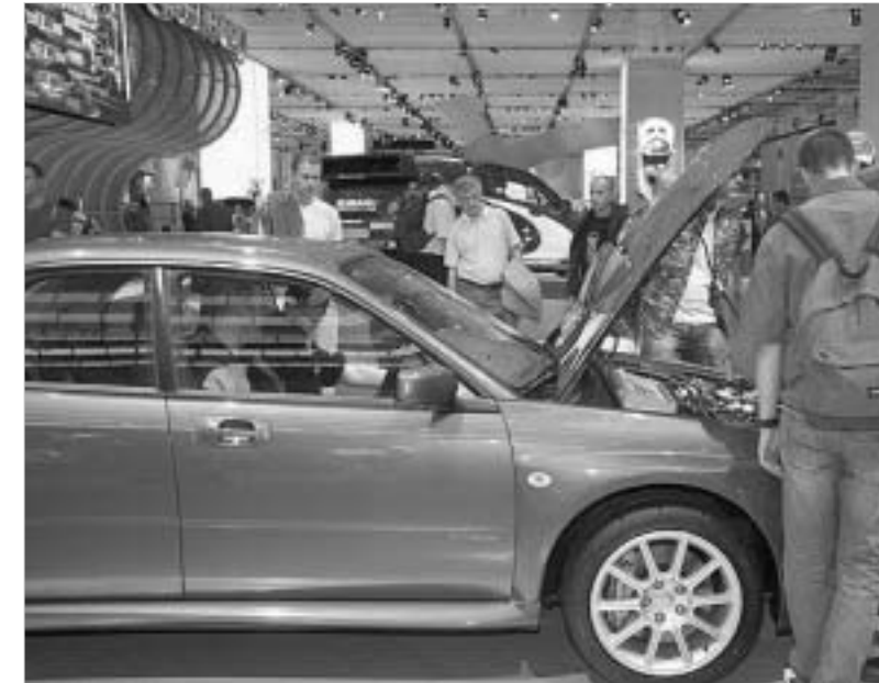
სუბარუ დამთავლიერებელს კაპიტევე ჩახვედის უფლებას აძლევდა