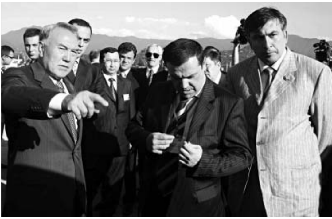
ნაზარბაევი ბათუმის ცენტრალური პარკისა და გონიოს ციხის დათვალეობაზე მოასწრო.