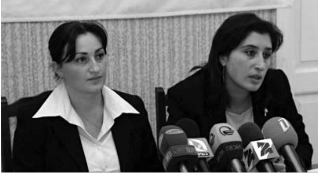
"სამართლიანი არჩევნები" ყველაზე დიდ დარღვევად საარჩევნო სიების უზუსტობას მიიჩნევს.