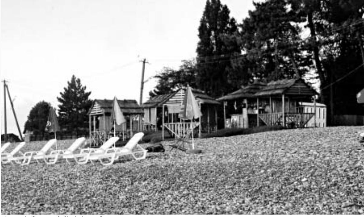
ახალი ბუნგალო ჩემს სახლთან.