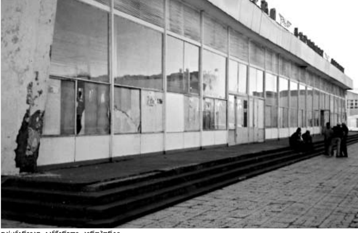
დასანგრევედ განწირული აეროპორტი.

ათობით ახალი დიდი თუ პატარა, მაზებენ, უფრო კომფორტულს უშნო თუ ლამაზი სახლების მშენებლობა დასრულებულია. ალბათ, თავი დროზე კანიც ასე შენდებოდა, შენდებდა რამდენიმე ახალი სასტუმრო, საცხოვრებელი უზარმაზარი სახლი, სადაც ბინები გაიყიდება. არც ჰყავს), ან ოქრუაშვილს ან ჯემალ ინიანიშვილს ასახელებენ.