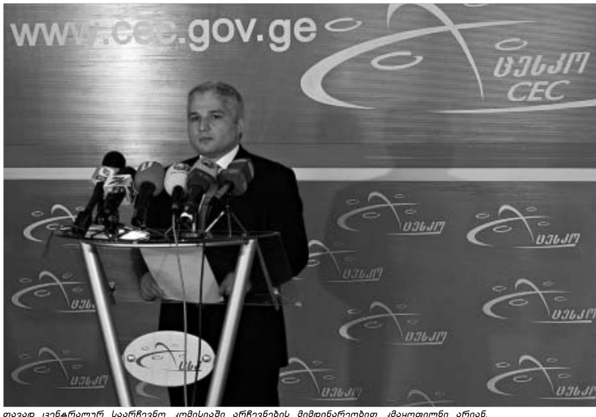
თავად ცენტრალურ საარჩევნო კომისიაში არჩევნების მიმდინარეობით კმაყოფილი არიან.