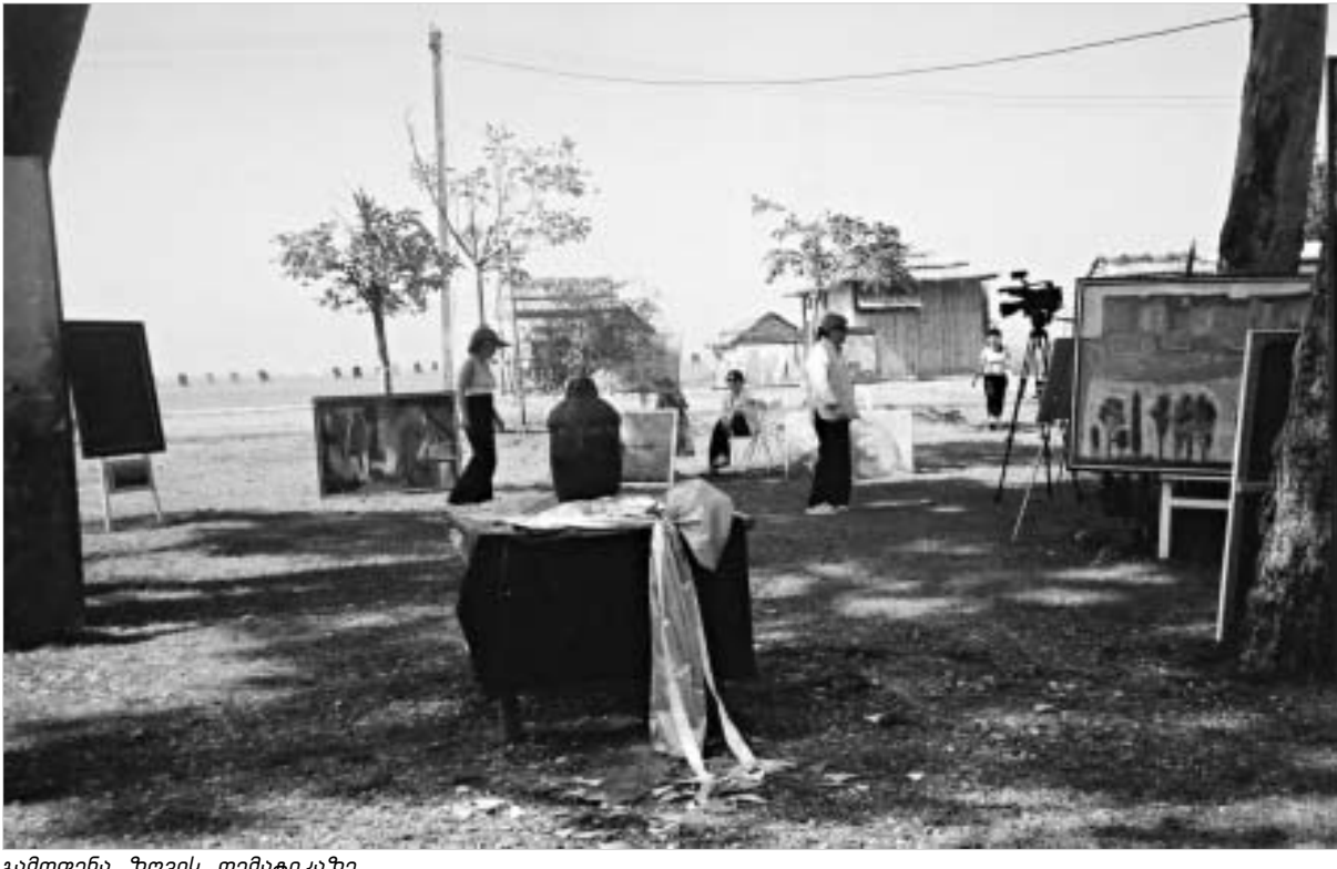
გამოფენა ზღვის თემატიკაზე.