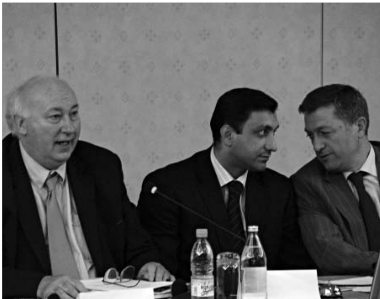
კერძო დეტექტიური და დაცვითი საქმიანობის კანონმდებლობის მიღებით მრავალი პოზიტიური შედეგი მიიღწევა.

ვეროკომისიის გაკლენით, თუ სხვა ფაქტორის გამო, დღევანდელმა ხელისუფლებამ დაცვის კერძო ინდუსტრიის განვითარების ხელშეწყობის ნება გამოიქვია. საკანონმდებლო ბაზის შესაშუაანებად გადაიდგა კონკრეტული ნაბიჯები. პირველ ეტაპზე, ასოციაციაში კერძო დაცვისა და დეტექტიური საქმიანობის თაობაზე შემუშავდა კონცეფცია, რომლის საფარო განხილვა პარლამენტში შედგა. შემდგომ ეტაპი იყო ის, რომ იურიდიული კომიტეტის თაოსნობით შეიქმნა მუშა ჯგუფი, რომელმაც კონკრეტული საკანონმდებლო ნინადამატების შემუშავება დაიწყო. ორი დღის წინ გამართული კონფერენციაც, მი-