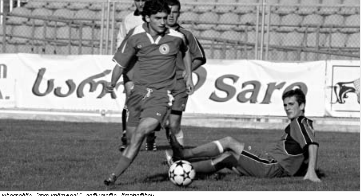
ქალებმა 'ლოკომოტივს' ვერაფერი მოხერხეს.

არ უნდა დავივიწყოთ ბოლნისელი გულშემატკვარელიც, რომელსაც დიდი წვლილი შეაქვს საყვარელი გუნდის წარმატებებში როგორც საშინაო, ისე გარეული მატჩებშიც. თუმცა, მართო ქო-