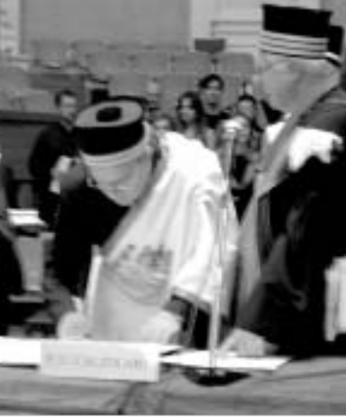
კომენტარი სურათი N2-თვის: ბოლონის უნივერსიტეტის რექტორი პროფ. კალზოლარი და თბილისის სახელმწიფო სამედიცინო უნივერსიტეტის რექტორი პროფ. ალთეია უნივერსიტეტთა დიდ ქარტიან ხელისმომწერის ცერემონიაზე

რინგის ფუნქციაც გააჩნია. შემთხვევითი არ იყო ის ფაქტი, რომ დიდი ქარტიის ხელმოწერა და უნივერსიტეტის უნივერსიტეტთა უკვე შეასრულა - ბოლონაში გაიგზავნა უნივერსიტეტთა დიდი ქარტიის ქართული ვერსია, რომელიც ღირსეულად ადგის დაიკავებს უნივერსიტეტთა საერთაშორისო თანამეგობრობის მრავალმხიანობაში.