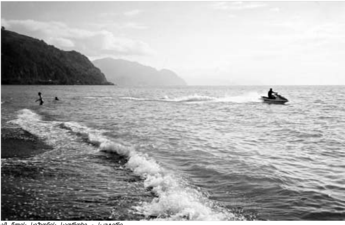
ამ წლის სეზონის საფრთხე - სკატერი.