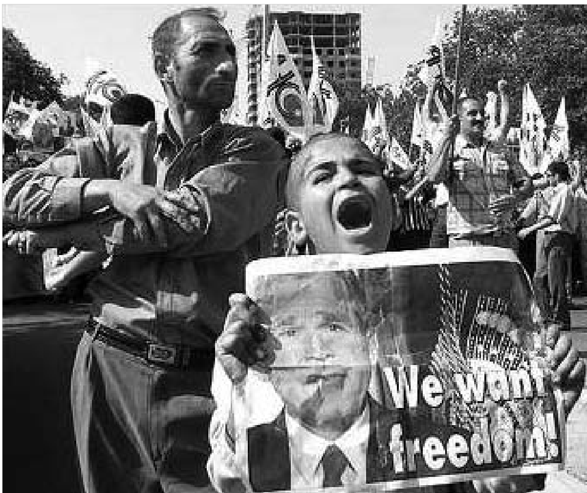
საპროტესტო გამოსვლები ბაქოს ცენტრში.

ბოლოდროინდელი "ხავერდოვანი რევოლუციების" ანალიზიც ცხადყოფს, რომ ყველა პოსტსაბჭოთა ქვეყანა, სადაც არჩევნები