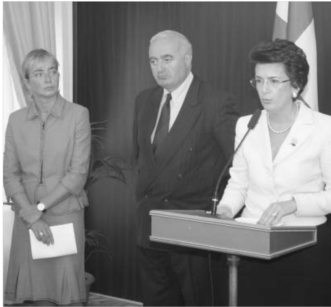
საქართველოს პარლამენტმა დადგენილება ცხივალური ბრიფინგი მიუძღვნა.