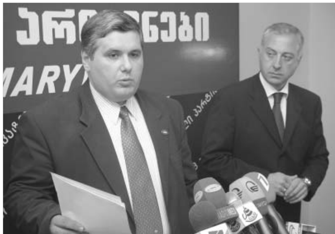
ოპოზიცია ბოლო დარტყმების განხორციელებას ცდილობს.