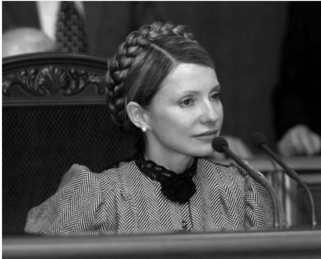
რუსეთი ტიმოშენკოს დაპატიმრებით აღარ ეშუქება.