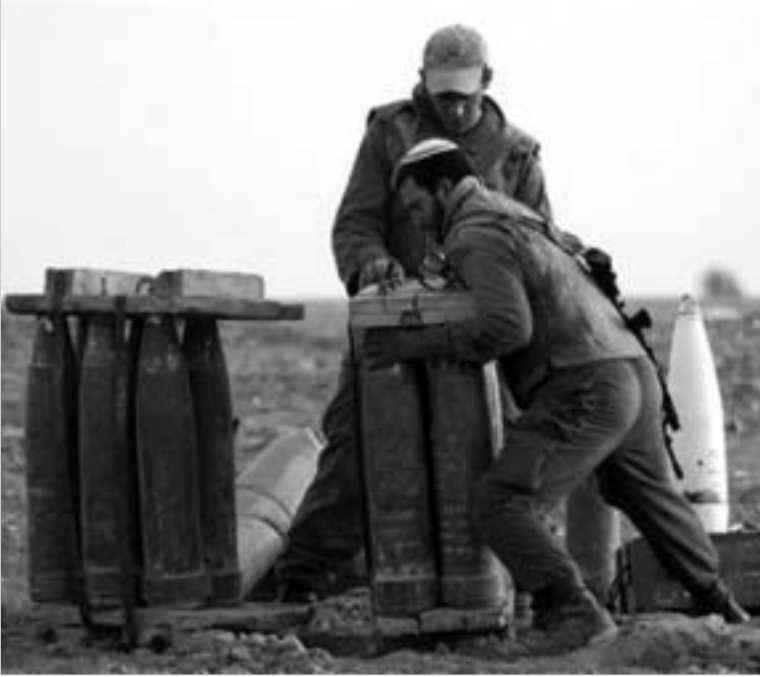
ისრაელის მხრიდან მრავალჯერადი საპაერო იერიში კვლავ განხორციელდა.

ლაზას სექტორიდან ებრაელი მენაშენებისა და ჯარისკაცების გაყვანით პრობლემა არ გვარდება