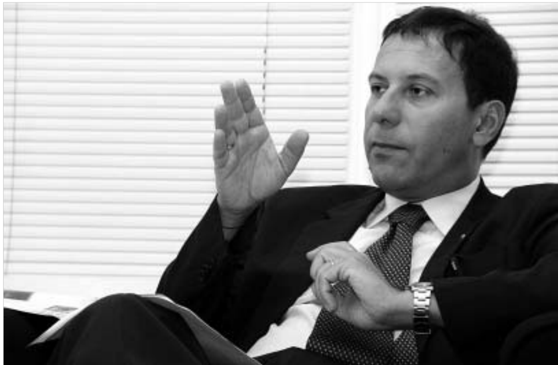
ფაბრიკი რომანოს იმედი აქვს, რომ იტალიელი ინვესტორების წინადადებას საქართველოს მთავრობა მხარს დაუჭერს.