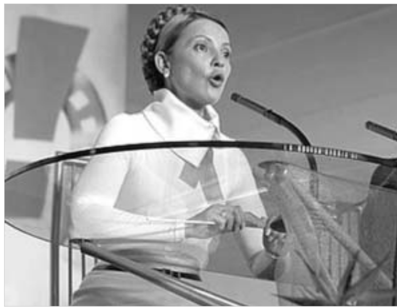
ძნელი სათქმელია, მართლა გაურცხვდა თუ არა ტიმოშენკო ძველ მონაწილედგებას.

საგულისხმოა, რომ დღემდე იულია ტიმოშენკოს ვიზიტი მოსკოვში მკაცრად გასაიდუმლებული იყო და ყოფილი პრემიერის პრესსამსახურის ხელმძღვანელმა ამის შესახებ მხოლოდ სამშობლოში დაბრუნების შემდეგ აღიარა. ვიტალი ჩეჩინოვა მომხდარზე კომენტარებისას სიტყვა-ტყუნი იყო და მხოლოდ ის თქვა, რომ ტიმოშენკო შაბათს მოსკოვს ეწვია და იმავე დღეს უკან დაბრუნდა. რუსული ანალიტიკური სააგენტო "გაზეტარუს" გუშინ ავრცელებდა ვერსიას,