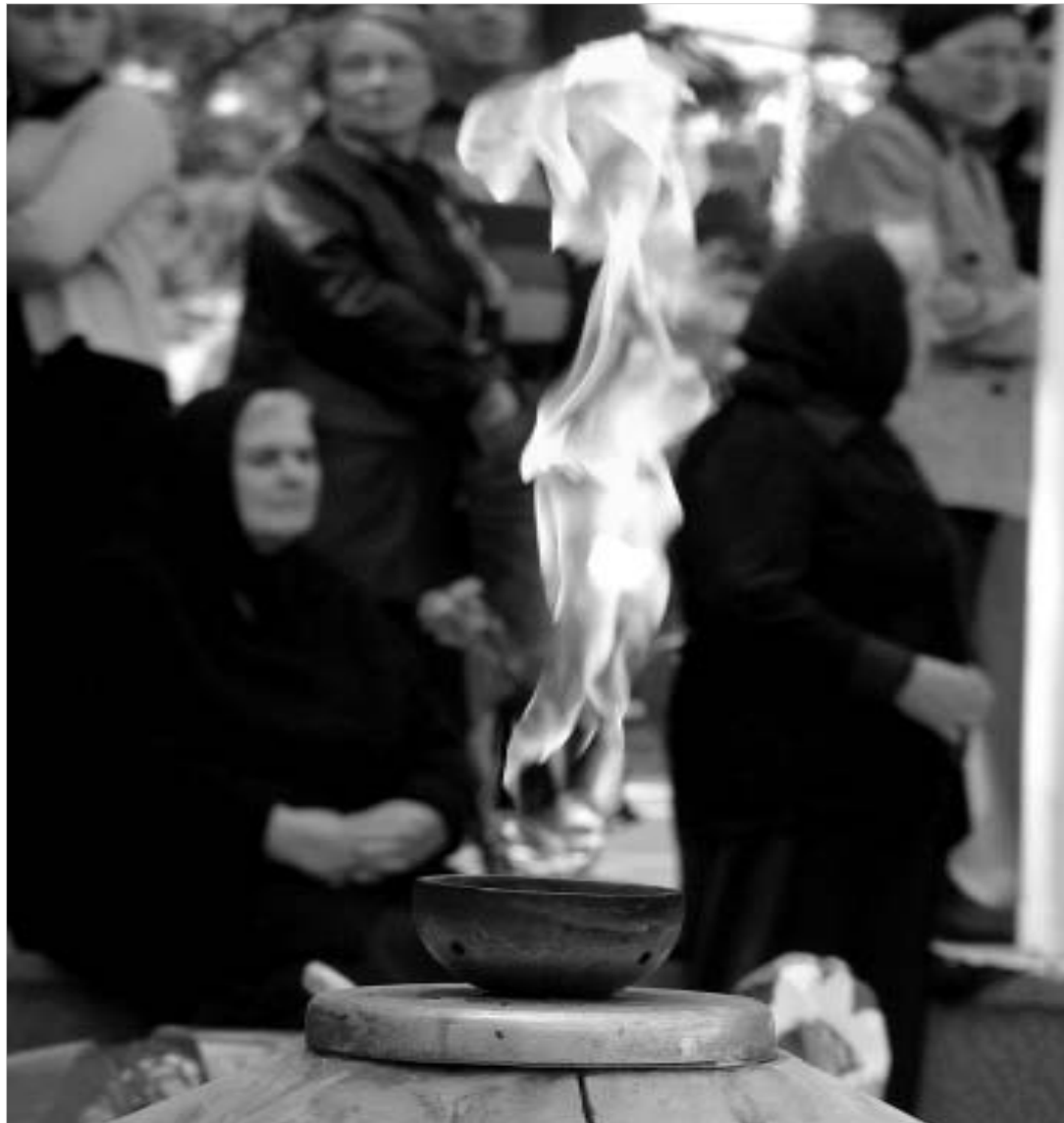
ეს ჩირაღდანი რუხში ჩავა.