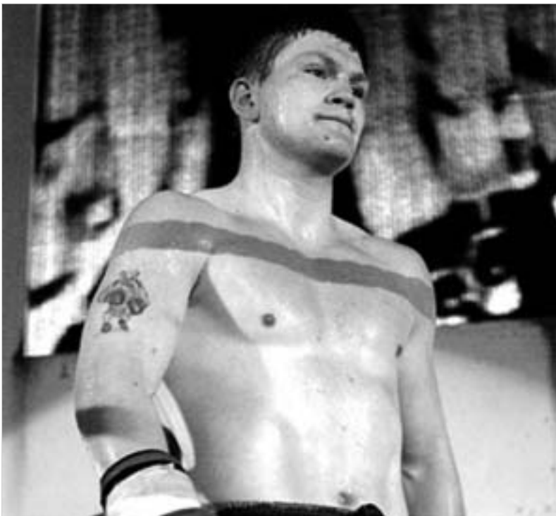
პატონი პრომოუტერთა შორის გაიჩინოა.

პირველი ნახევრად საშუალო წონის ბრიტანელი მოკრივე რიკი პატონი, რომელიც კრივის მსოფლიო ფედერაციის (IBF) საჩემპიონო ქაბრის მფლობელია და ცოტა ხნის წინათ რუსთა კერპს კონსტანტინ ცზიუს ამავე წონის მსოფლიოს უძლიერესი მოკრივის არაოფიციალური წოდება ჩამოართვა, მომდევნო ორთაბრძოლას 26 ნოემბერს შეველდში კოლუმბიულ კარლოს მუსასთან გამართავს. თუმცა, არც ისა გამოირცხლო, პატონის მეტოქე მსოფლიოს აბსოლუტური ჩემპიონი ზაბ ჯულა აღმოჩნდეს. ამ შემთხვევაში საქმე პრომოუტერთა მარიაფაზეა.