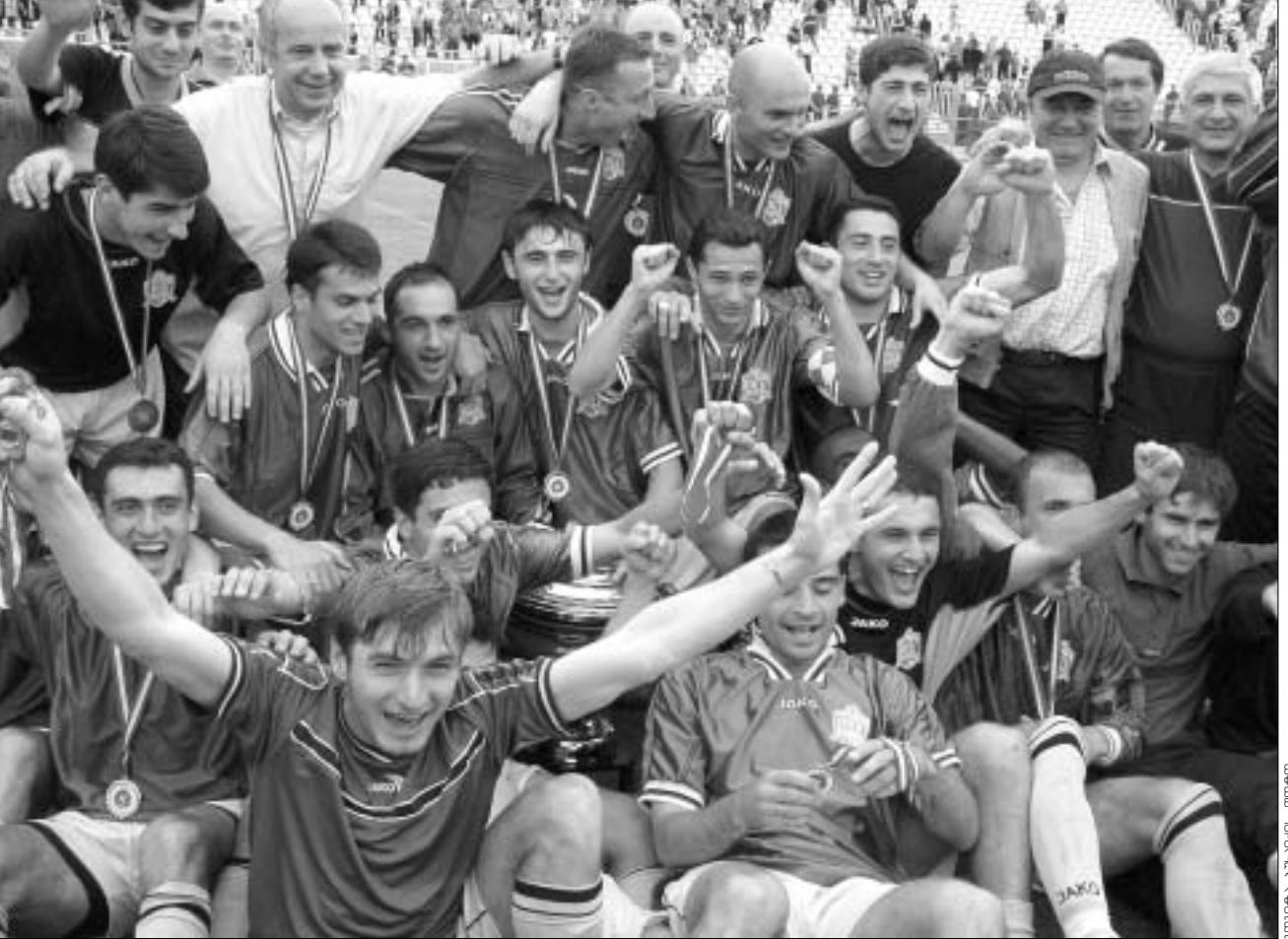
გამარჯვებული "დინამო" ზეიმობს.