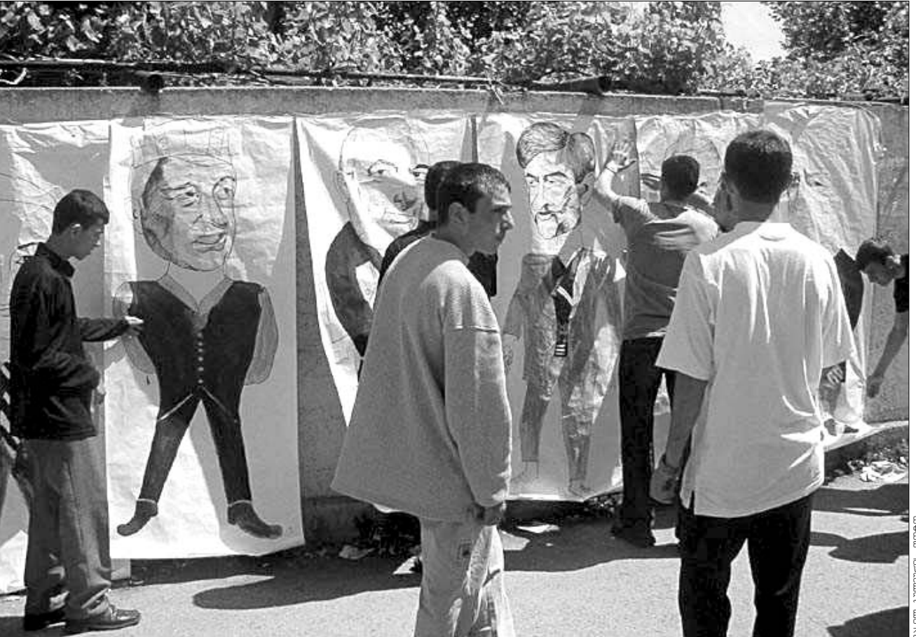
გორში ახალგაზრდებმა შუადღისას ქალაქის ცენტრში ხელისუფლების წევრთა კარიკატურები გამოიწვეს.