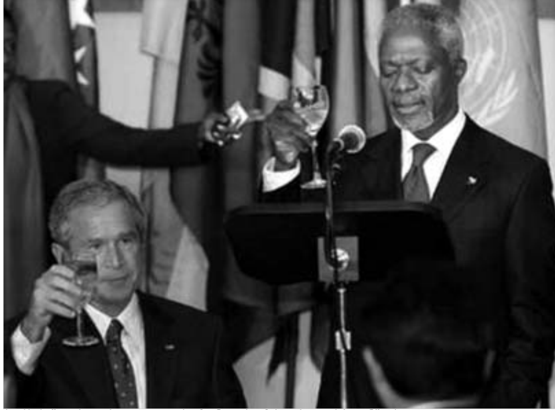
კორჯ ბუმი, როგორც ყოველთვის, მაინც ოპტიმისტურად არის განწყობილი.