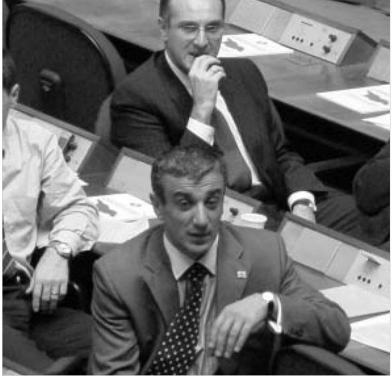
ბეკუარი გადგება. მაჭავარიანი კი "ახლებს" შეუქმნა.

"ოპიზას" საქმიანობის შემსწავლელი კომისიის შექმნის გადაწყვეტილება უკვე მიღებული იყო. მეტიც, უმრავლესობის რიგითმა წევრებმა ისიც იცოდნენ, რომ კობა ბეკუარი პოსტის დატოვების შესახებ განცხადებას გააკეთებდა. სწორედ ამის გამო იყო, რომ უმრავლესობის წევრებს არცევა გაეკვირვებიათ, როცა მათი ლიდერის მოადგილე სხდომაზე ვერ იხილეს.