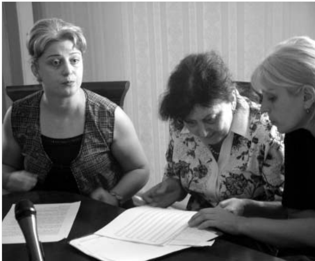
სტადენკურმა ალტერნატივამ მშობლები და აბიტურიენტები შეკრიბა.