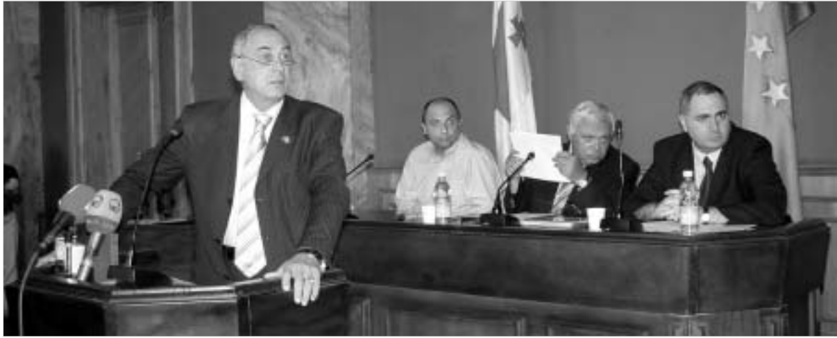
ყურში მიიწვინ ჩამრჩეული...

ფრაქცია "მაჟორიტარის" თავმჯდომარე ფინანსთა სამინისტროს რიგ გადაწყვეტილებებს ეჭვის თვლით უყურებს და ითხოვს