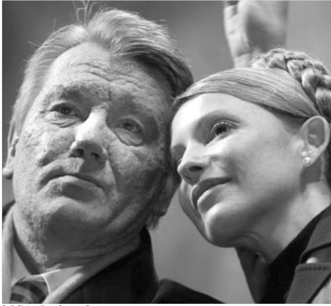
ნარინჯისფერი გუნდი დაიშალა.