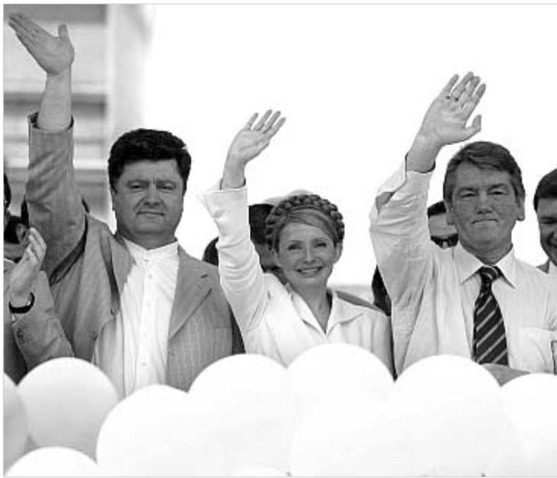
ლეს ვალენსა: შექმნილია დემოკრატიის აშენება და საჭირო რეფორმების გატარება ერთი ნახტომით. არაჩვეულებრივი ადამიანების ერთი ჯგუფი

"პატიოსნების და ღირსების შენარჩუნება ჩემთვის მთავრის ფასეულობაა, უფრო უმაღლა ვიდრე - ნებისმიერი თანამდებობა" ,