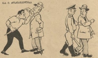
ნის უაბაგი, შინისთავა ათისი ბა-ვიჭრალა... აღწარსილთაოს.