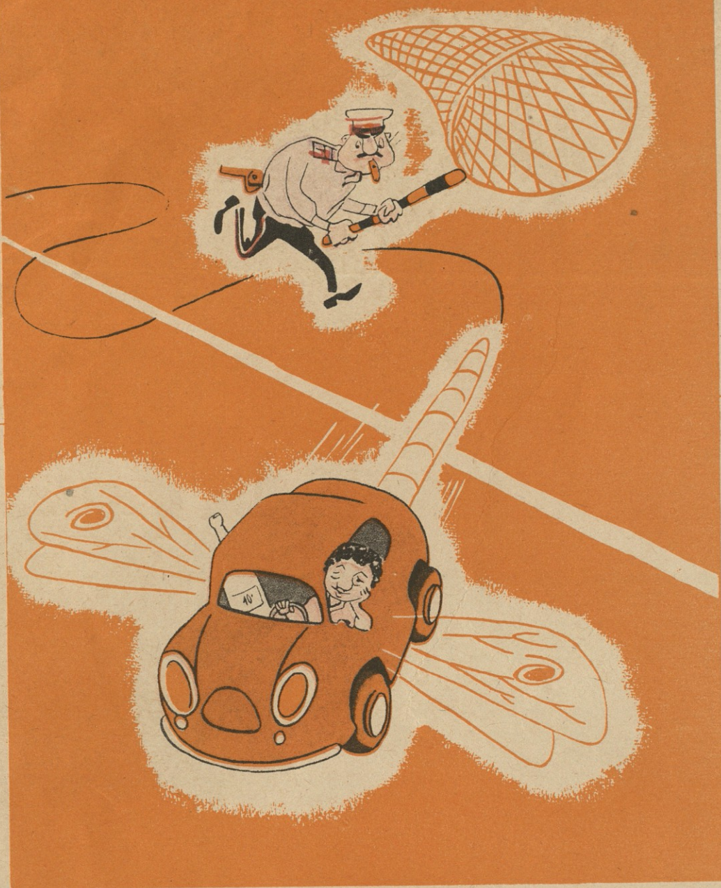
— დამრიჟინება, დახტოდა.