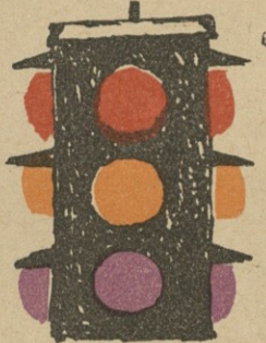
ნ. ლ. ლაშვილი