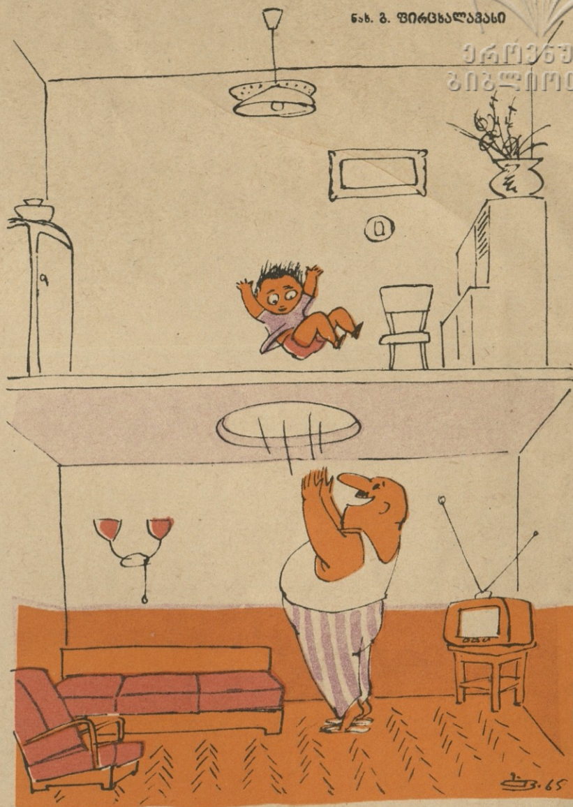
„კოლა“ — დაბალჰინიან ბინაში