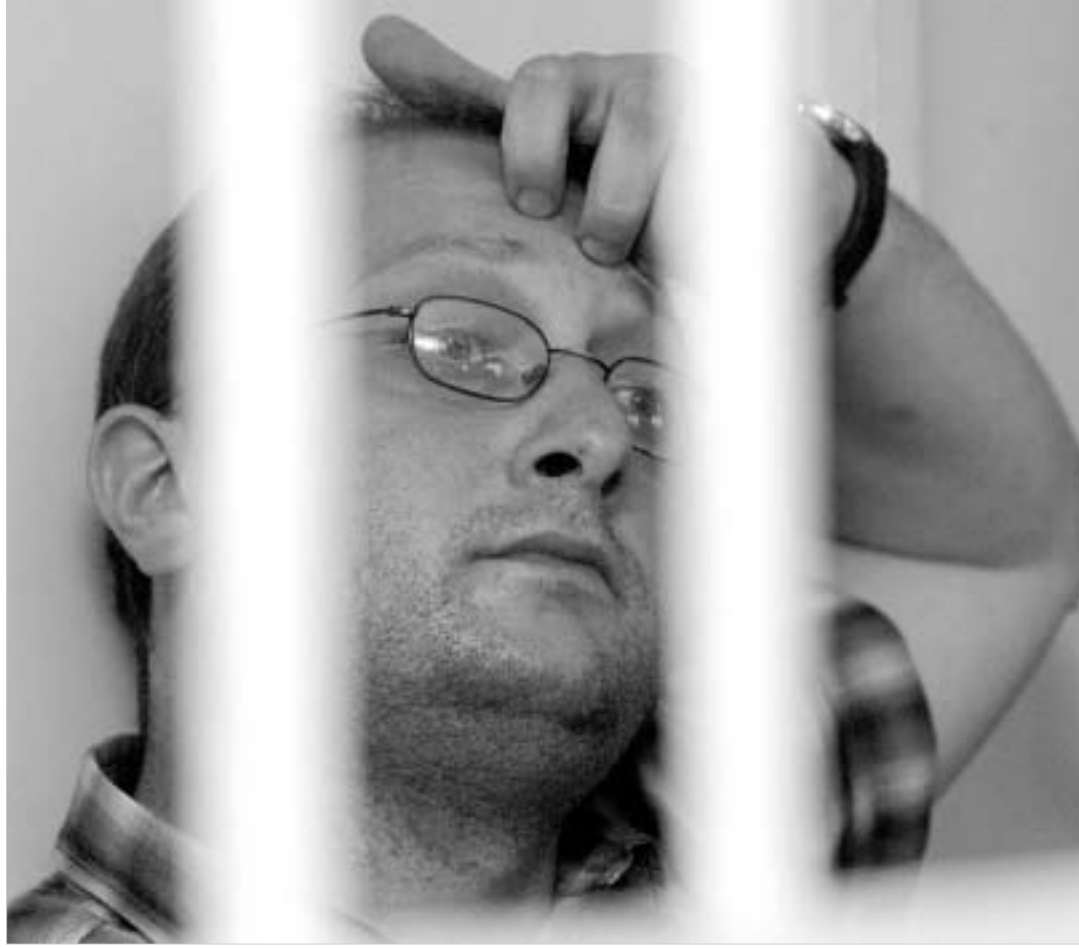
დღევანდელ პროცესზე გამოსვლა ჩემს ცხოვრებაში ყველაზე მნიშვნელოვანი წუთებია.