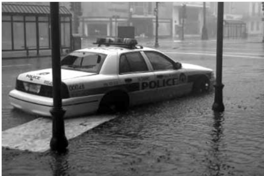
მატრიულურმა ზარალმა ში მილიარდ აშშ დოლარს გადაჭარბა.