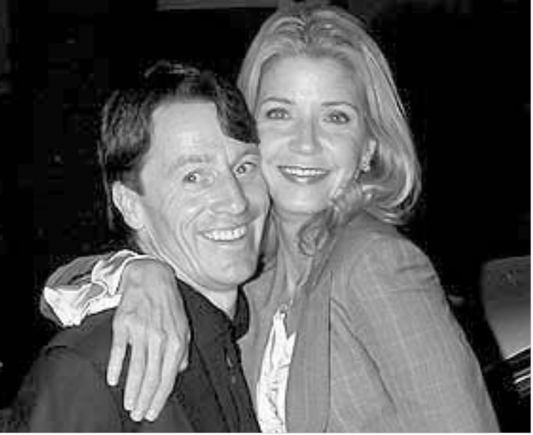
ქენდის ბაშენლი მეგობართან ერთად

ქენდის ბაშენლი ტელესერიალად ქცეული წიგნის "სექსი დიდ ქალაქში" შემდეგ ნიუ იორკის და არა მარტო ნიუ იორკის ისეთივე ვარსკვლავად იქცა, როგორც მისი გმირი - ქერი ბრედშოუ გახლავთ. "სექსი დიდ ქალაქში" დასრულდა, ბაშენლმა კი ახალი წიგნი "პომადების ულანი ტყე" დაწერა და აპირებს, ეს წიგნი უფრო ტელესერიალად წარმოიშდეს, ვიდრე ფილმად, რადგან მისი გმირები ორმოც წელს გადაცილებული ქალები არიან, ამ ასაკის მსახიობების პოვნა კი დღევანდელ პოლემში ცოტა რთულია", - დასძინდა ის. თითონ ბაშენლი 46 წლის არის და შეგახსენებთ, რომ "სექსი დიდ ქალაქში" მან თავიდან საგაზეთო სექტორში დაწერა. ეს 1994 წელს იყო. მას შემდეგ სექსი წიგნად იქცა, მერე კი სუპერპოპულარული ტელესერიალად, რომელიც უამრავი პირიზით დაჯილდოვდა. სერიალი 2004 წელს დასრულდა, მაგრამ დღესაც, განმეორებით, რამდენიმე ამერიკული საკავალე არხი აჩვენებს.