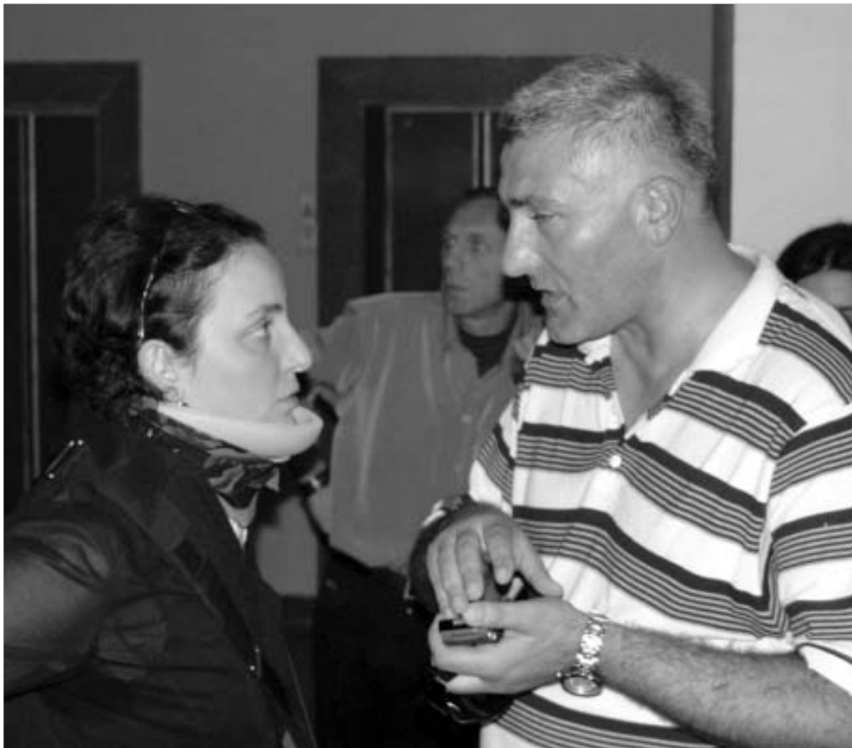
სასამართლო პროცესზე მრავლად იყვნენ საზოგადოებისთვის კარგად ცნობილი ადამიანები.