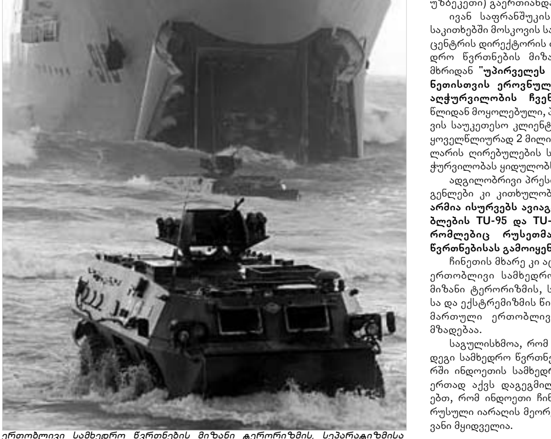
ერთობლივი სამხედრო წვრთნების მიზნად ტერიტორიის. სეპარატისტებისა და ექსტრემიზმის წინააღმდეგ ბრძოლა.

მოკლად საქართველოს პრეზიდენტი პოლონიცის ენკევაა საქართველოს პრეზიდენტი მიხეილ სააკაშვილი 31 აგვისტოს ქალაქ ვლადიკავკაში პოლონიის დე-პორტაციული მოძრაობის "სოლიდ-არობის" დარსების 25 წლისია-ვისადმი მიძღვნილ საზეიმო ცერე-მონიაში მიიღებს მონაწილეობას. "სოლიდარობის" ოფიშელს სა-აკაშვილთან ერთად პოლონიის ყოფილი პრეზიდენტი და მოძრა-ობა "სოლიდარობის" ერთ-ერთი დამარცხებული ლუხ ვალუხვა, ჩე-ხეთის ყოფილი პრეზიდენტი ვაცე-ლაკ შაველი, აშშ-ს ყოფილი სახე-ლმწიფო მდივანი მაღერი ოლბრა-ვისკი, პოლონიის პრეზიდენტი ალექსანდრ კვასნესკი, უკრაინის პრეზიდენტი ვიტორ იუშენკო და სხვები დაესრებიან. "სოლიდარობის" ოფიშელს 28 ქვეყნის დღევანდელი მიწვეუ-ლი ინტერპრესნიუსი