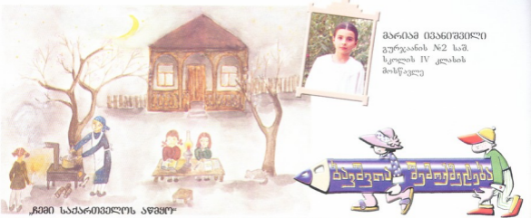
ჩემი საქართველოს აფხური

სპარსელები, მონღოლები, ლეკები და არაბები... საქართველო მაინც იყო ღვთისგან გოლოდნაგები და დუშმანთან ქართველებიც იდგნენ სულთა კლდოვანებით, რადგან ღმერთი მიუძღოდათ, მერე - ბაგრატიონები, რადგან რწმენა მაცხოვრისა ვევლვა ციხედ, ტაძრად, ბურჯად, ამიტომაც ბედის ტრიალს საქართველო გადაურჩა.