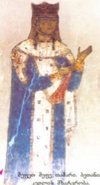
შევერ მეფე თამარი. ბუთანი. კელის მხატვრობა.

მართალია, ქართველ საისტორიო თუ მხატვ- რულ ძეგლებში, ხშირად, თანასწორუფლებიან მეფეებად ჩანან თამარი და მისი მეუღლე — სა- ხელგოვანი სარდალი დავით სოსლანი, მაგრამ არაბულ-სპარსული წყაროები ერთხელაც არ მიუთითებენ თამარის მეუღლის სახელს. გარე სამყარო საქართველოს ხელმწიფედ მხოლოდ და მხოლოდ თამარს იცნობდა.