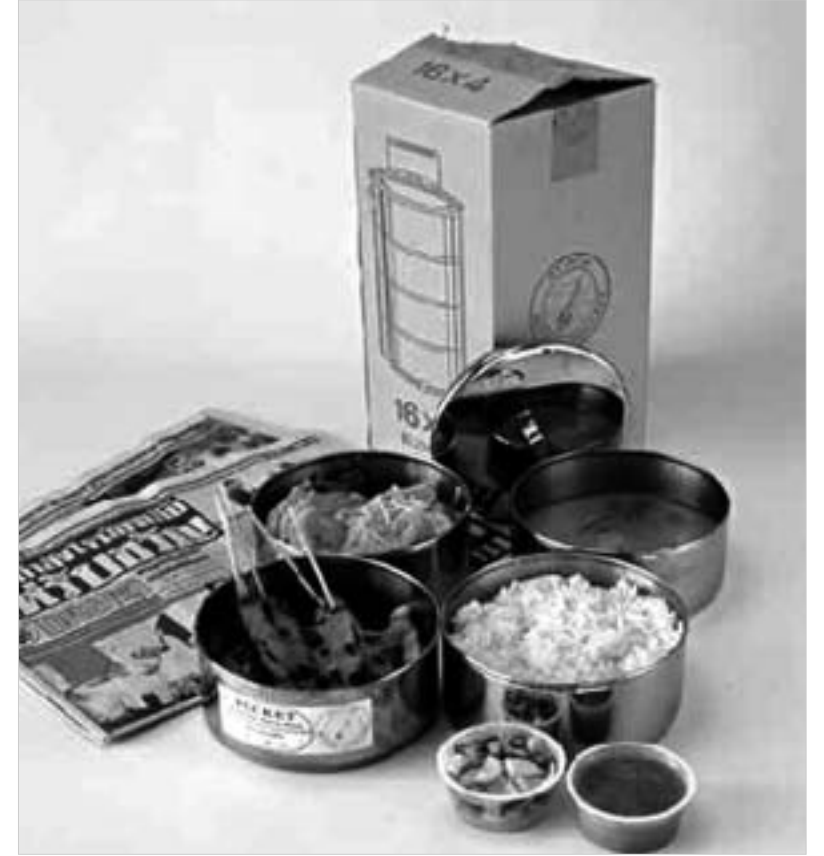
სად გადის ზღვარი ხელოვნებას და საყოფაცხოვრებო რეალობას შორის? რიჩკრიტ ტირავანიას გამოფენიდან.

რიჩკრიტ ტირავანიას - ეს სახელი და გვარი თუ არ გეცნობათ, ეგ არაფერი, ამ ტალიანდელ მხატვარს ახლა გაგაცნობთ. თუმცა, როცა ამბობენ მხატვარს, ხელოვნებათმცოდნეები მამინვე ენაზე იკებენ ხოლმე. ტირავანიას ხომ სიტყვის პირდაპირი და ტრადიციული გაგებით მხატვარი ნამდვილად არ არის. ის უფრო ახალი დროების ხელოვნება, რომელსაც საყოფაცხოვრებო გარემო ხელოვნების რანგში აყვავს. ზუსტად ასეა. და ამ განაცხადის უტყუარობაში მაშინვე რწმუნდებიან სერპანტინის გალერეასთან მოხვედრილი ღონდონელები. გალერეაში შევსება საჭირო არ არის. გრანდიოზული ფანჯრებიდან ისედაც კარგად ჩანს მთელი ექსპოზიცია, რომლის მიზანიც ტირავანიას ნიუიორკული ბინის ინტერიერის ღონდონურ საგამოფენო დარბაზში გადმოტანა იყო. ოთახები ხელოვნება სერპანტინში, ცხადია, იუმორის თანხლებით წარმოადგინა და ყველა