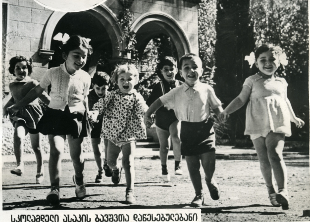
სკოლაგარედი ასაკის ბავშვთა დაწესებულებანი

ხუთნაწიანს მანძილზე ბავშვთა კითხვი სკოლაგარედი ასაკის ბავშვთა დაწესებულებებში 17- ჯან ბიზარება.