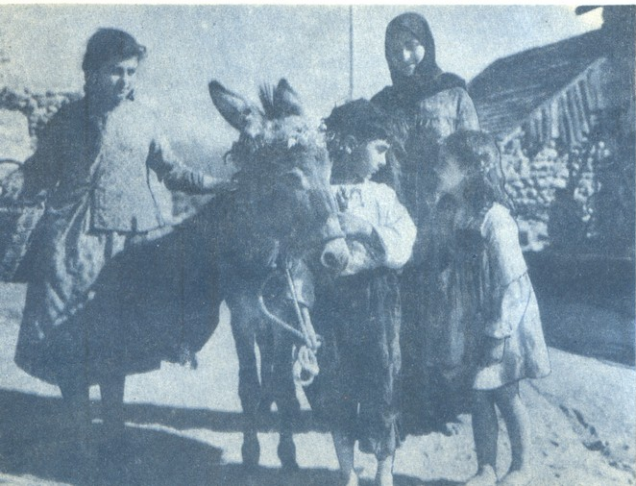
ქალი კინოფილმიდან — „მაგდანას ლურჯა“.