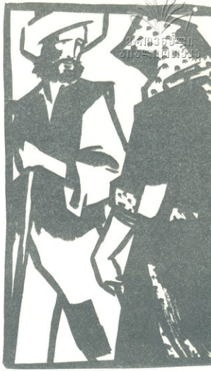
შეუძენია. სამაგიეროდ ექსპირიანი დანა სამრობეთათი შეიძინა და სიკვდილამდე ზედნიერად ცხოვრობდა.

და იციღი, მეგობრებო! ირამ დანაპირი გაამართლა და მის აქეთ ზედნიერად იგრონო თავი. რადგან ცდილობდა საზრდო ეშოენა, საქმეც უკეთ წაუვიდა, თუმცა მარშოვაში ქალაქისთავად არ აურჩევიღი და არც გრამაფონი და არც აეტომანქანა არ