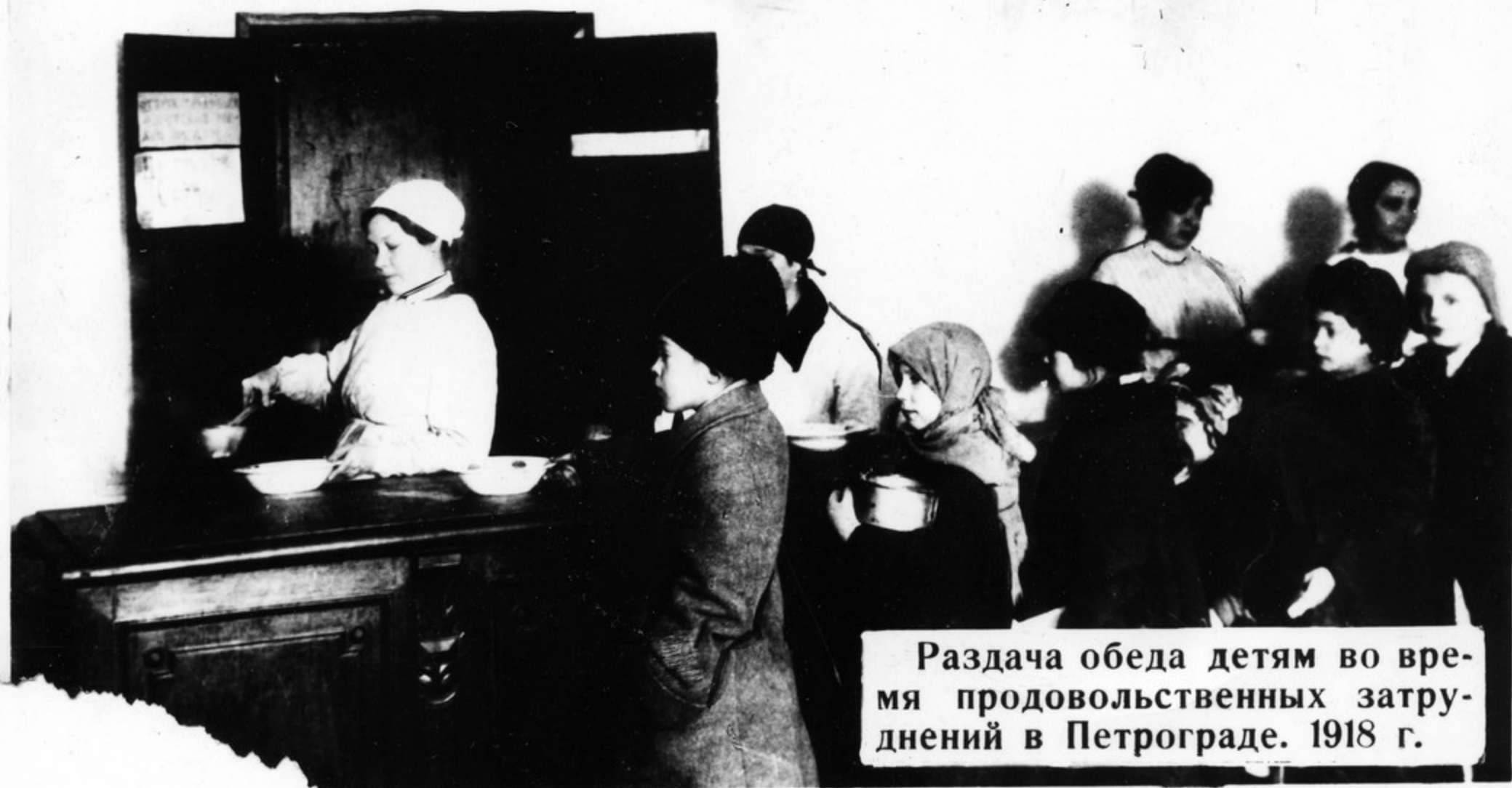
Раздача обеда детям во время продовольственных затруднений в Петрограде. 1918 г.

Первых поколений Октября сражались на войне, боролись с голодом и разрухой, защитили детей, участвовали в строительстве но- вой Родины.