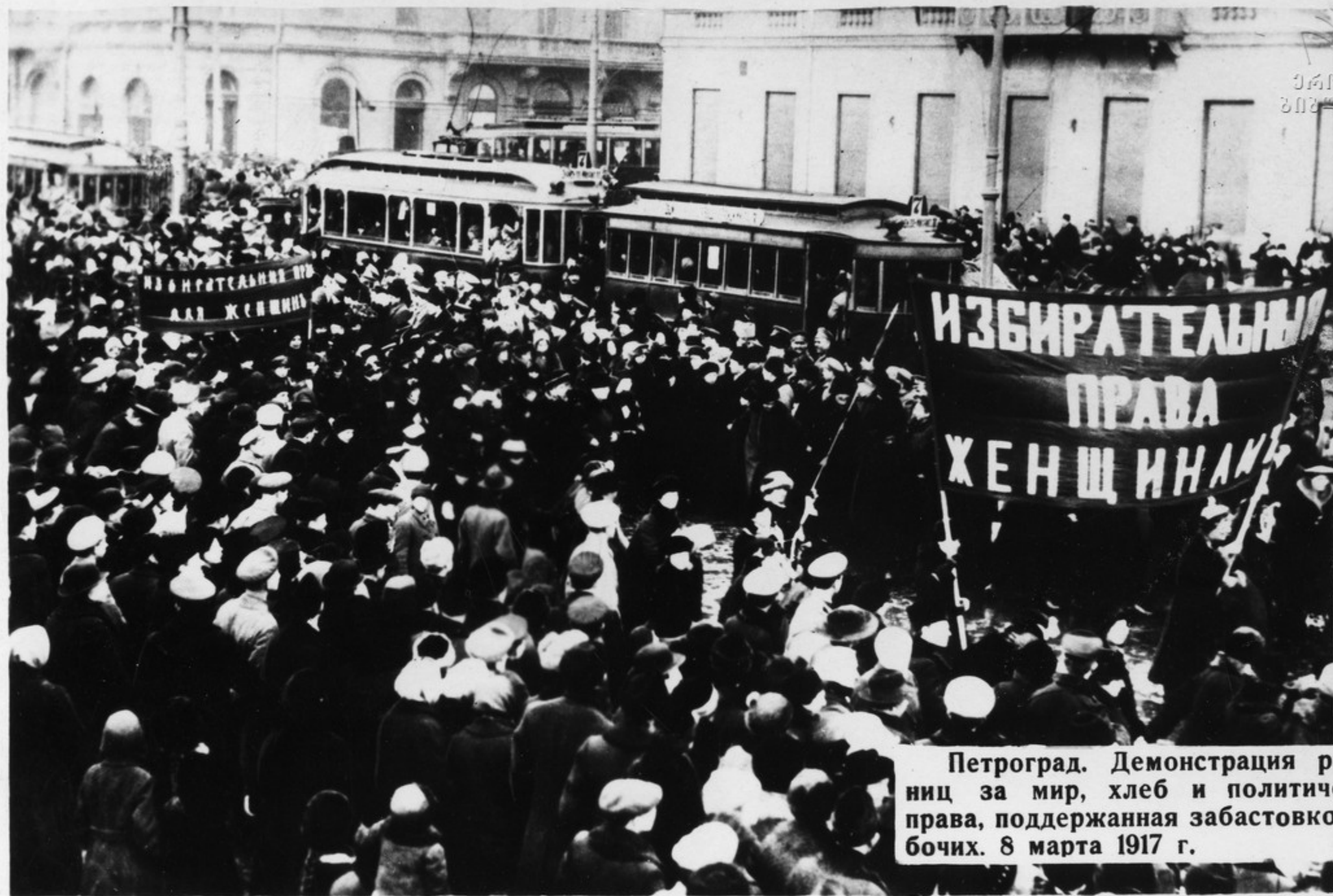
Петроград. Демонстрация работниц за мир, хлеб и политические права, поддержанная забастовкой рабочих. 8 марта 1917 г.

В 1910 году на Второй Международной конференции женщин-социалисток в Копенгагене по предложению выдающейся деятельницы рабочего движения Клары Цеткин было принято решение объявить 8 марта Международным женским днем. Впервые в России он был проведен в 1913 году. В последующие годы день 8 марта отмечался выступлением пролетариата против царского строя.