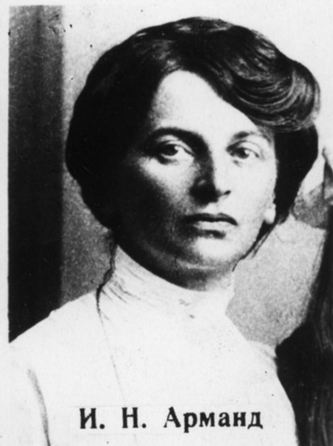
И. Н. Арманд