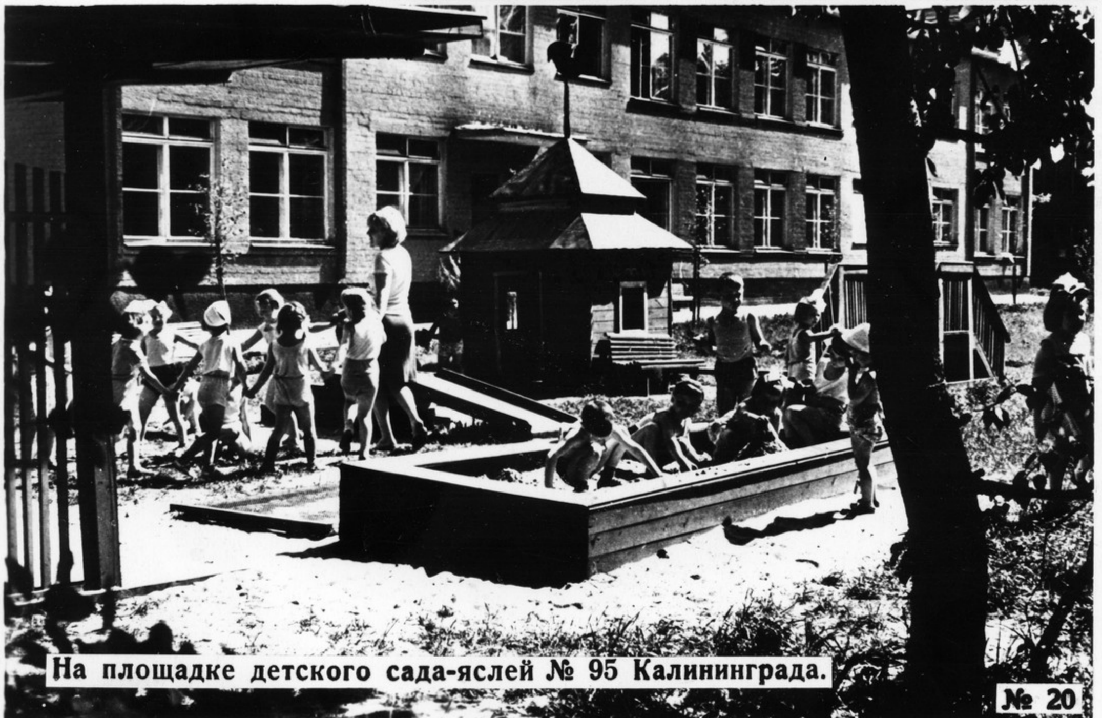
На площадке детского сада-яслей № 95 Калининграда.