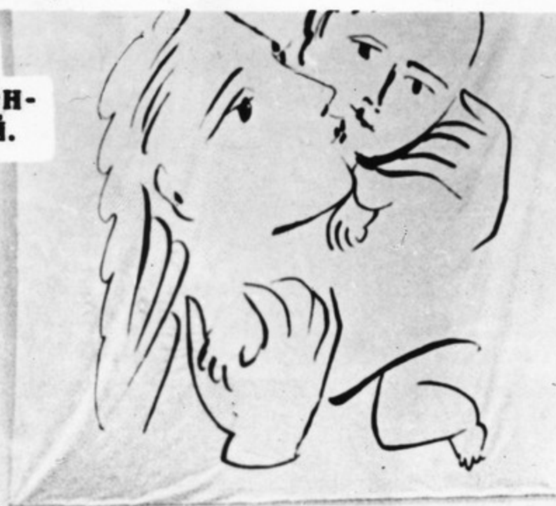
Стокгольм. 1966 г. Всемирная конференция в защиту детей.

Советские женщины принимают деятельное участие во всех важнейших международных встречах, направленных на борьбу за мир и национальную независимость народов, за равноправие женщин и счастье детей. Они активно участвуют в деятельности МДФЖ, представленные Комитетом советских женщин (КСЖ).