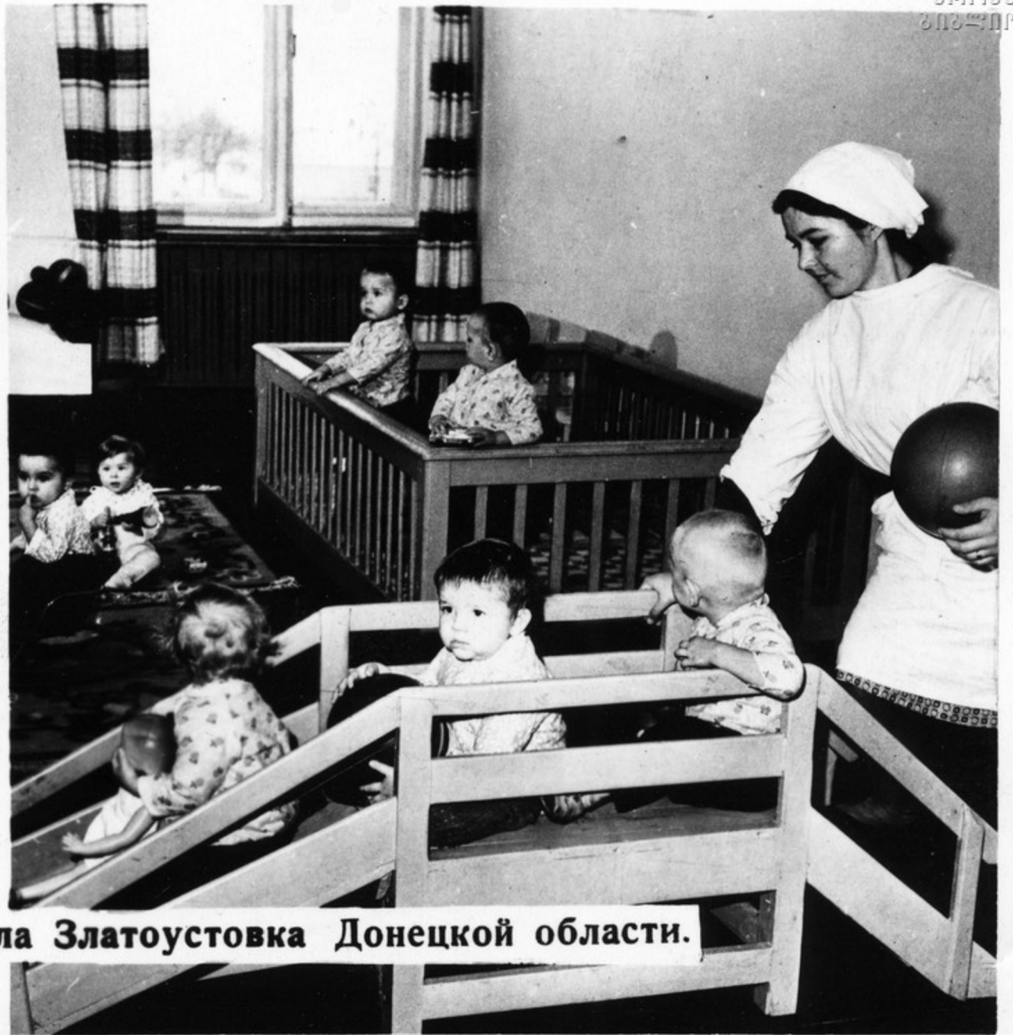
В детском комбинате села Златоустовка Донецкой области.

В часы труда женщина-мать спокойна за своих детей: они окружены лаской и вниманием опытных воспитателей. Миллионы и миллионы детей находятся на попечении детских яслей и садов, школ-интернатов, воспитываются в школах и группах продленного дня.