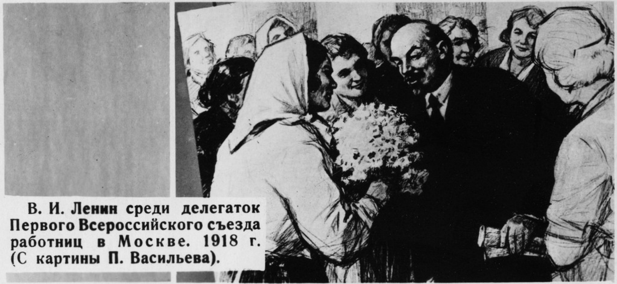
В. И. Ленин среди делегаток Первого Всероссийского съезда работниц в Москве. 1918 г. (С картины П. Васильева).