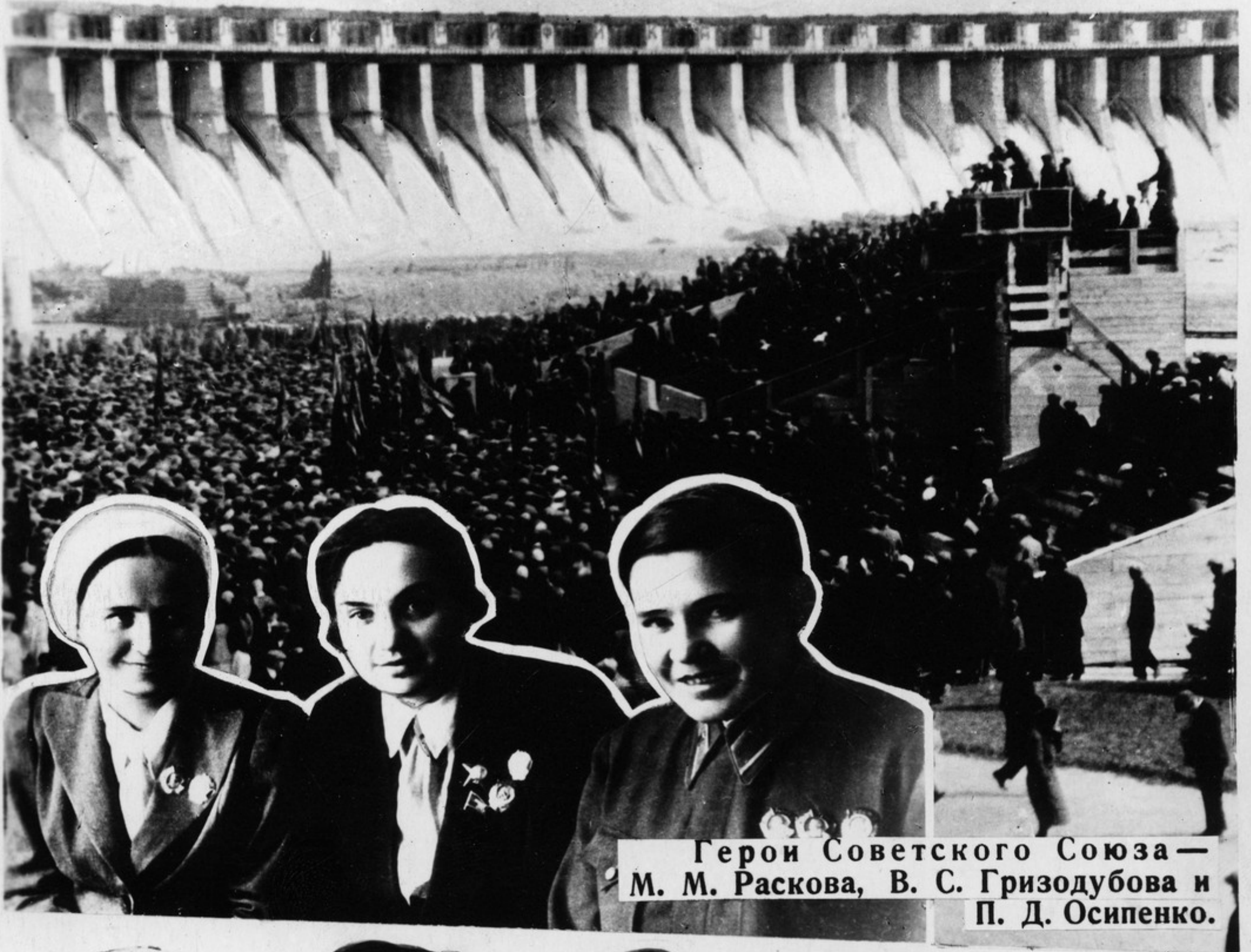
Герои Советского Союза — М. М. Раскова, В. С. Гризодубова и П. Д. Осипенко.