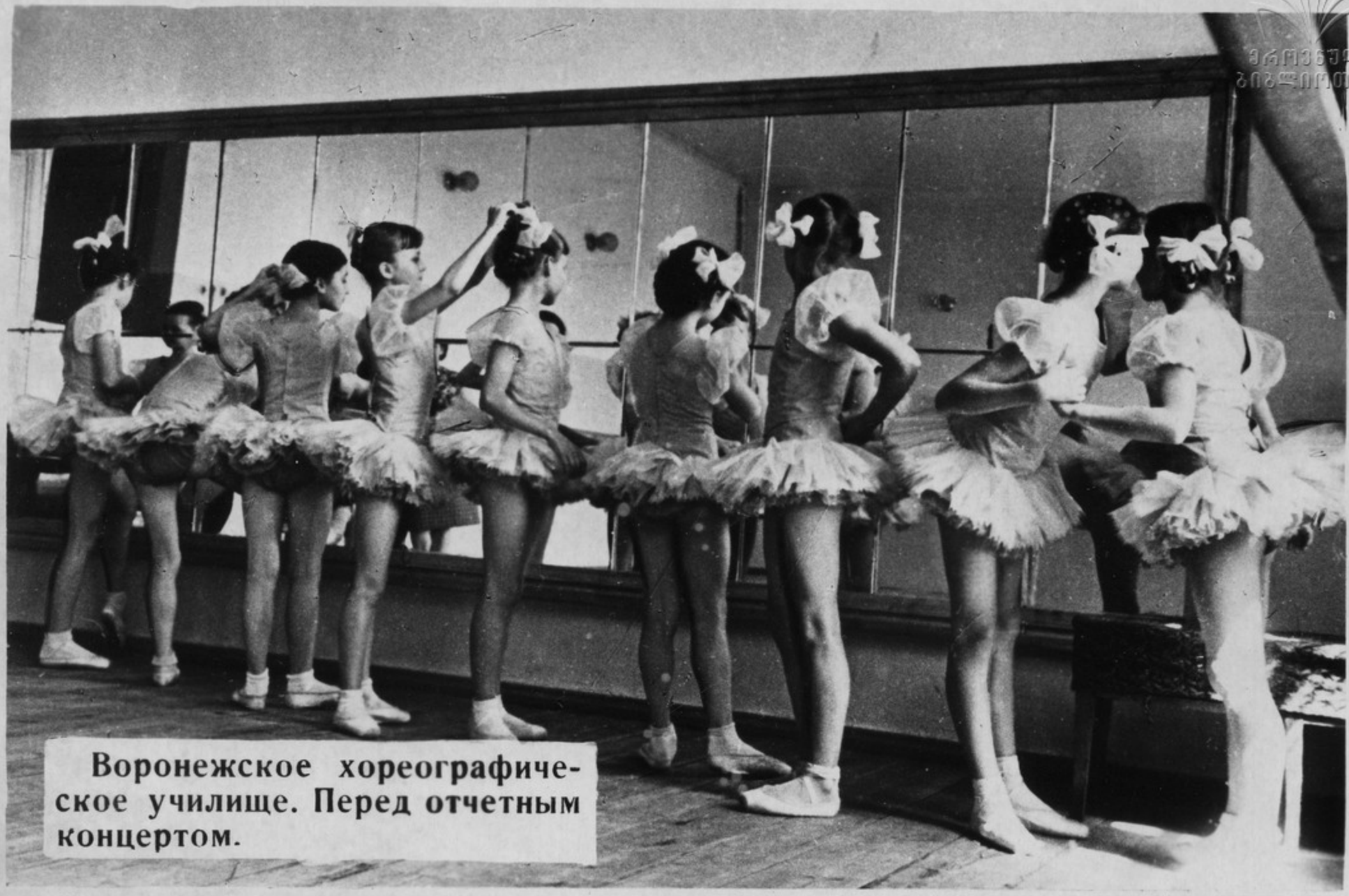
Воронежское хореографическое училище. Перед отчетным концертом.

Впервые в истории человечества страна Советов предоставила женщинам широкие возможности для раскрытия своих талантов и способностей. В мире искусств радуют нас современницы творческими победами и удачами.