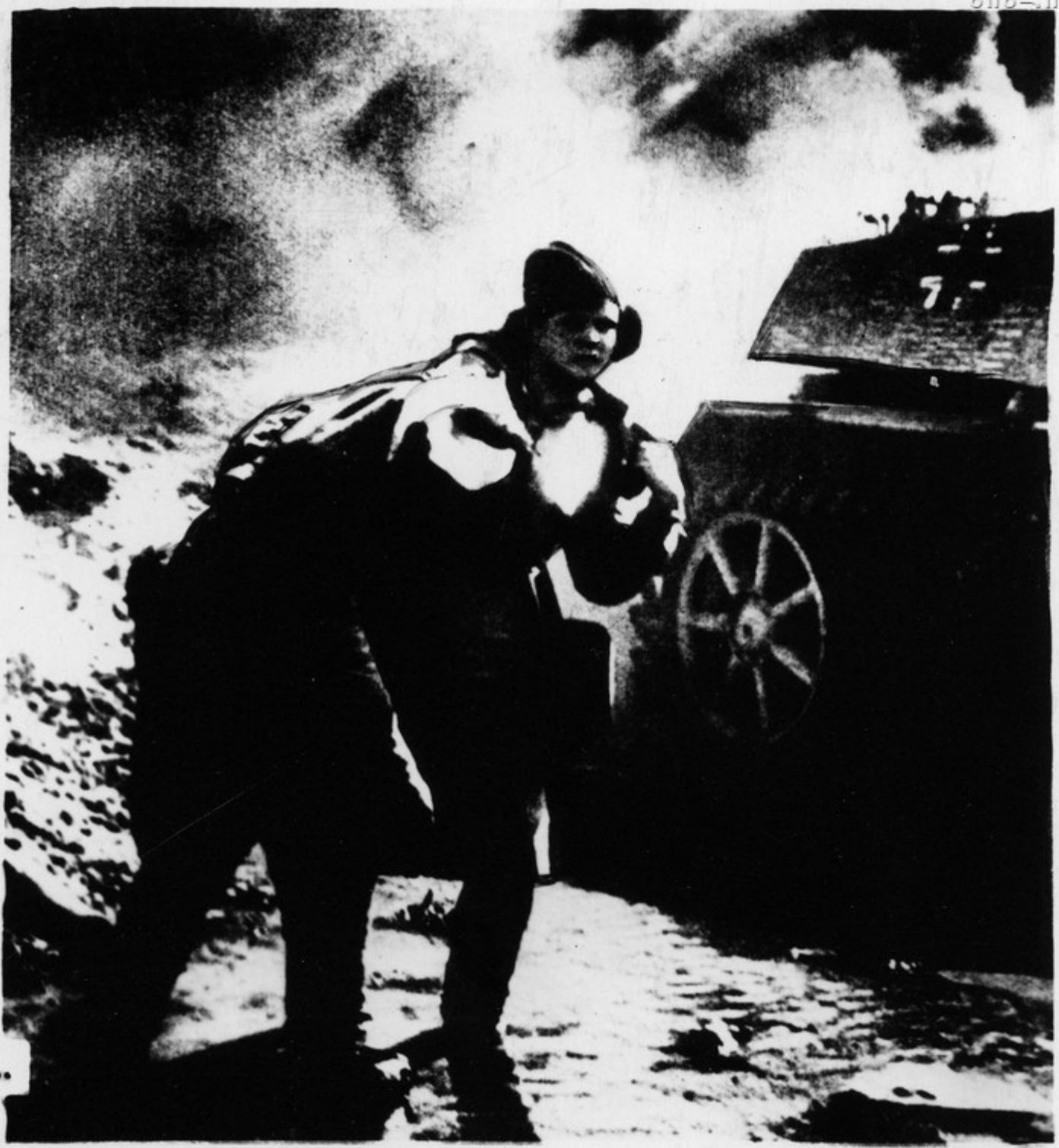
В жаркие минуты боя...

В суровые годы Великой Отечественной войны советские женщины героически отстаивали завоевания пролетарской революции на фронтах, самоотверженно трудились в тылу. Их заслуги по достоинству оценены партией, правительством и народом — тысячи женщин награждены орденами и медалями. 77 из них присвоено звание Героя Советского Союза.