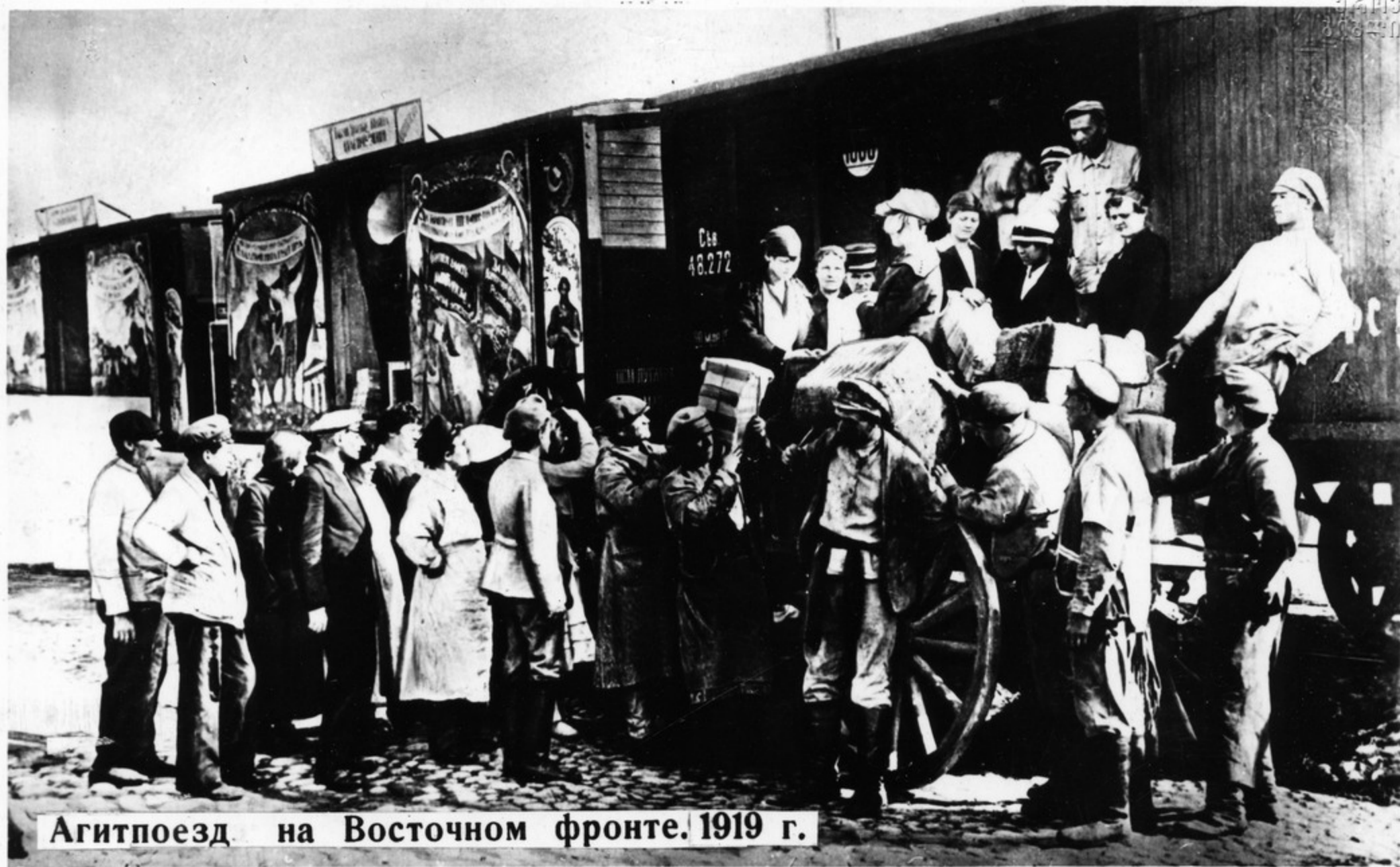
Агитпоезд на Восточном фронте. 1919 г.