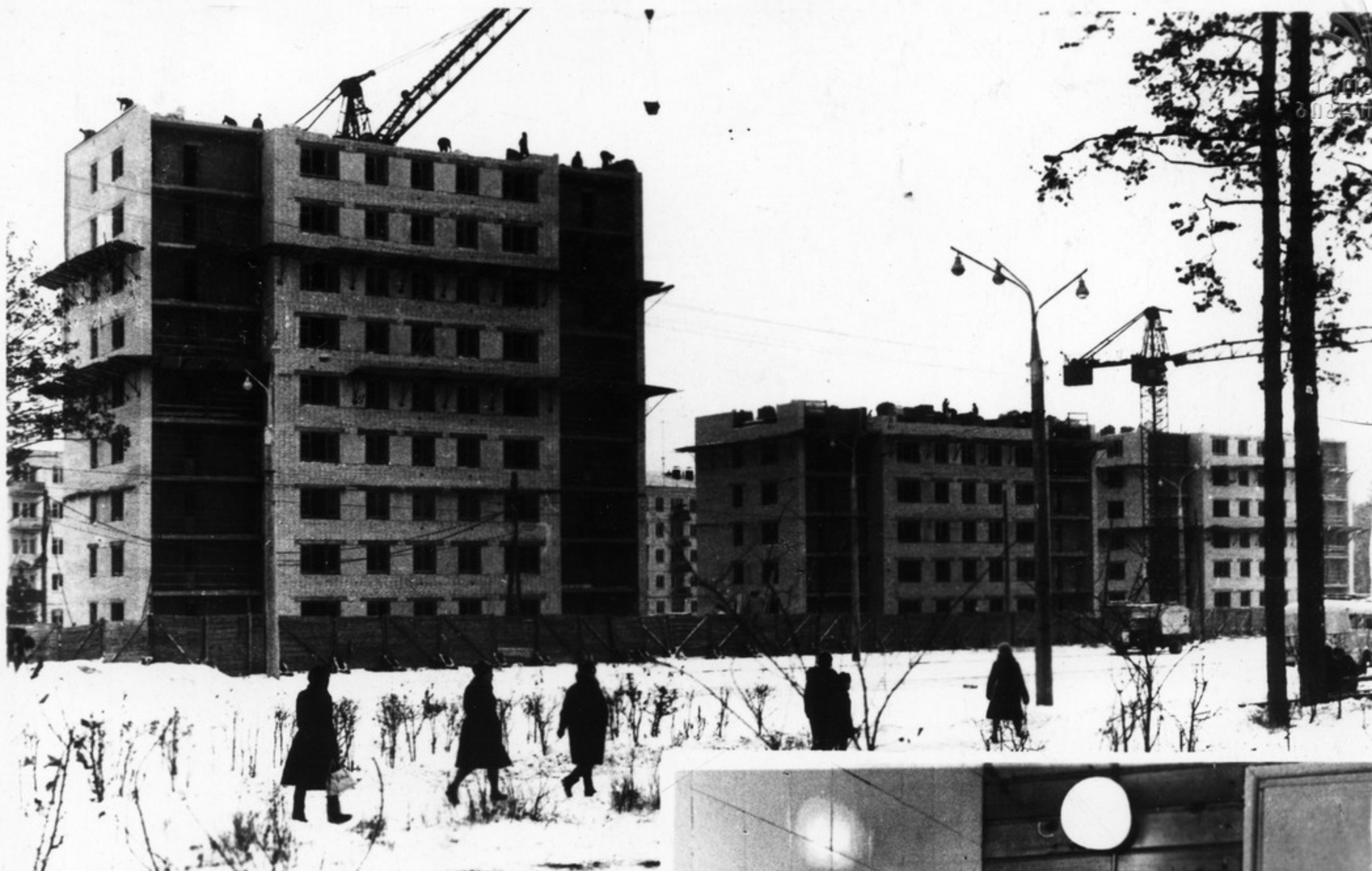
Ангарск. Строительство жилых зданий.

Эстонская ССР. Колхоз имени Эл. Вильде. Приятно хозяйничать в новой кухне.