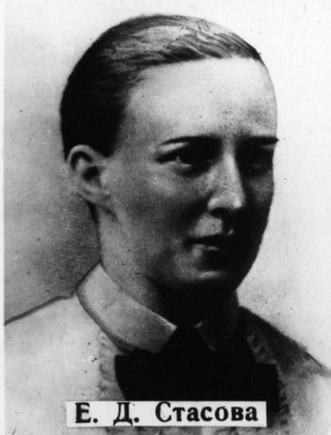
Е. Д. Стасова

Они были первыми, кто от имени Коммунистической партии поднимал и организовывал массы трудящихся женщин на борьбу за социализм.