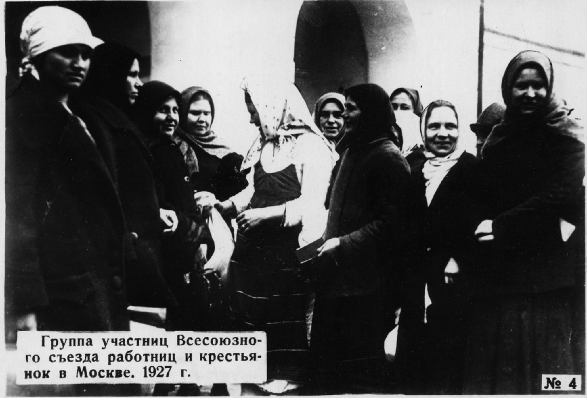
Группа участниц Всесоюзно- го съезда работниц и крестья- нок в Москве. 1927 г.