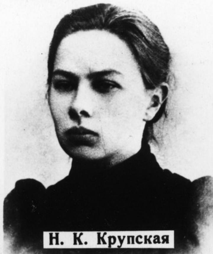
Н. К. Крупская