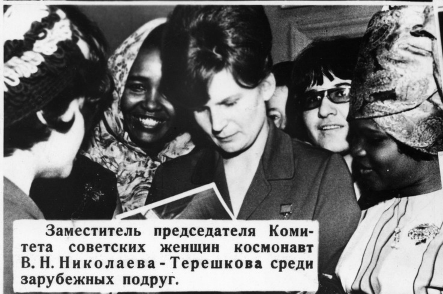
Заместитель председателя Комитета советских женщин космонавт В. Н. Николаева - Терешкова среди зарубежных подруг.