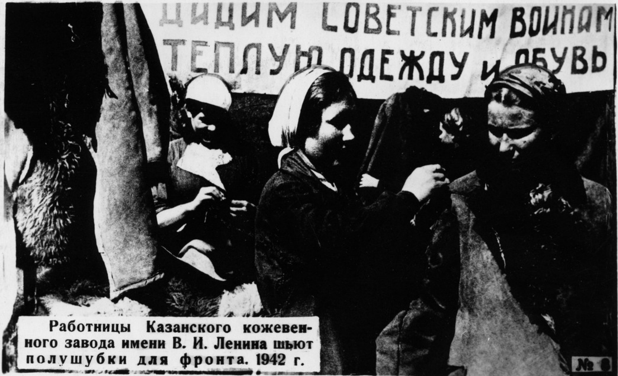
Работницы Казанского кожевенного завода имени В. И. Ленина шьют полушубки для фронта. 1942 г.