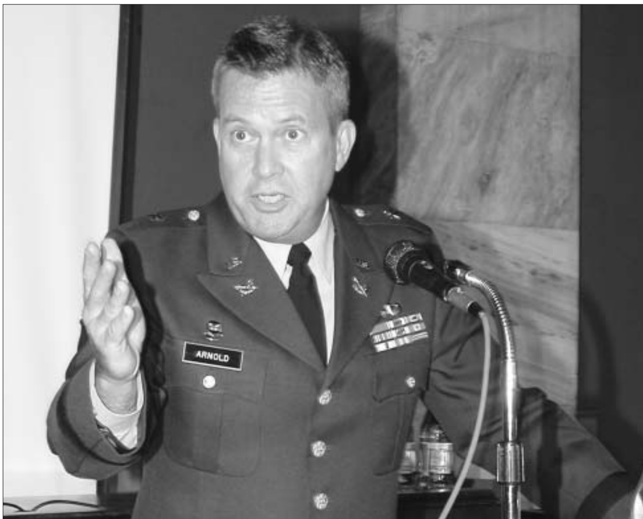
სამხედროები ვალდებულნი არიან, დაეხმარონ ჟურნალისტებს