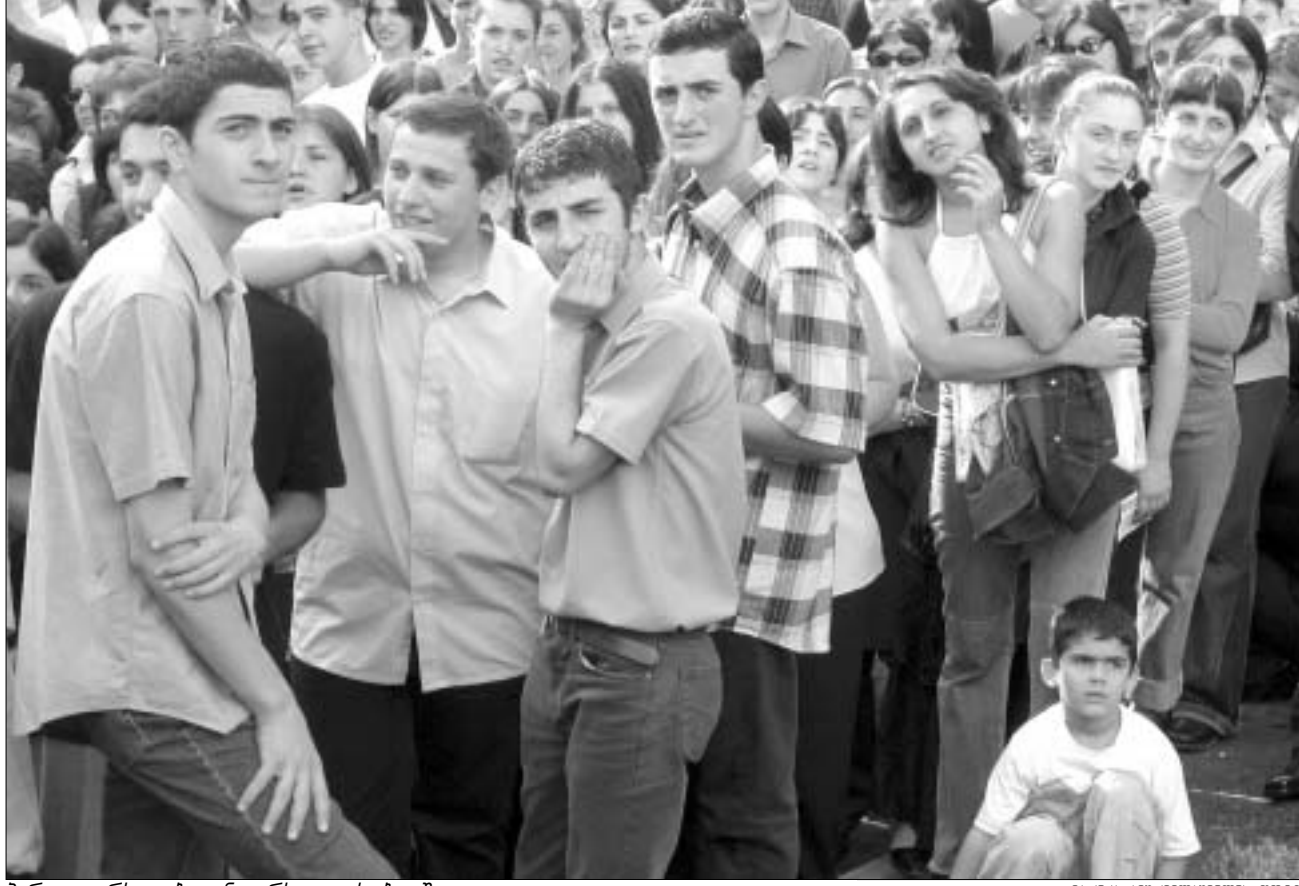
პირველკურსელები უნივერსიტეტის ბაღში