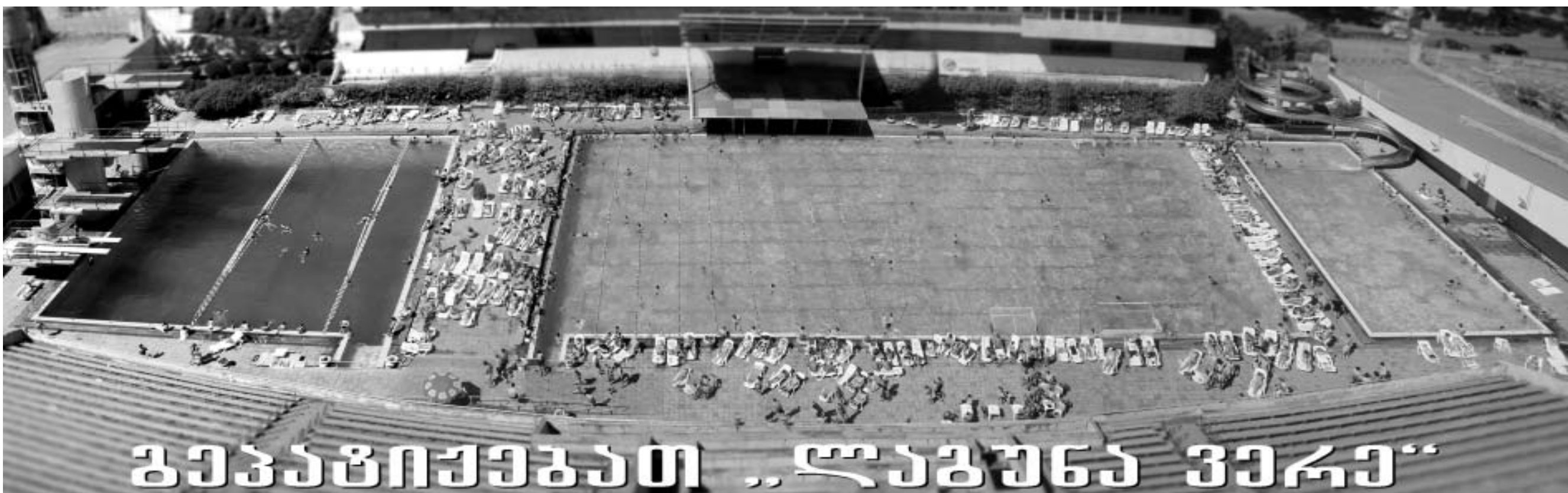
გეგმაპროექტით „ლაგუნა ვიკა“

პირველი სენსაცია დაფიქსირდა. ბერლინის "ჰერტამ" ძირითად დროში ვერ დაამარცხა ჩირილოეთის რეგიონალლიგის აუტსაიდერი "კილი" და საქმე მივიდა პენალტების სერიამდე, სადაც უფრო წარმატებული მღეზვიგ-პოლმტანინელი ფეხბურთელები აღმოჩნდნენ - მათ "ჰერტა" პოკატურნირიდან გამოაგდეს.