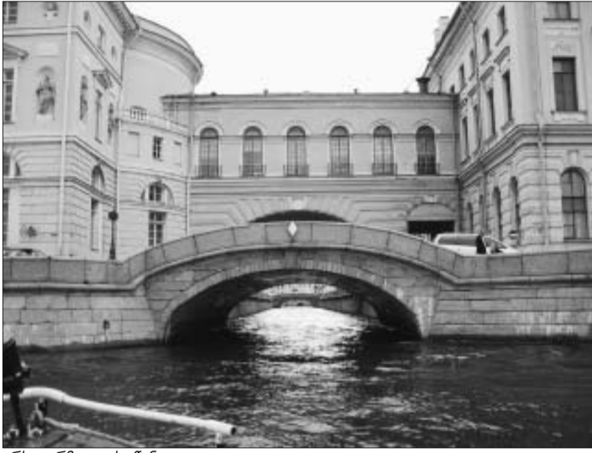
არხი ერმიტაჟის წინ

ზაფხული პეტერბურგში კარგი იდეაა. მითუმეტეს ახლა, როცა რუსეთის ყველაზე ევროპული ქალაქი 300 წლის იუბილესთვის ემზადება. ამ თარიღისთვის პეტერბურგელები ძალზე სერიოზულად ემზადებიან. როგორც თვითონ ამბობენ, разошлись не на шутку – იმდენად, რომ სულ რაღაც ერთ წელიწადში ქალაქი აშკარად ძნელად საცნობარ გახდა. რაც მთავარია, ქალაქის მესვერები ცენტრალური პროსპექტების ფასადების შებათქაშებით არ იფარგლებიან. ამას ბევრი უხერხულობაც მოჰყვება – განსაკუთრებით უცხოელი ტურისტებისთვის. ამ უკანასკნელთ გაზრდისთვის ლაგირება უხდებათ ისედაც უცხო ქუჩებში, რომლებსაც ყოველდღიურად უცვლიან ფერს, ფორმასა და, თქვენ წარმოადგინეთ, მიმართულებასაც.