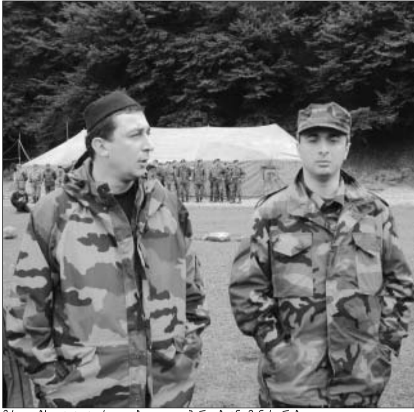
მძევლებს გაავათვისებდნენ. გვირდებიან მინისტრები