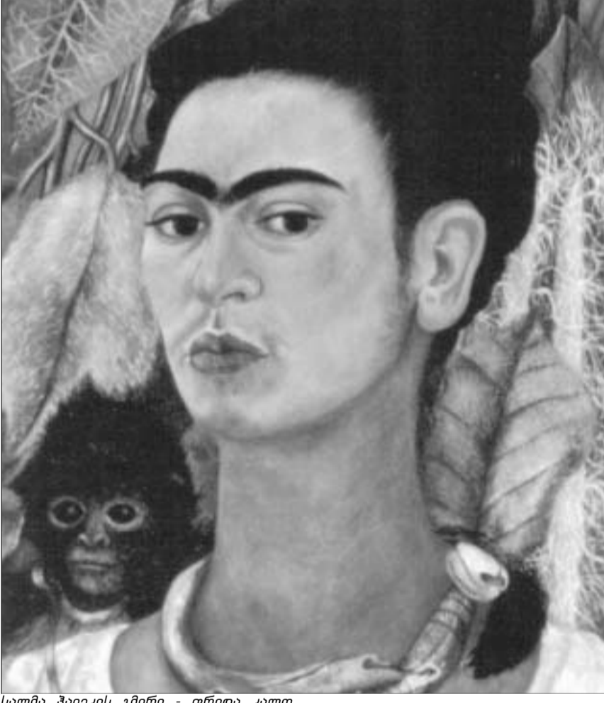
სალმა ჰაიეკის გმირი - ფრიდა კალო

67 წლის ლორენი იტალიაში ორ, ხშირ შემთხვევაში, ურთიერთგამორიცხვ სტატუსს ფლობს – ყველაზე საყვარელი დედა და უბერებელი სექს-სიმბოლო. თუმცა, რაც არ უნდა პარადოქსული იყოს, ის ბუნებრივად ახერხებს ორივე სტატუსის შეთავსებას – ლორენი დღესაც მშვენივრად გამოიყურება და თან მოსიყვარულე დედა რომ არის, ამას საზოგადოებაში მხატვრის როლს, რომელსაც ქმართან არეული ურთიერთობები აქვს. მას ტანჯავს იმის გახსენება, რომ ახალგაზრდობაში საკუ-