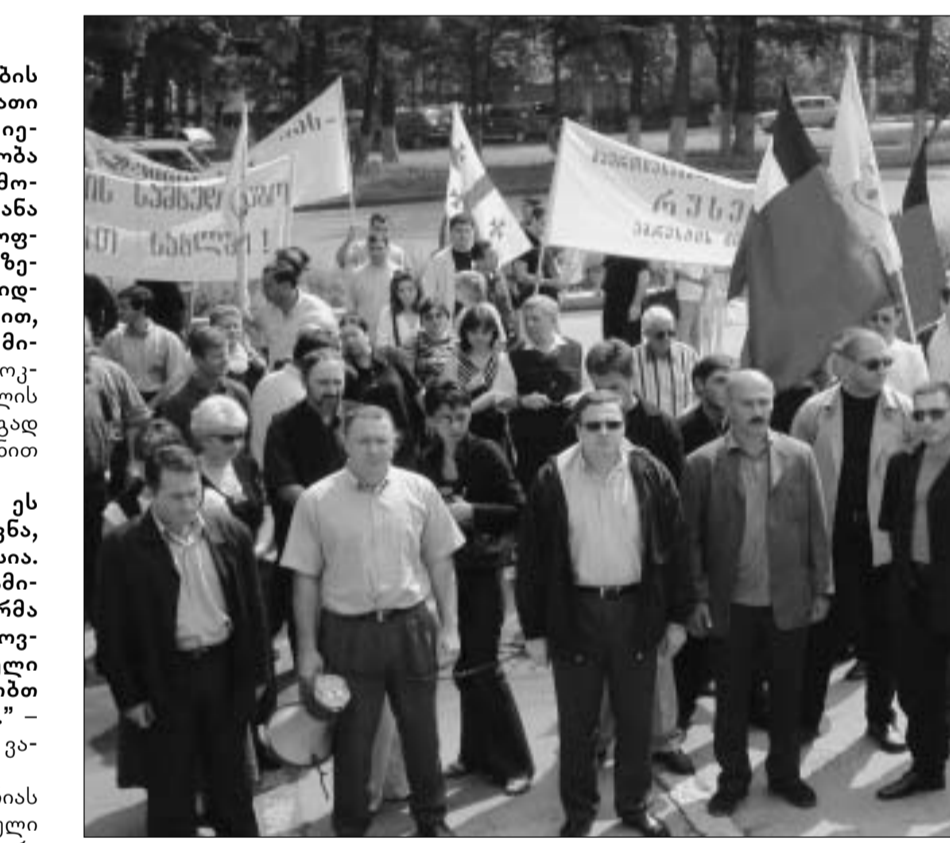
"გაერთიანებული დემოკრატები" რუსეთის სამხედრო ძალების შტაბთან

ბული ყველა რუსული სამხედრო ბიიტების წინაა დავგებშილი. "დემოკრატებმა" მოსახლეობას პროტესტის გამოხატვის ორიგინალი უჩინო ხერხი ასწავალეს: "მიგმერთავთ საქართველოს მოქალაქეებს, როცა ამ შენობას მანქანით ჩაუვ-