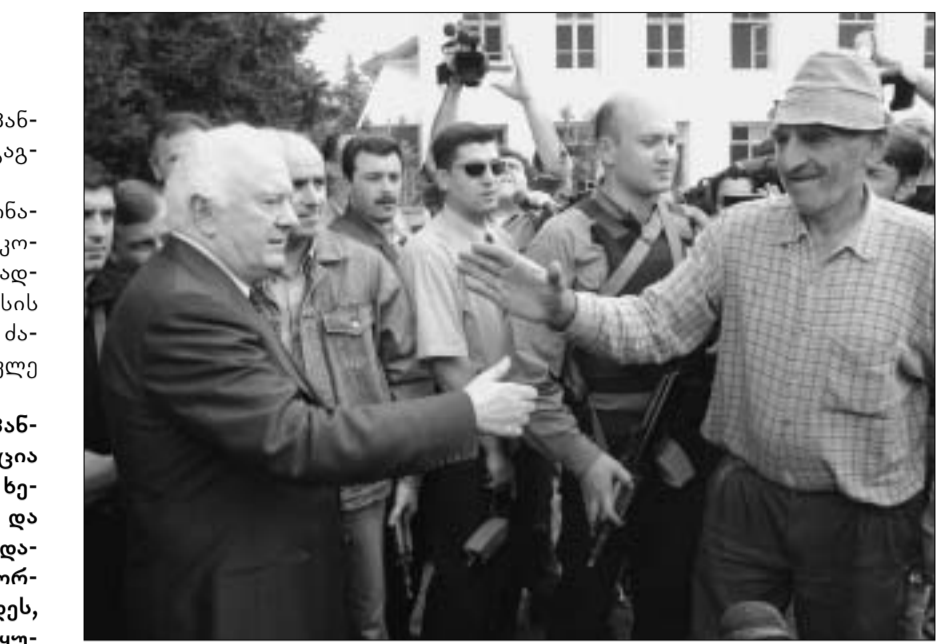
ხალხი პრეზიდენტს იმისთვის ელოდებოდა, რომ ხელი ჩამოერთმია და მადლობა ეთქვა.