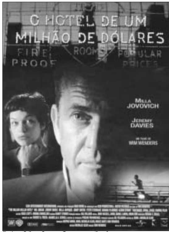
სასტუმრო მილიონი დოლარად