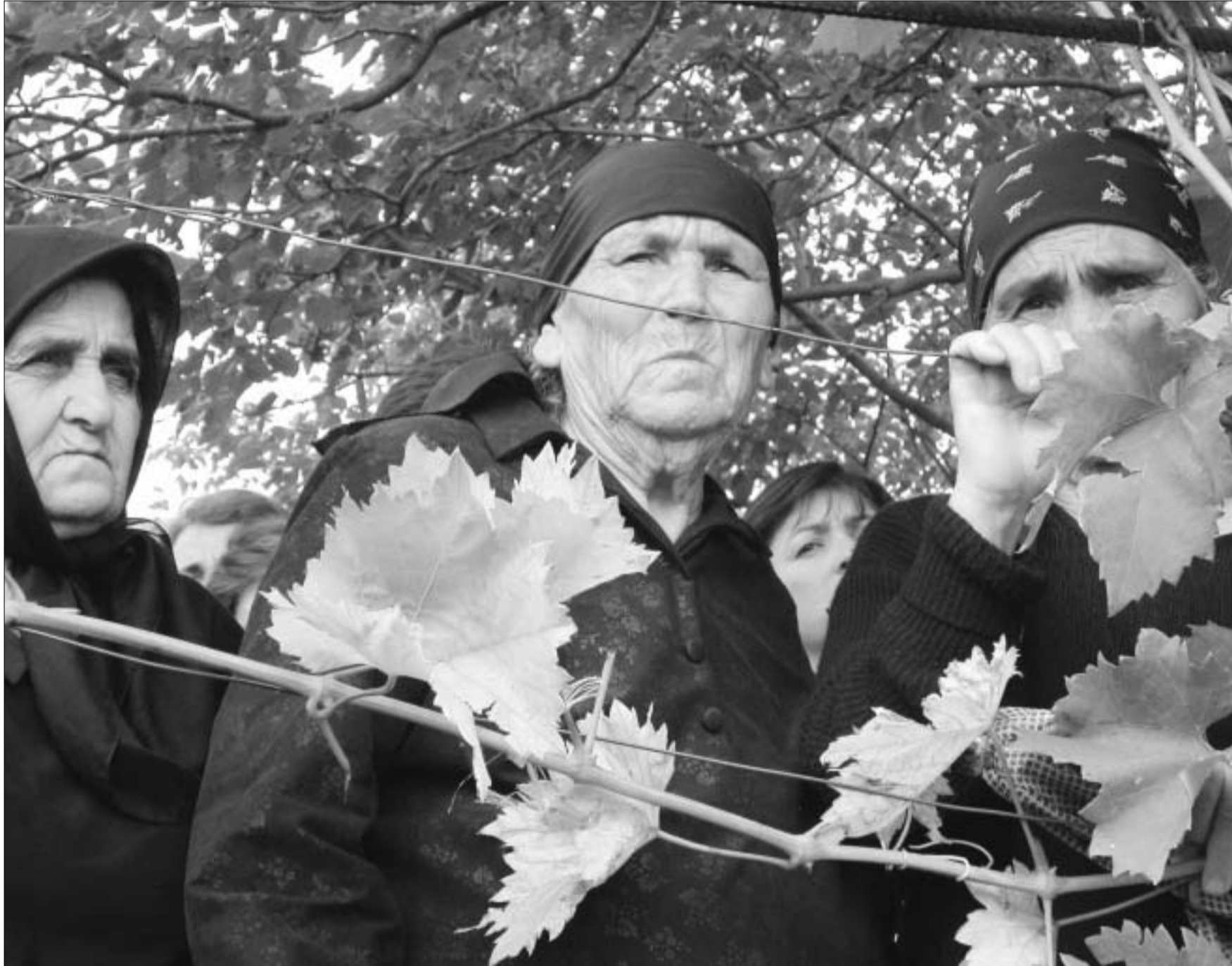
ასე ისმენდნენ ჭირისუფლები პრეზიდენტის სამძიმარს