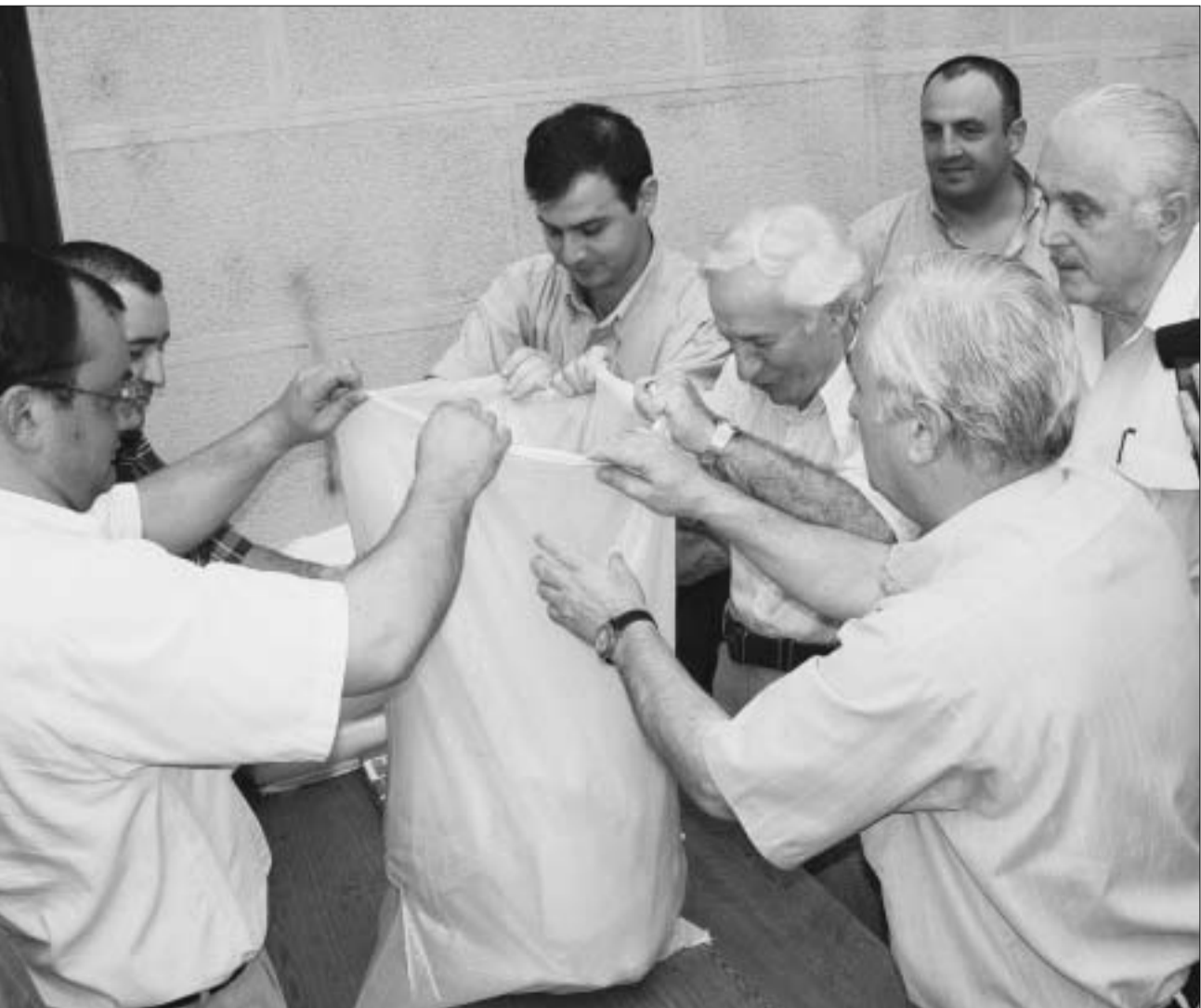
ბიულეტენების ტომრებში შედუთვა დიდ ძალბებს მოიხიზოს.