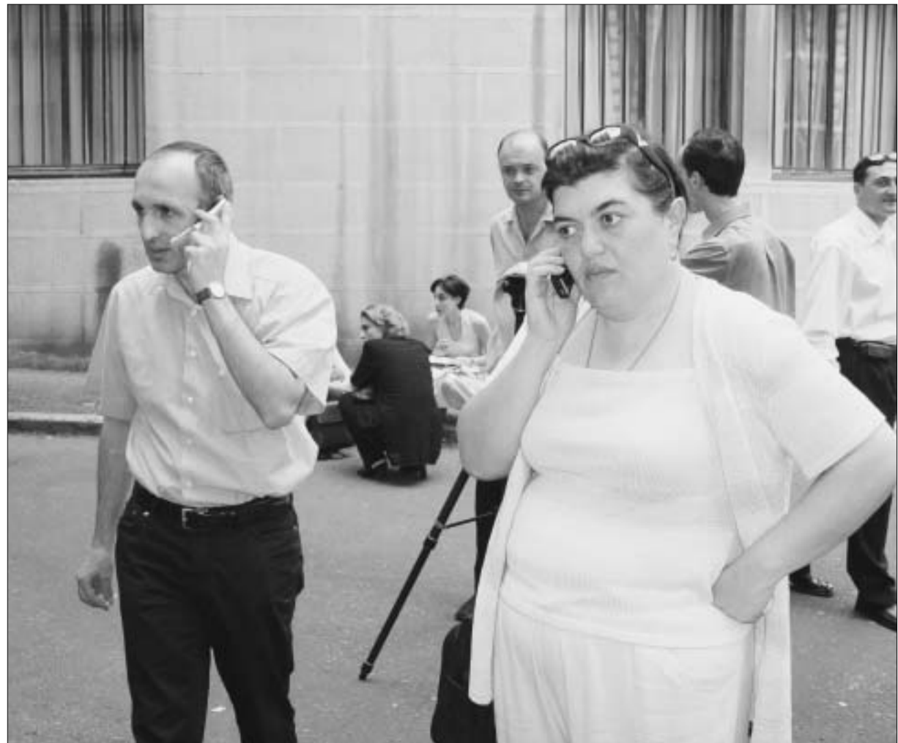
ბიულეტენები ამოიტანეს - პირველი ინფორმაციები პარტიულ შტაბებში.