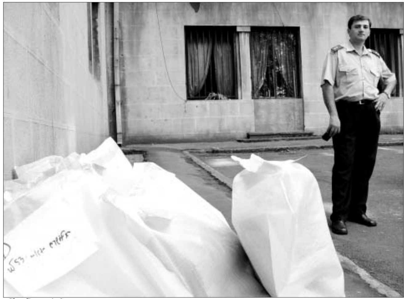
არჩევანს იცავს პოლიცია.

და კიდევ: ინვენტარიზაციის პროცესს, ცესკო-ს წევრების გარდა, მხოლოდ "ნაციონალური მოძრაობის" წარმომადგენლები დაესწრნენ. რაც შეეხება ლეიბორისტებს, მათ კომისიაში საკუთარი წევრი ჰყავთ და, შესაბამისად, გუშინ დამხმარე ძალა არ სჭირდებოდათ.