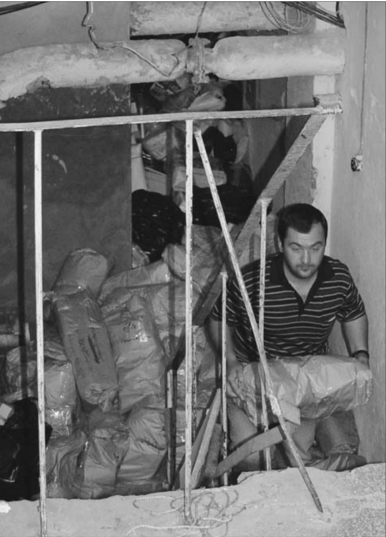
თბილისელთა არჩევანი სარდაფიდან ამოაქვთ.