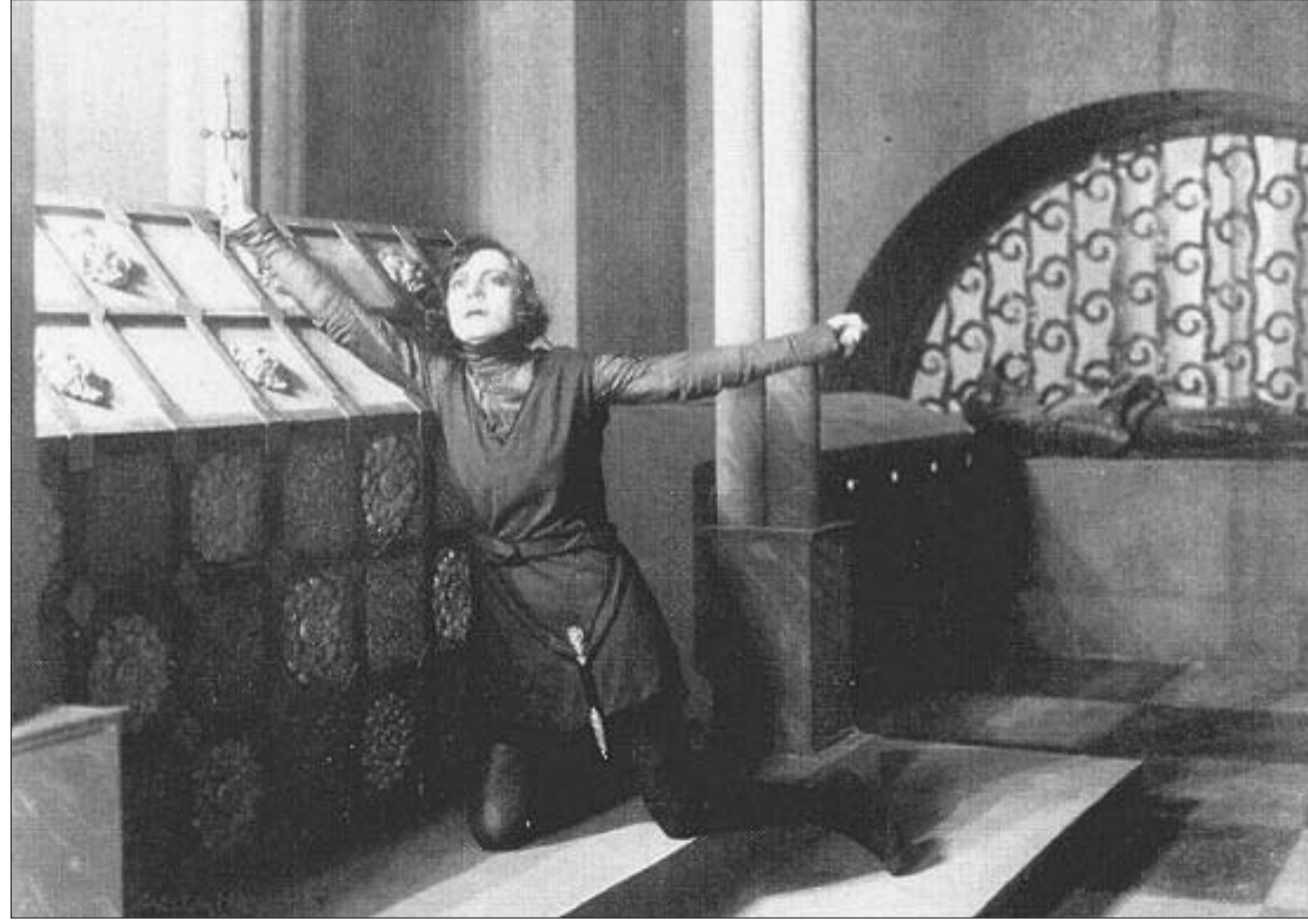
ასტა ნილსენი ჰამლეტის როლში

ალნიშნული ოუმორი და სიბრძნე მკითხველს თვალში ხვდება 1946 წლის გამოქვეყნებული მოგონებების, "მღუმარე მუზის" (ორიგინალში Den