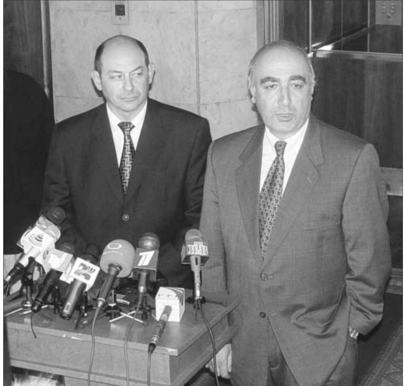
ვლადიმირ რუშაილო და თედო ვაფარიძე

სტრუქტურების შეთანხმებული მოქმედების საკითხებიც. როგორც საქართველოს უშიშროების საბჭოს მდივანმა თეოდორ ვაფარიძემ დააზუსტა, შეხვედრაზე არ ყოფილა საუბარი ერთობლივ ოპერაციაზე პანკისის ხეობაში. ვიზიტის განმავლობაში რუშაილო შეხვდა უშიშროების მინისტრს, დაგეგმილი შეხვედრები საქართველოს პრეზიდენტთან, სახელმწიფო მინისტრთან, საგარეო საქმეთა მინისტრთან.