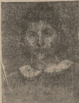
დაიბადა 1954 წლის 1 აპრილს,

1971 წელს დაამთავრა ზუგდიდის მე-5 საშუალო სკოლა წარჩინებით. იმავე წელსვე ჩაირიცხა თბილისის სახელმწიფო უნივერსიტეტის სურნალისტიკის განყოფილებაში, რომელიც აგრეთვე დაამთავრა წარჩინებით. პარალელურად სწავლობდა აგრეთვე ხელოვნებათმცოდნეობის ფაკულტეტზე კინოდრამატურგიის სპეციალობით, რომელიც დაამთავრა 1978 წელს.