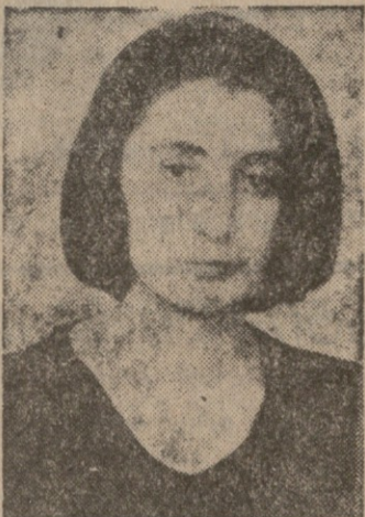
დაიბადა 1964 წლის 7 ივნისს სოფელ დარჩენაში.

1981 წელს დაამთავრა დარჩენის საშუალო სკოლა. 1982 წლიდან მუშაობს ზუგდიდის რაიონის ცენტრალურ ბიბლიოთეკაში, ამჟამად მომსახურების განყოფილების გამგეა. 1985 წელს ჩააბარა (დაუსწრებლად), თბილისის სულხან-საბა ორბელიანის სახელობის სახელმწიფო პედაგოგიურ ინსტიტუტში ბიბლიოთეკათმცოდნეობა — ბიბლიოგრაფიის სპეციალობაზე, რომლის სრული კურსი დაამთავრა 1990 წელს. 1990 წლის იანვრიდან სრულად საქართველოს რუსთაველის საზოგადოების ზუგდიდის საკრებულოს თავმჯდომარეა. მუშავს მეუღლე და ორი შვილი