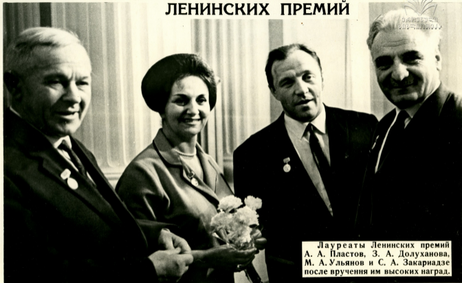
Лауреаты Ленинских премий А. А. Пластов, З. А. Долуханова, М. А. Ульянов и С. А. Закаридзе после вручения им высоких наград.

В Москве в Свердловском зале Кремля состоялось торжественное вручение Ленинских премий 1966 года деятелям социалистической культуры за наиболее выдающиеся достижения в области искусства.