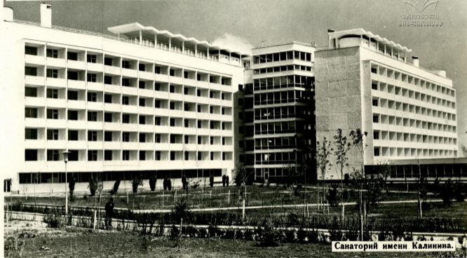
Санаторий имени Калинина.

В этом году курорт „Ессентуки“ обогатился еще одним дворцом здоровья. Принял первых отдыхающих новый санаторий имени Калинина.