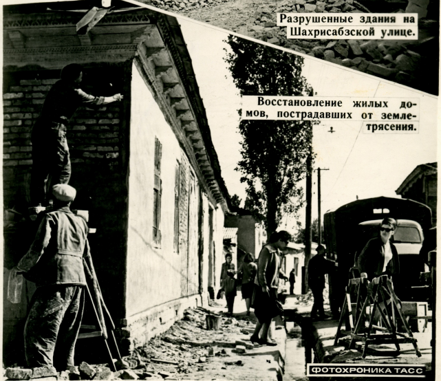
Восстановление жилых до- мов, пострадавших от земле- трясения.