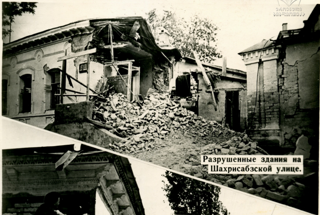
Разрушенные здания на Шахрисабзской улице.