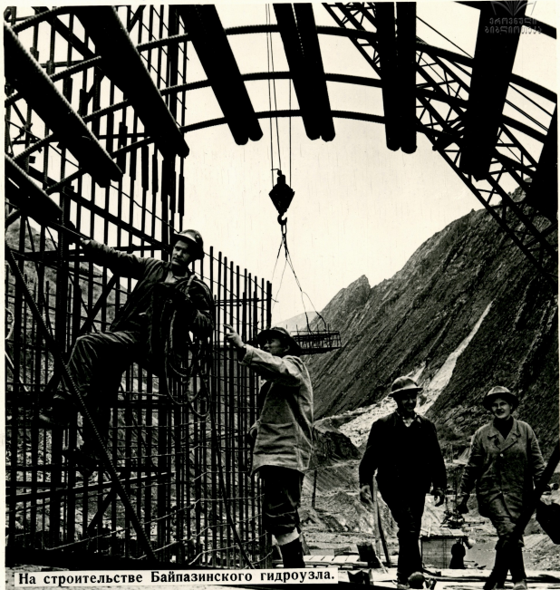
На строительстве Байпазинского гидроузла.

Байпазинский гидроузел — ключевой объект одной из самых сложных гидротехнических строек Таджикистана. Из огромного водохранилища живительная влага Вахша по тоннелям, которые сейчас прокладываются через хребты Каратау и Джетымтау, попадет в безводные долины. Здесь на орошенных землях возникнут новые крупные хлопководческие районы.