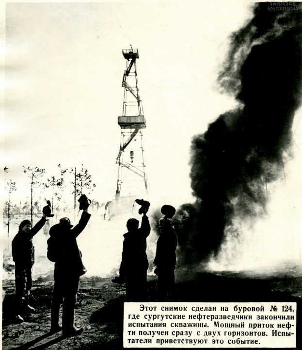
Этот снимок сделан на буровой № 124, где сургутские нефтеразведчики закончили испытания скважины. Мощный приток нефти получен сразу с двух горизонтов. Испытатели приветствуют это событие.

Все новые и новые фонтаны нефти поднимаются над тайгой Тюменского Севера. Двадцать восемь месторождений нефти открыли геологоразведчики за последние годы в недрах тюменской земли. В таежных дебрях Севера, в тундре Ямала они продолжают свой трудный поиск.