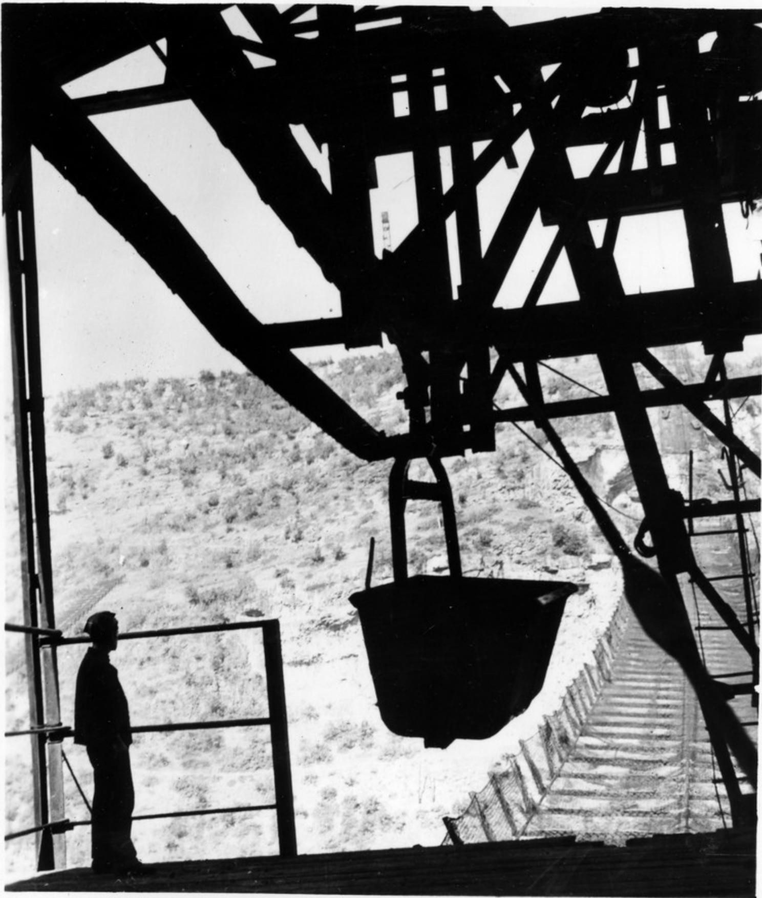
მარნის ჰარაზორვა გამაგრირებადი უბ- ანიკირან

ჭიათურის გამაგრირებადი უბანიკეში დარგმუნია უახლესი საგადევიზიო რანარგირები. ეს დინკავჩიას საშენებელს ამ- დევს მართოს ყველა სააშქარ, თვადი არევნოს გაქნოლოშია პროცესს.