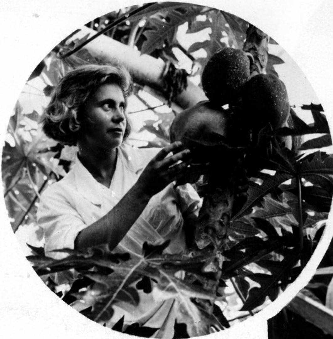
დემოკანში ზეჩინეა ესეკოვკა

გაგის ახლოს მდებარეობს სსრ კავშირის მეცნიერებათა აკადემიის მთავარი ბოტანიკური ბაღის საყარდნი კუჩუჩი. ამ ოკან-ქეჩეებში თავნიანთი მემკა საშუმბლო იკოვკა ოკანი დანახედების ზკოვიკედებ მენეკებ. მათ შოკის დორ ინჟეკენს ინჟეკენ კეკეოს ხეები დე ნესვის ხე, ანუ. კომოკს მეს მენსიკეში უწოდებენ „კეკიკე კეკიკე“.