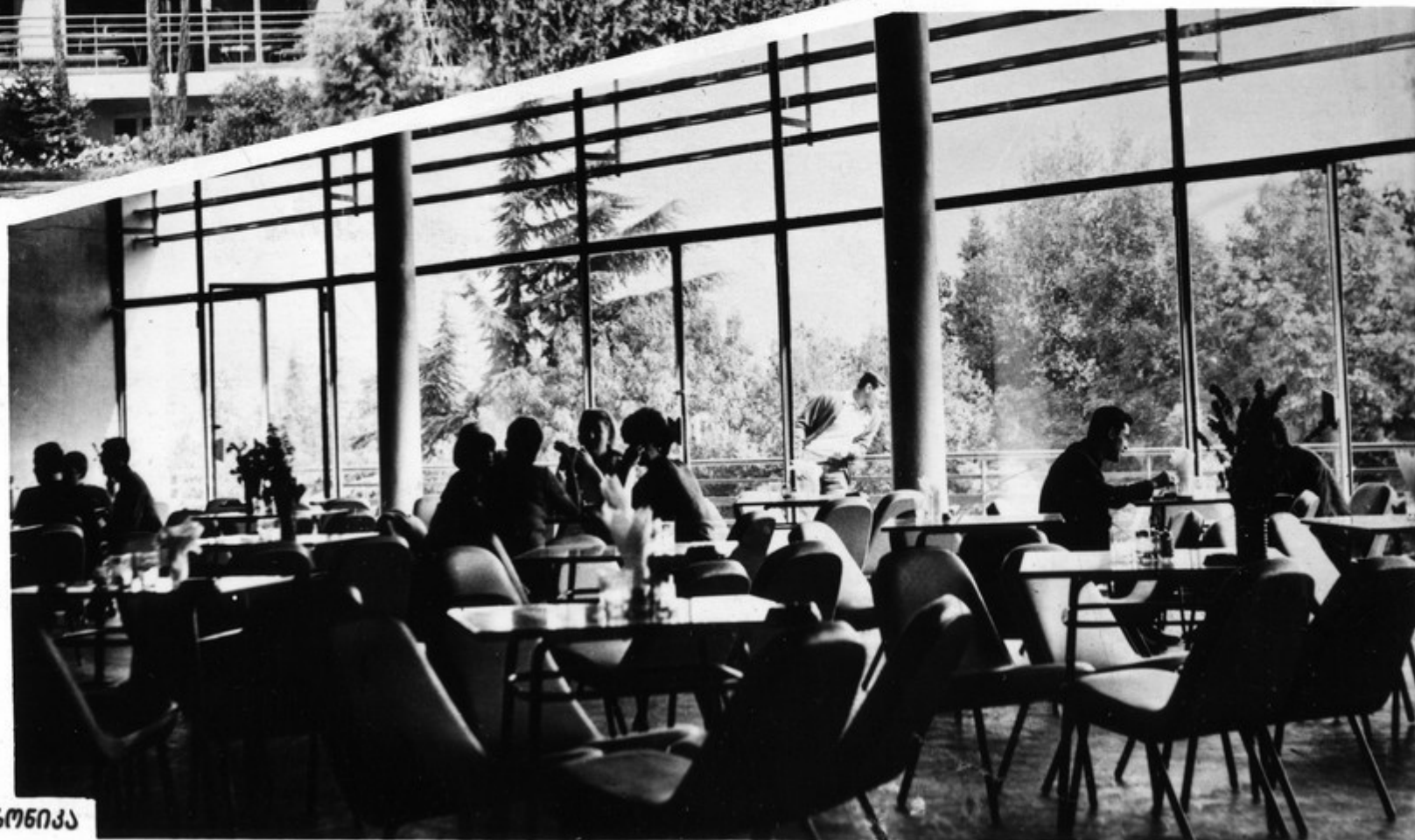
კაფე-სასადილოს ერთ-ერთი კუთხე