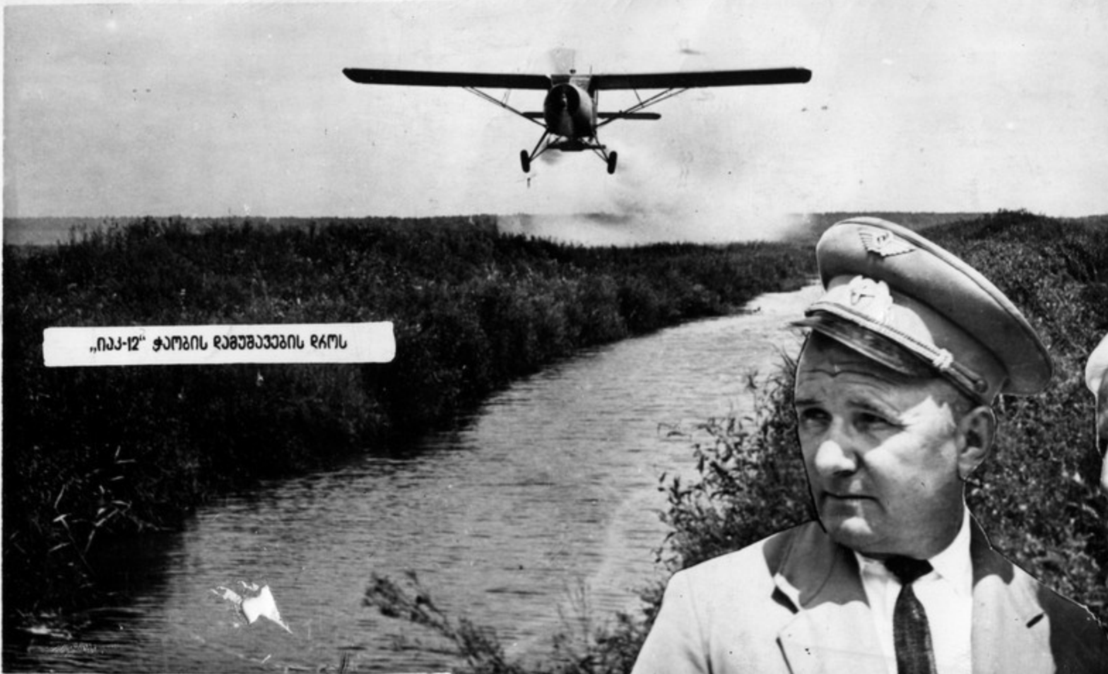
„იკ-12“ ტომის რამზავეზის რაოს