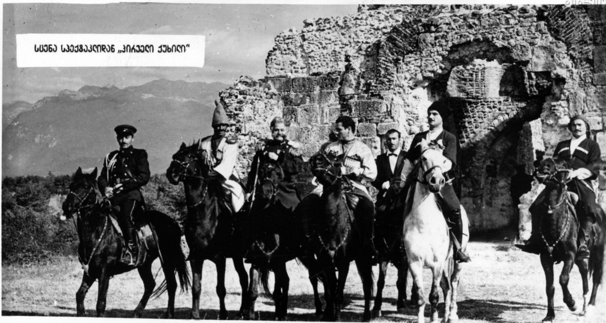
სტანა სპეციალიზაცია „პირველი ქუჩილი“

გურჯაანის რაიონის სოფელ დინდოში გაიშალა საზოგადოება, რომელიც მიეძღვნა ავსტრალიის აჯანყების ასი წლისთავს. საზოგადოება წარმოადგენს დინდოს მოსახლეს, სულ ასი წლის წინათ აჯანყება მოხდა, გამომდინარე მხარგრავის თვითმკვლელების კოლაქციები, გაიშალა სახალხო სანიტობა. ამ აჯანყებას სტანა სპეციალიზაცია „პირველი ქუჩილი“. ეს სპეციალიზაცია დინდოს პირველი აჯანყების 100 წლისთავს.