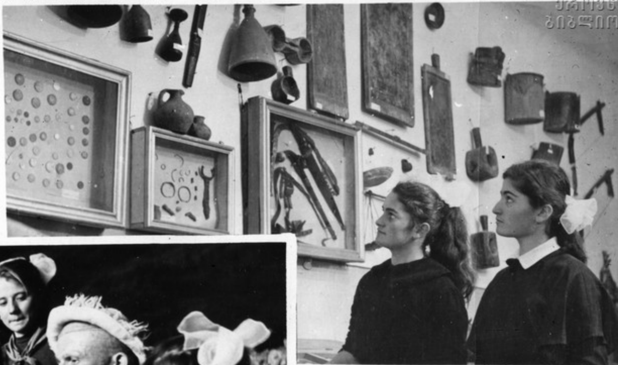
მუზეუმის ერთ-ერთი კუთხე