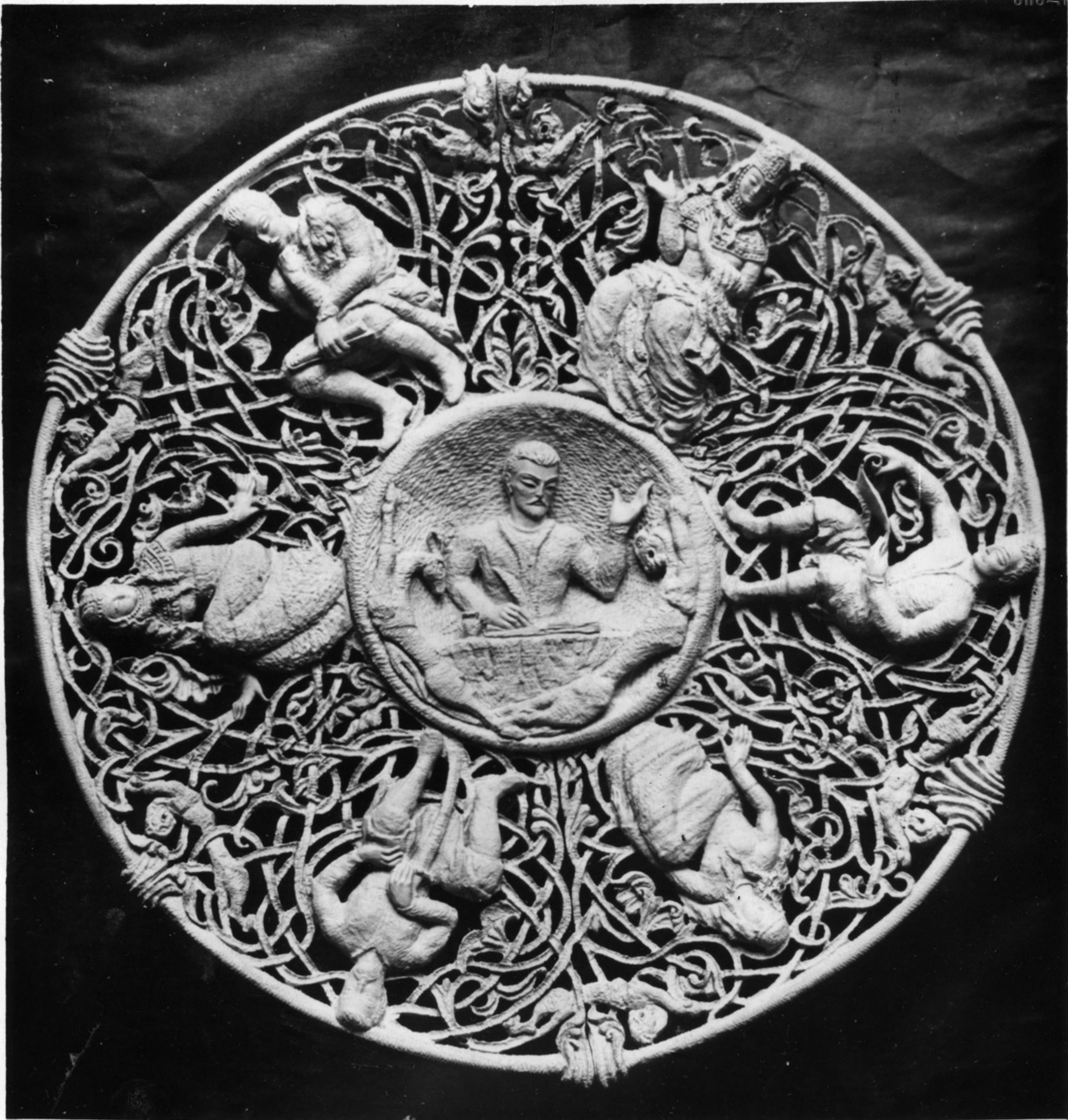
ეს გზის დაკრძალული დაწვანი დააგზადა ხედაიაჯვე ოსვაგმა აისან ფოჩხუამ შოთა ანს- თავედის იუგიდასათვის. დაწვანა გემოსახულია შოთა ანსთავედი და „ვეზისწყაოსნის“ ძირი- თარი ვეისონაეები.