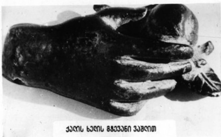
ქალის ხალის მგავანი ვაშლით