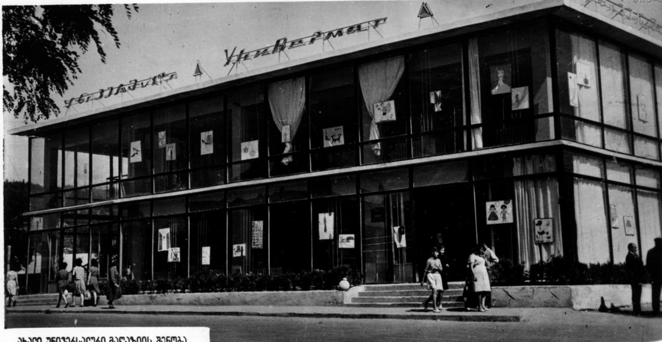
ახალი უნივერსალური მაღაზიის შენობა საშენებლო

აიღონებ ცანჯა ხაშუაში საექსპლუატაციო გარეცხა უნივერსალური მაღაზიის ორსართულიანი შენობა. მაღაზიის ავა სექციებში აიის მკავედგვაი სექციონი.