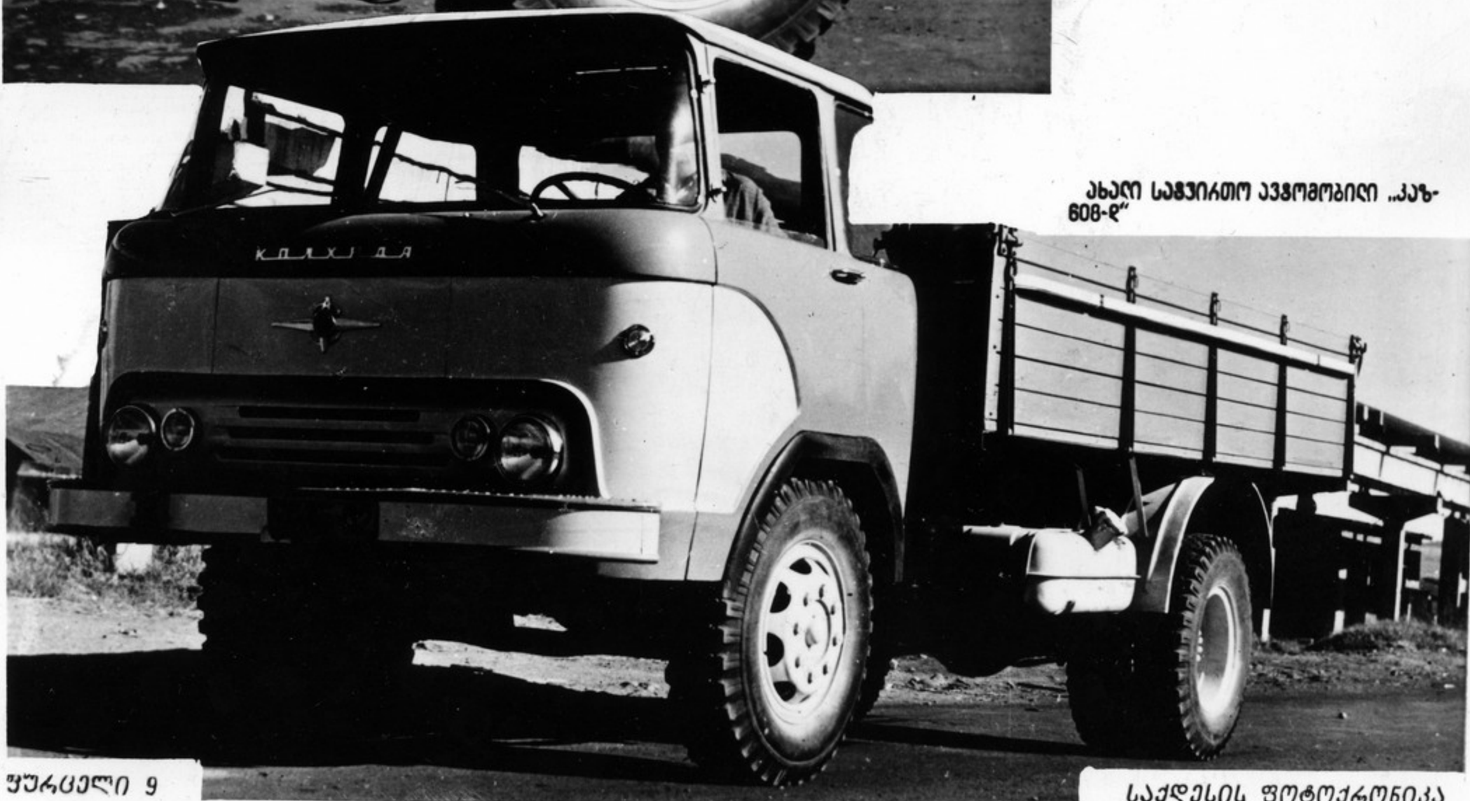
ახალი საფორმული ავტომობილი „კაზ-608-ე“

ქუთაისის ოჯონიკი-ძის სახელმწიფო საავტომობილო ქარხანაში შეიქმნა ახალი მანქანის ავტომობილი „კაზ-608-ე“, რომლის ფორმული მანძილია 4.5 ზონა. მანქანის კაბინა ავტომობილზე უკეთესად უზრუნველყოფს მძღობის ყოველი კუთხის შეკეთებას.