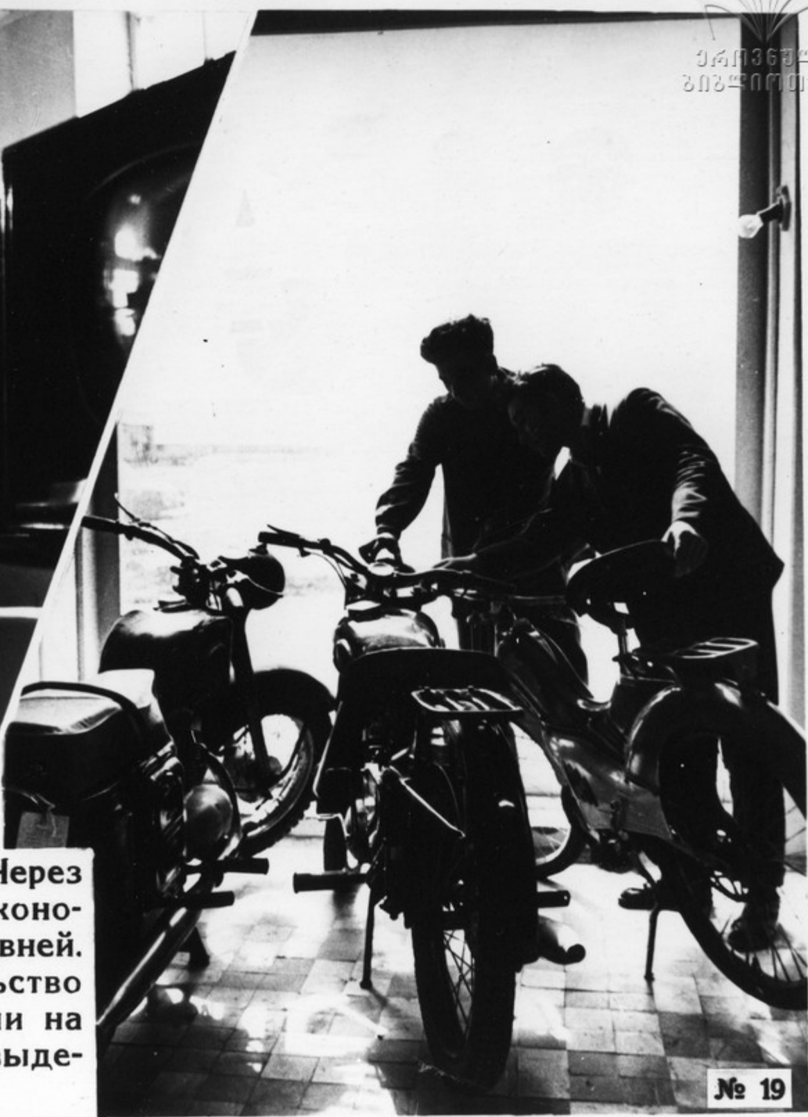
В магазине колхоза „Коммунизм“ Ашхабадской области.

Велика роль сельской торговли. Через нее непосредственно осуществляется экономическая смычка между городом и деревней. За последнее время партия и правительство приняли меры для улучшения торговли на селе. Цены приравнены к городским, выделены дополнительные фонды товаров.