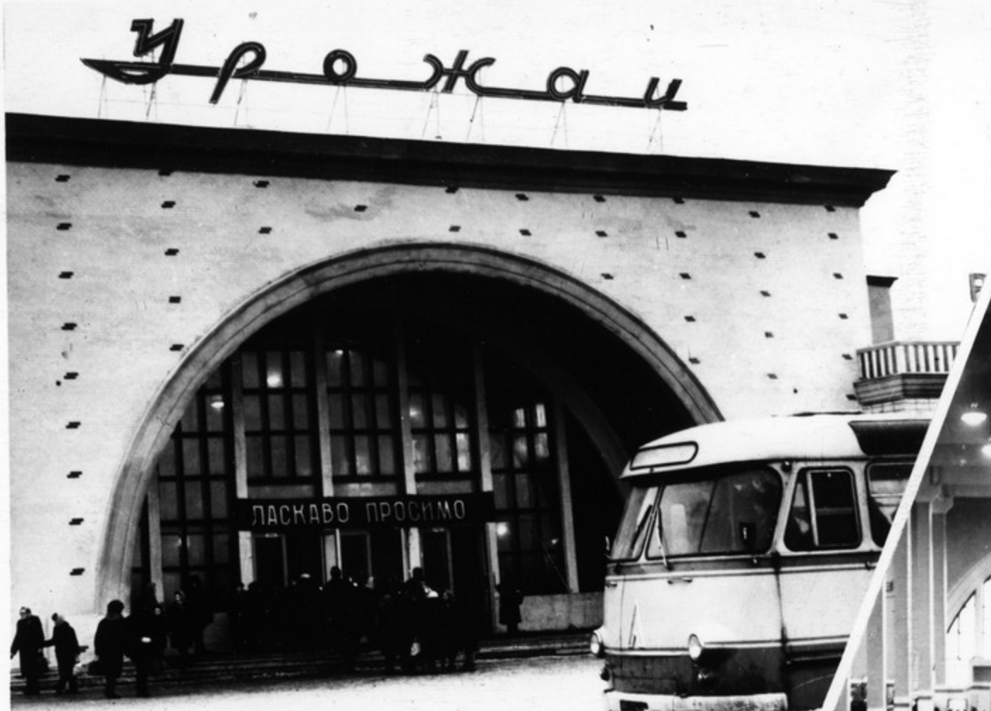
Колхозный рынок „Урожай“ в Виннице.