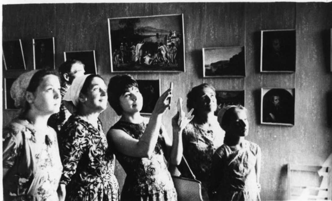
Передвижная выставка Государственной Третьяковской картинной галереи в деревне Домотканово Калининской области.

Вместе с ростом материального и культурного благосостояния тружеников села растут и их запросы. Во многих селах уже сейчас есть свои музыкальные школы, народные театры, музеи. В новой пятилетке их будет значительно больше.