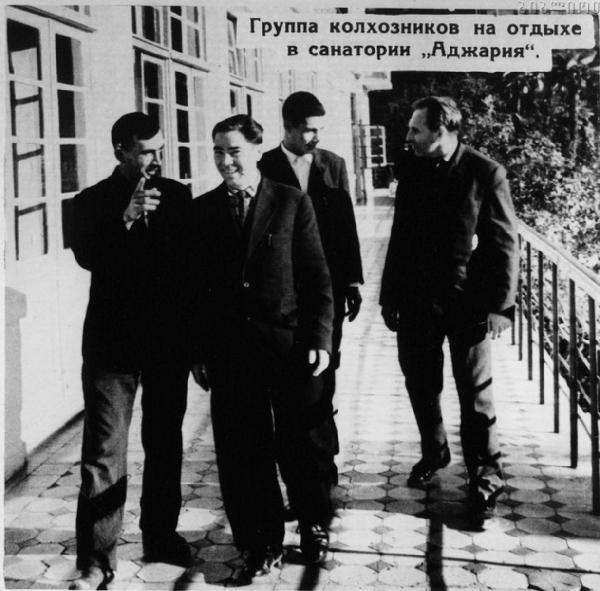
Группа колхозников на отдыхе в санатории „Аджария“.

Партия и правительство считают необходимым в больших масштабах развивать санаторно-курортное лечение и отдых сельских тружеников и их детей. В настоящее время к услугам трудящихся — широкая сеть межколхозных санаториев, домов отдыха, пансионатов, пионерских лагерей.