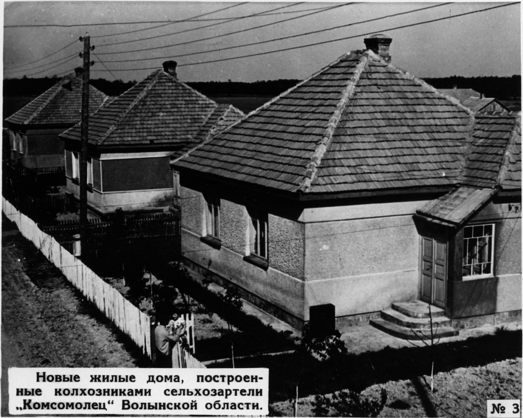
Новые жилые дома, построенные колхозниками сельхозартели „Комсомолец“ Волынской области.