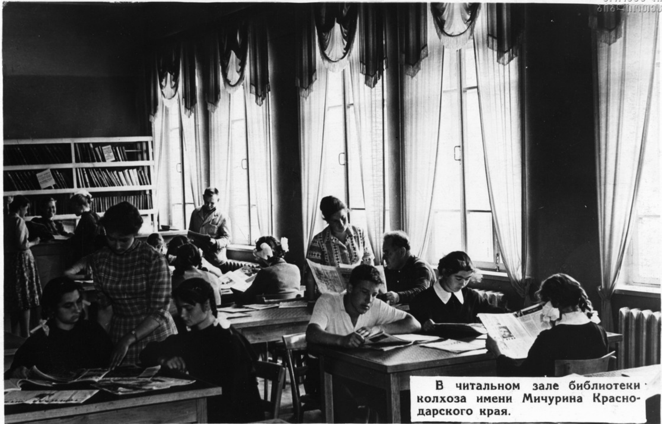
В читальном зале библиотеки колхоза имени Мичурина Краснодарского края.

Тяга людей к знаниям — характерная примета нашего времени. Из года в год в селах страны открывается все больше библиотек, читальных залов, вечерних школ сельской молодежи, техникумов.