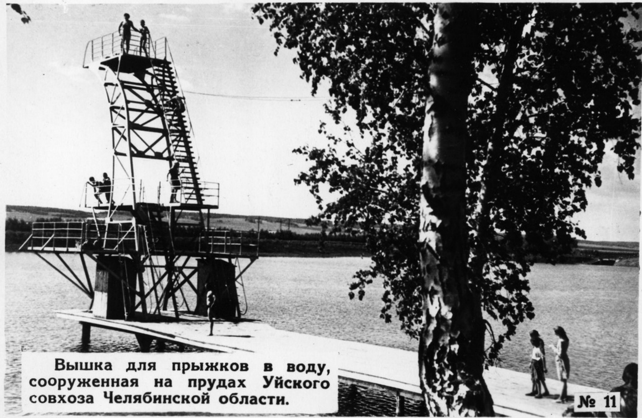
Вышка для прыжков в воду, сооруженная на прудах Уйского совхоза Челябинской области.