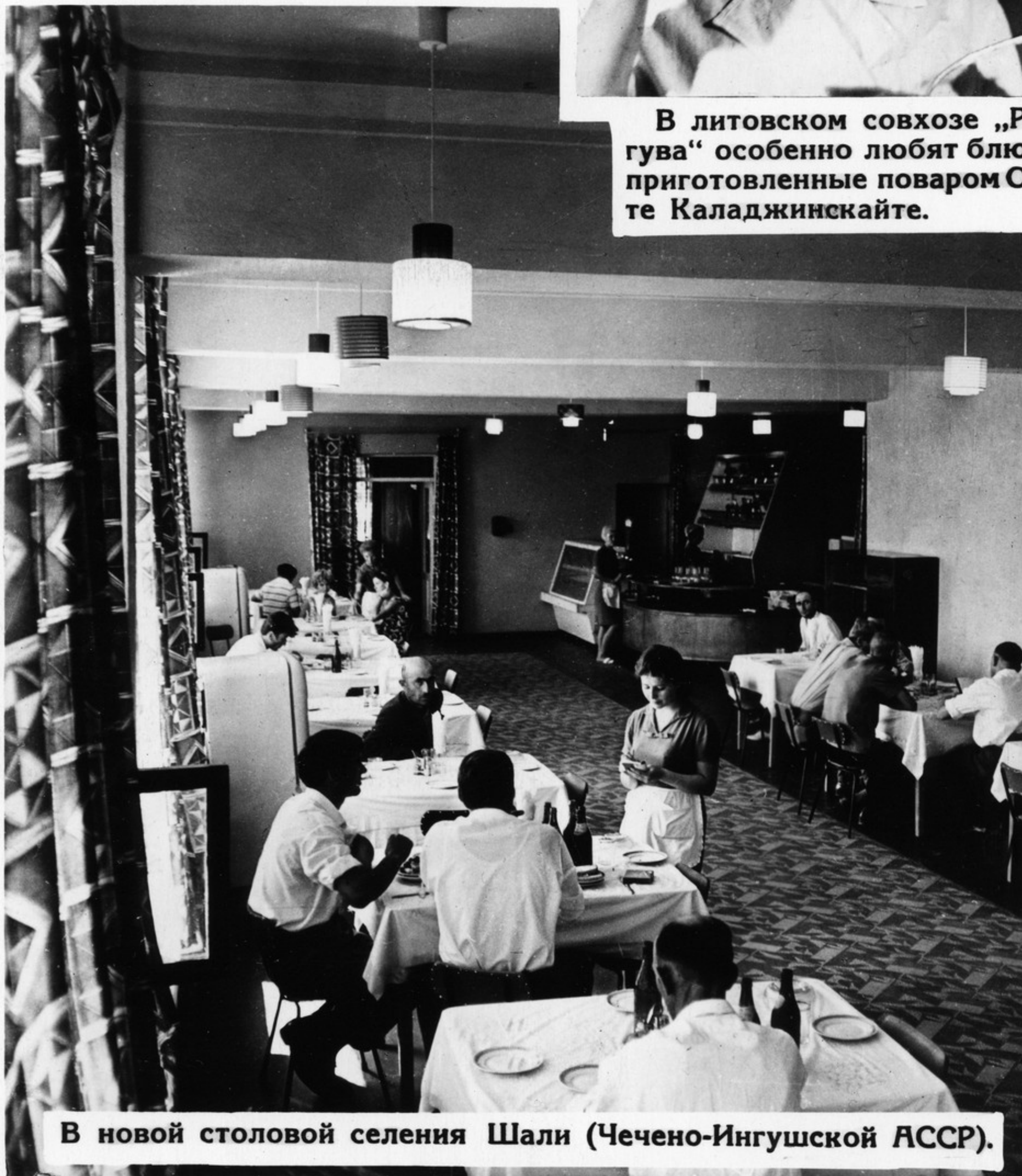
В новой столовой селения Шали (Чечено-Ингушской АССР).