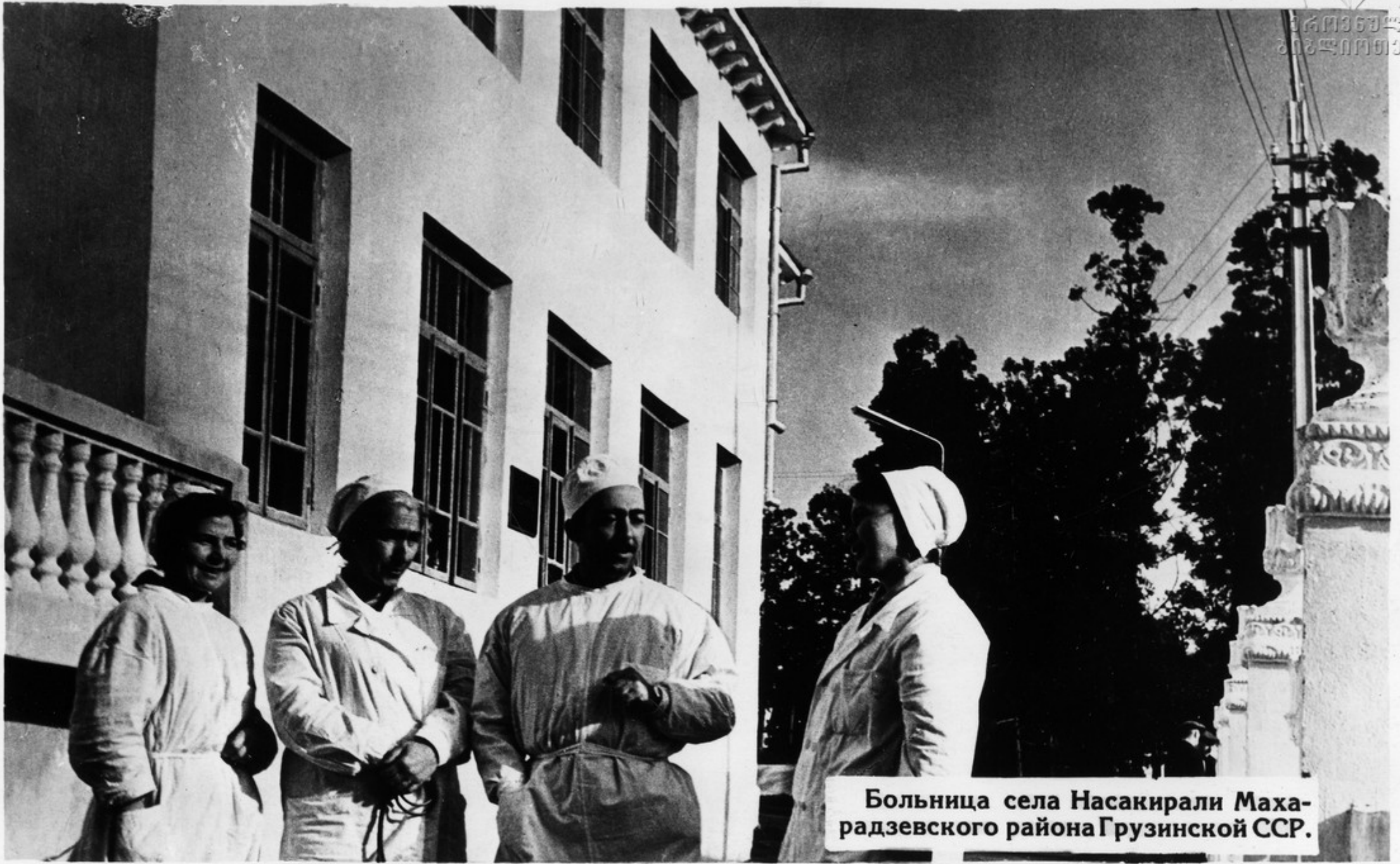
Больница села Насакирали Махарадзевского района Грузинской ССР.

Дальнейшее развитие получает народное здравоохранение на селе. Создается широкая сеть сельских районных больниц и поликлиник, женских и детских лечебно-профилактических учреждений, молочных кухонь, аптек.