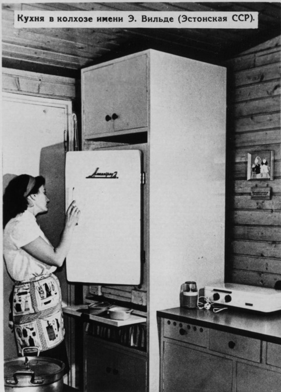
Кухня в колхозе имени Э. Вильде (Эстонская ССР).