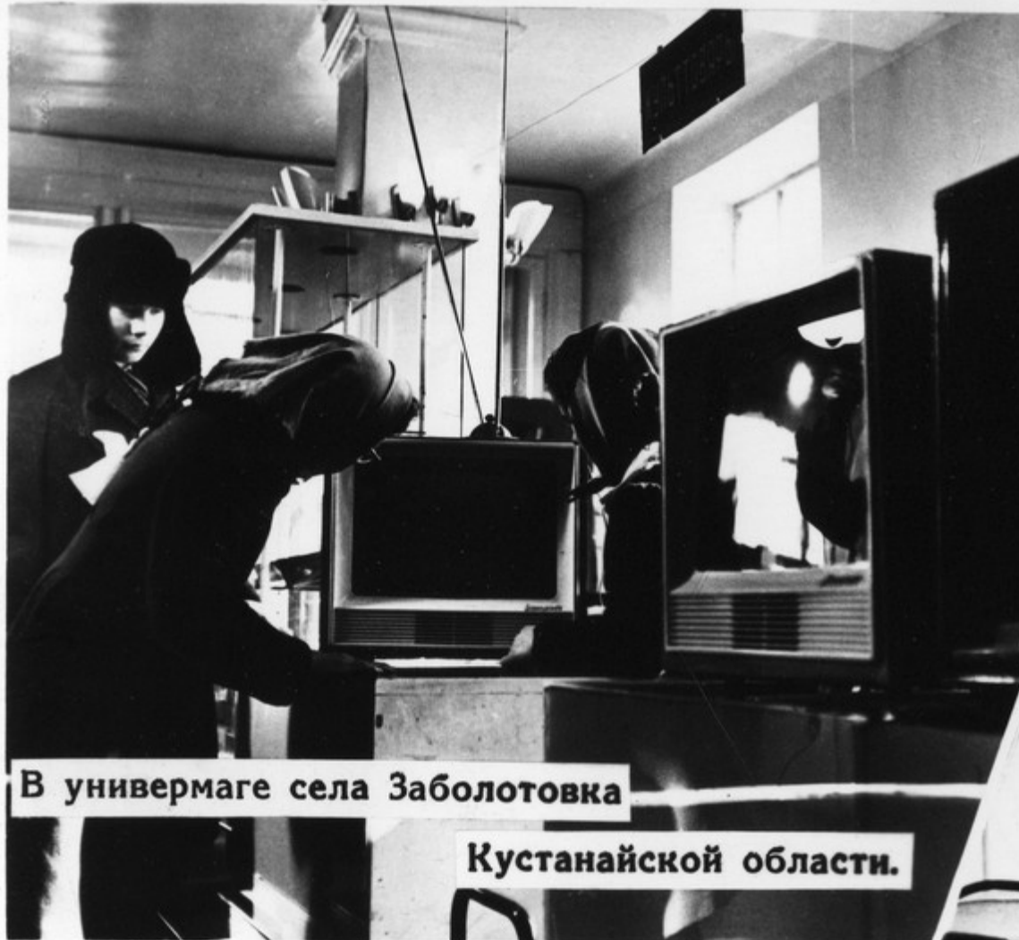
В универмаге села Заболотовка