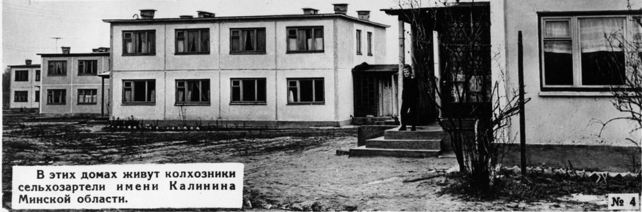
В этих домах живут колхозники сельхозартели имени Калинина Минской области.

Всего несколько лет назад редко можно было встретить в деревенском доме газ или водопровод. Сейчас и то и другое становятся неотъемлемыми атрибутами сельского быта. „Голубой огонь“ приходит даже в самые глубинные села страны.