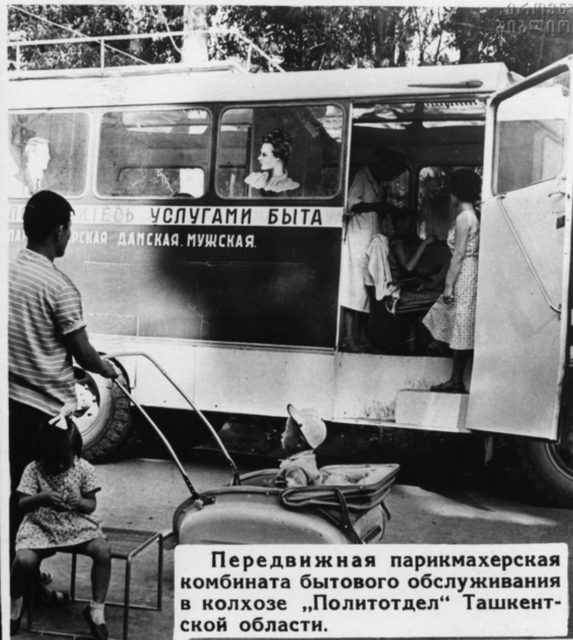
Передвижная парикмахерская комбината бытового обслуживания в колхозе „Политотдел“ Ташкентской области.

Комбинаты бытового обслуживания, прокатные пункты позволяют шире удовлетворять спрос сельского населения на ремонт и пошив обуви, одежды, на техническое обслуживание радио-телевизионной аппаратуры, бытовых машин.