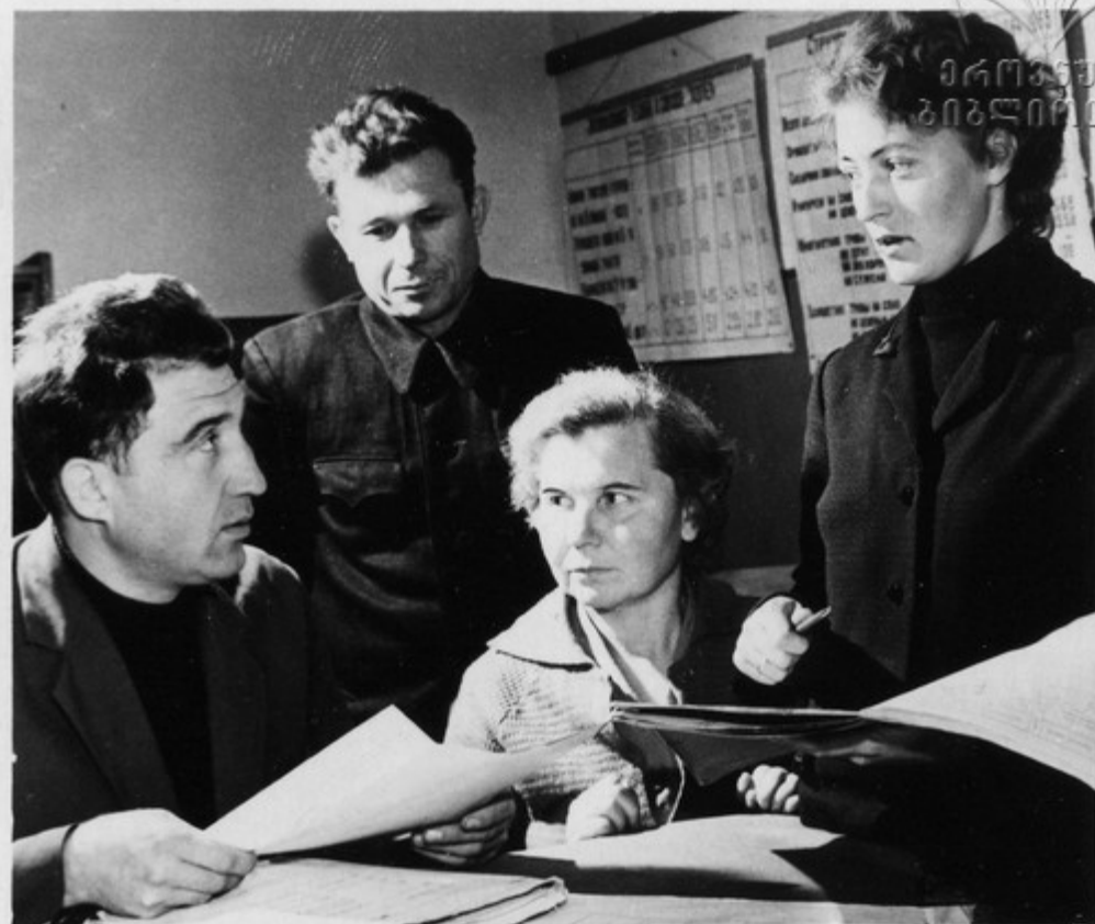
Бюро экономического анализа совхоза „Хопер“ подводит итоги сельскохозяйственного года (Пензенская область).

В нынешнем году впервые отмечается праздник „Все-союзный день работников сельского хозяйства“. В этот день труженики села подведут итоги, оглянутся на прошлый год, наметят планы на будущее. А будущее наших сел прекрасно. Лучше, богаче, культурнее становится жизнь.