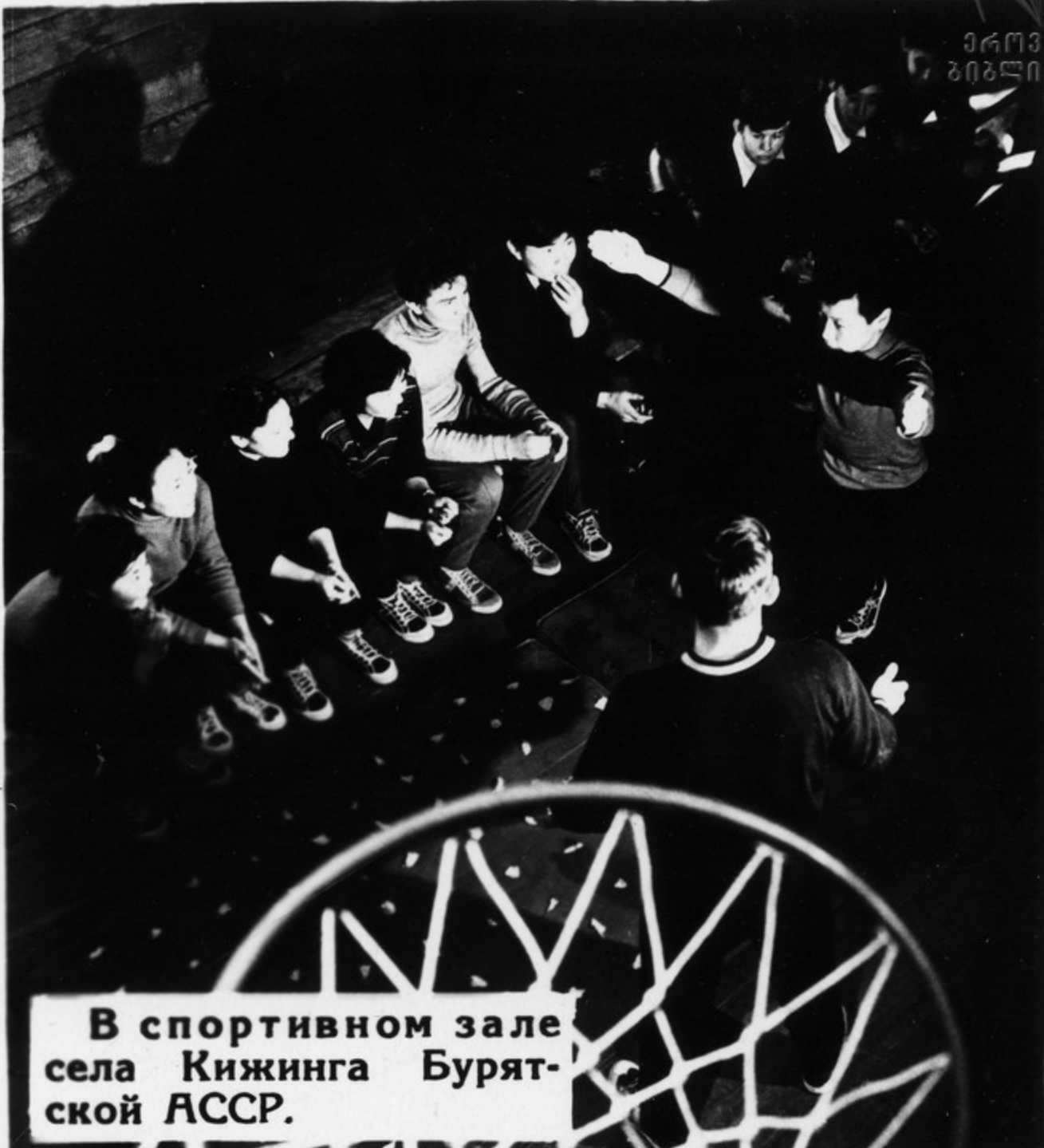
В спортивном зале села Кижинга Бурятской АССР.

Центральный Комитет партии и Совет Министров СССР приняли постановление „О мерах по дальнейшему развитию физической культуры и спорта“. В нем намечено построить в селах стадионы, комплексные спортивные площадки, простейшие спортивные сооружения.