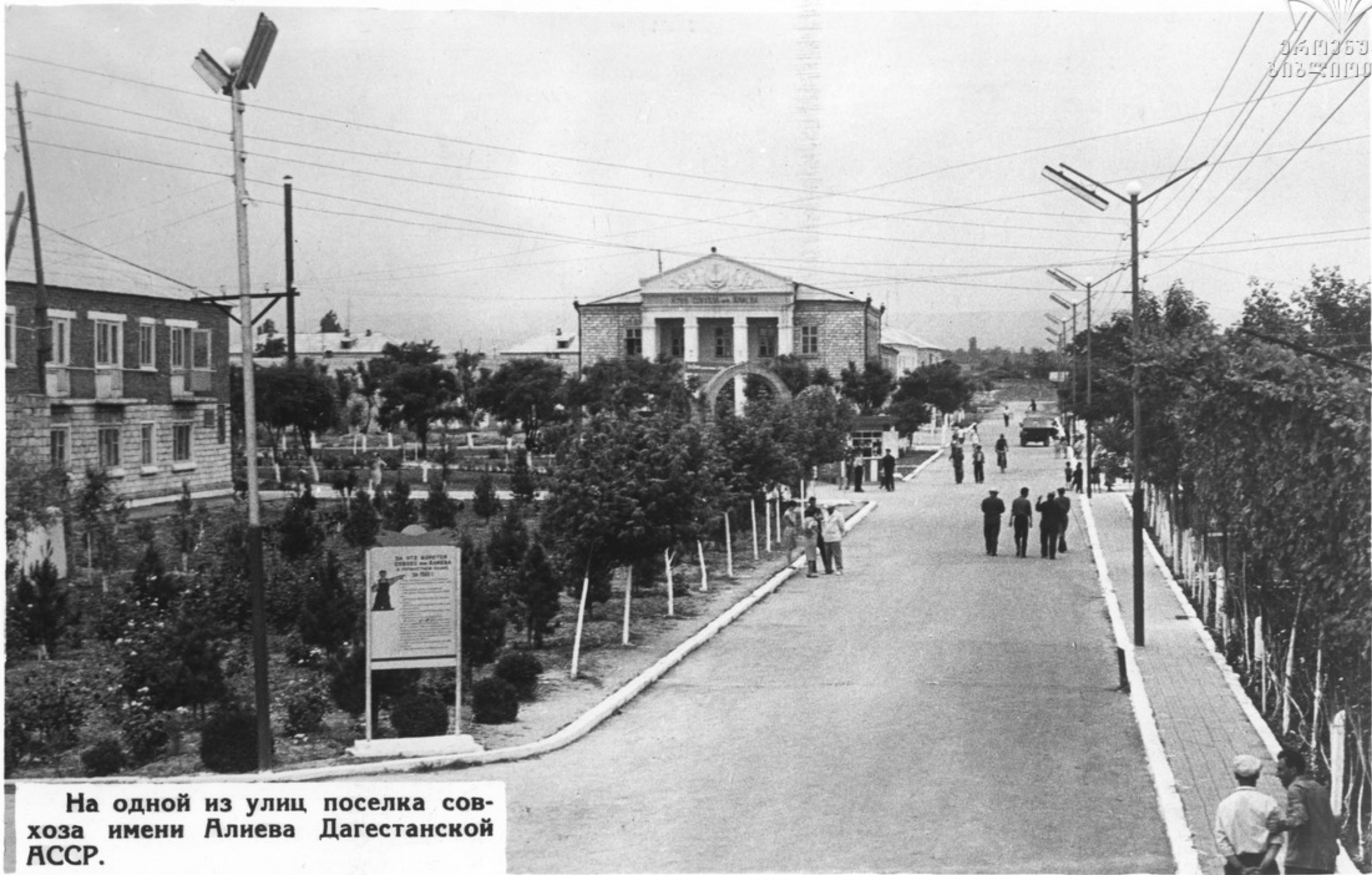
На одной из улиц поселка совхоза имени Алиева Дагестанской АССР.

Хорошие дороги—важный экономический фактор сближения города и деревни. В нынешней пятилетке будет значительно расширено строительство дорог местного значения с твердым покрытием и мостов.