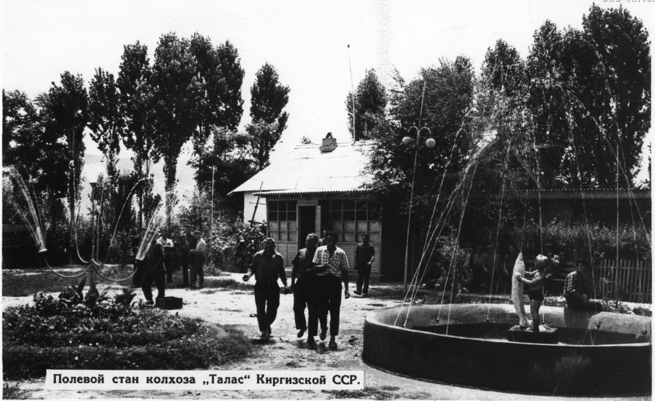
Полевой стан колхоза „Талас“ Киргизской ССР.

Полевой стан справедливо называют вторым домом механизаторов. Создание условий для отдыха людей в полевых условиях во многом помогает им производительнее трудиться.