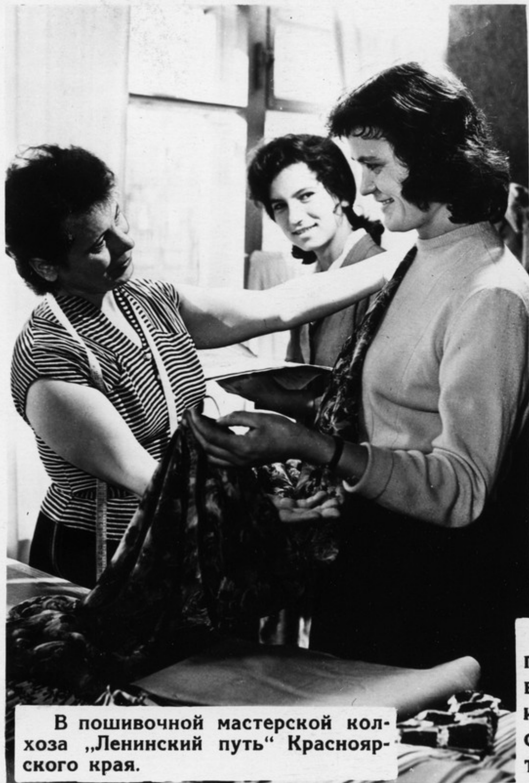
В пошивочной мастерской колхоза „Ленинский путь“ Красноярского края.