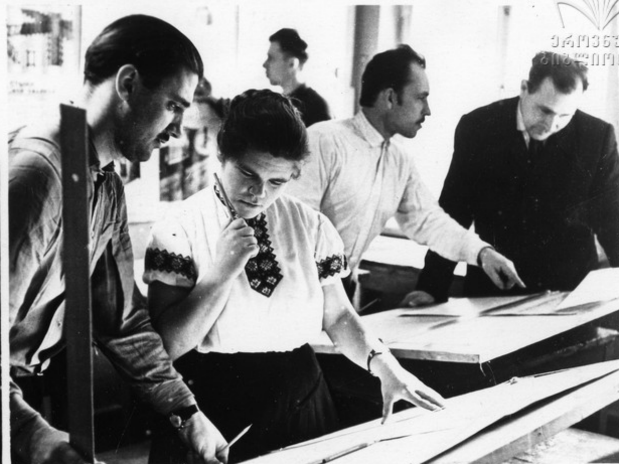
У мастеров сельскохозяйственного строительства (Винницкая область).

Архитектура села. Еще совсем недавно ей не придавалось большого значения. Теперь строительство жилых зданий и культурно-бытовых объектов идет только по проектам с учетом зональных условий. Сельские архитекторы, работающие над планировкой сел, стремятся достигнуть простоты, удобств, экономичности.