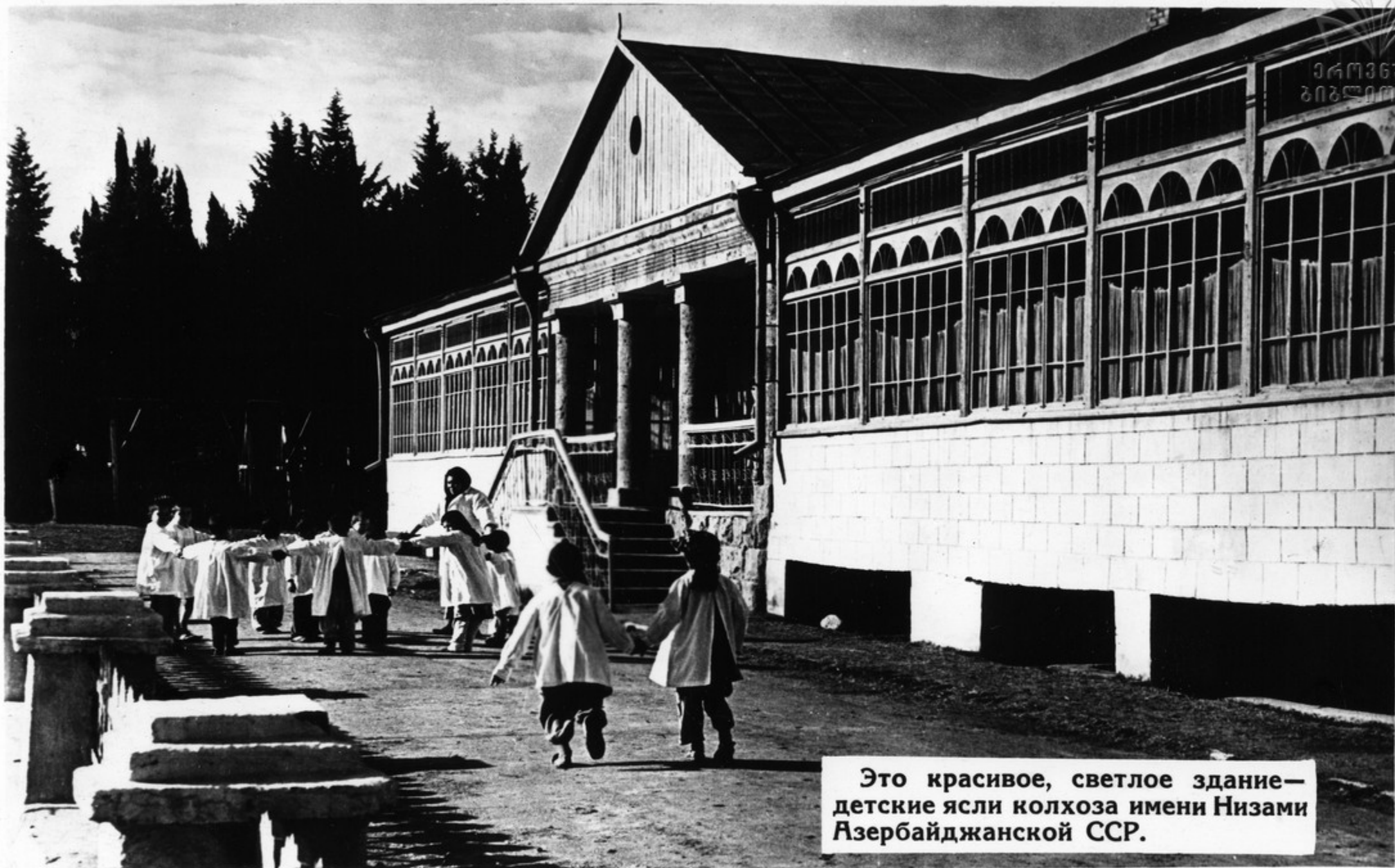
Это красивое, светлое здание— детские ясли колхоза имени Низами Азербайджанской ССР.

Иногда еще работники сельского хозяйства, особенно женщины сталкиваются с проблемой: где оставить детей на время работы? Строительство в селах школ и интернатов, детских садов и яслей, действующих круглый год, поможет успешно решить эту проблему.