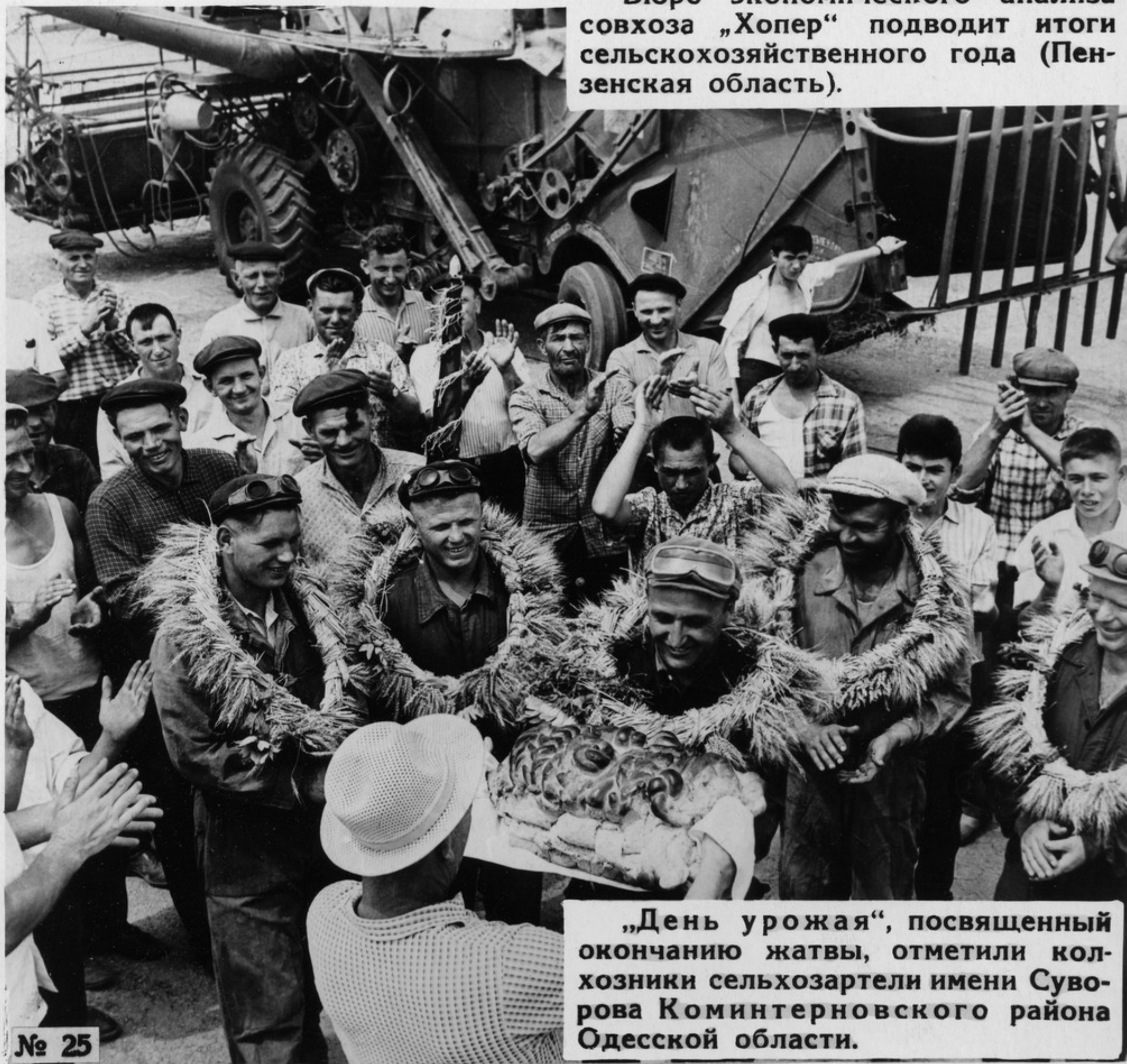
„День урожая“, посвященный окончанию жатвы, отметили колхозники сельхозартели имени Суворова Коминтерновского района Одесской области.