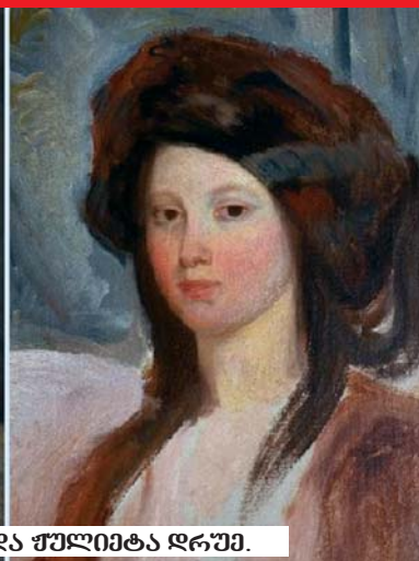
ვიქტორ ჰიუგო და ჟულიეტა ღრუმი.

ნის ყოფილი ცოლი, „ოსკარზე“ ნომინირებული პოლუეტა გოლარი გახდა. ისინი 1958 წელს დაქორწინდნენ, გაცნობიდან შვიდი წლის შემდეგ და 1970 წლამდე, რემარკის გარდაცვალებამდე, ადარდებთან ერთმანეთს. „ყველაფერი ნორმალურადაა. ნევრასთენია ადარ მაქვს. არც დანაშაულის გრძობა. პოლუეტა ჩემზე კარგ გაველენას ახდენს“, — წერდა ლიტერატორი. პოლუეტა დაეხმარა ერისხ, დაესრულებინა რომანი „ცხოვრების ნაპერწკალი“. სწორედ მას მიუძღვნა ერისხ მარია რემარკა რომანი „დრო სიცოცხლისა და დრო სიკვდილისა“.