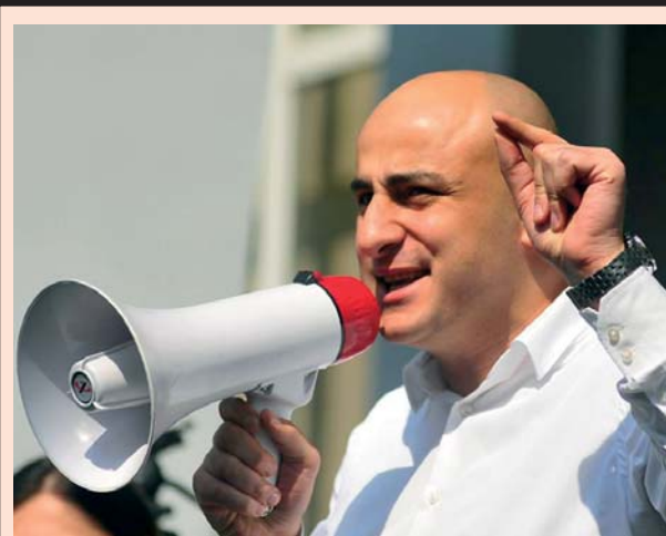
მელიას მარჯვე მარჯვენა