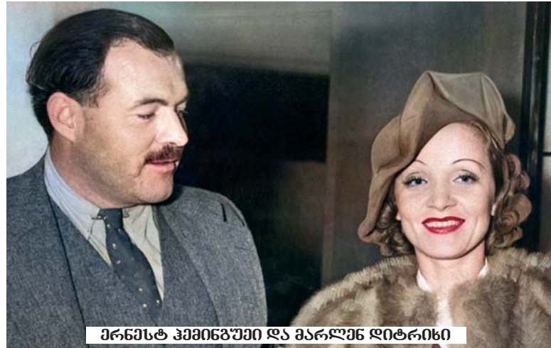
მარნეტ კეინი და მარლენ დიტრიხი

თა, როცა მასთან მუქტიმიანი მამაკაცი მივიდა და თავი წარუდგინა. „მე მწერალი ვარ“, — უთხრა მან. „მე ვიცი. და აღმოხდების მზე“, — უპასუხა ხალმა. ჯონათან სარან ფომრი და ნატალი პორტმანი . 2016 წელს ჟურნალ „ნიუ-იორკ თაიმს სტილ მეგენში“ რომან „უსამველოდ ხმამაღლა და წარმოუდგენლად ახლოს“ და „ოსკარის“, „ოქროს გლობუსისა“ და ბაფტას-პრემიების ლაურეატმა თავიანთი ინტიმური მიმოწერა გამოაქვეყნეს, რომელიც 15 წლის განმავლობაში გრძელდებოდა.