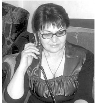
თქვენი ნოტარიუსი, უკიდურეს ვითარებაში კი – სასამართლო.