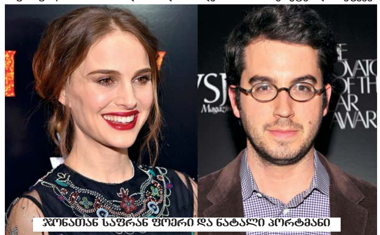
ჯონათან სარან ფომრი და ნატალი პორტმანი

„ჩემი ყოფილი შეყვარებული მოსკოვს მეძახდა. ამბობდა, რომ მე ყოველთვის, როცა მის მანქანაში ვზივარ, მოწყვნილი ვარ, როგორც მოსკოვი, როგორც რუსული ნოველა სიყვარულზე, ან ჩეხოვის ერთ-ერთი პიესა“, — იხსენებდა ერთ-ერთ წერილში მსახიობი. „როდესაც ყველაფერი, რაც დაეკარგეთ, წარსულში დარჩება, მე შევძლებ იმ წერილების ამოქვეყნებას, საიდანაც ჩვენი ურთიერთობა დაიწყო და ყველაფრის თავიდან განცდა შევძლებ“, — წერდა პასუხად ფომერი.