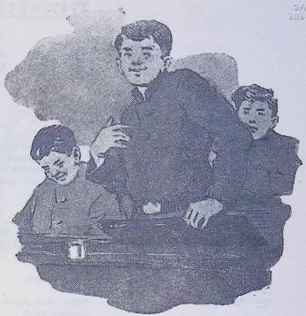
ის სერიოზული სახით წამოვდა, მხარი ისევ შეათამაშა...