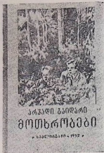
საქართველოს გარე ურთიერთობების მინისტროს საგარეო პრესის განყოფილება

ვის არ წაუკითხავს ა. გაიღარის შესახებ ჩვენი მოზარდნი? „თქვენი და მისი რაზმი?“ ამ მოთხრობის გმირის მიხედვით პიონერებმა სამამულო ომის წლებში