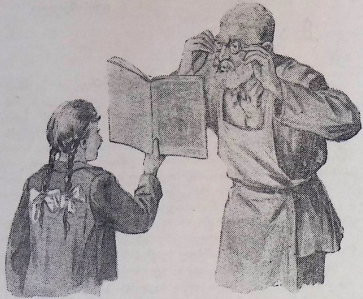
მეგობრებო... სასწრაფოდ სათვალეები გაიკეთა და ქურნალს დახედა.

— ვიქ! — აღმოხდა მას. სუ- რათზე მზია და მამამისი იყო გა- მობატული, კვებუკი მსხვილი ასოე- ბით ეწერა: