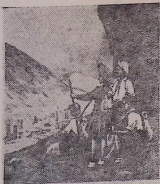
ბ. ი. ნ. ე. რ. ი. ნ.