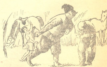
— მე თვით, დიდებულო პანო, უცხენო ვარ, გაუბედავად ამბობდა ბაბუა.

— ჰო და წაიდი, იჩილე! — ჩაიხითხითა პანმა, შეახტა თავის ბედღურს და გაქუსლა ტყეში თავისი მაშულის მიმართულებით. ბაბუა გალაქტიონი კი