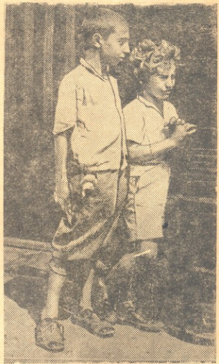
ამერიკელ უმუშევართა მშვიერი ბავშვები სასტუმროს უკან კარებთან ელოდებიან ლუკმა პურს.

აქ მოკლეთ ჩვენ გიამბოთ, თუ როგორ წამებასა და გაკრივებაში ცხოვრობენ ბავშვები ესპანეთში, გერმანიაში, ამერიკაში, მანჯურიაში. სხვა ქვეყნებშიც არ ჩამორჩებიან მათ ამ საშინელებაში. ავსტრიაში, იტალიაში, ჩინეთში, იაპონიაში — ყველგან, სადაც კი მეფობს კაპიტალი, იტანჯება ადამიანი, იტანჯებიან უსუსური ბავშვებიც.