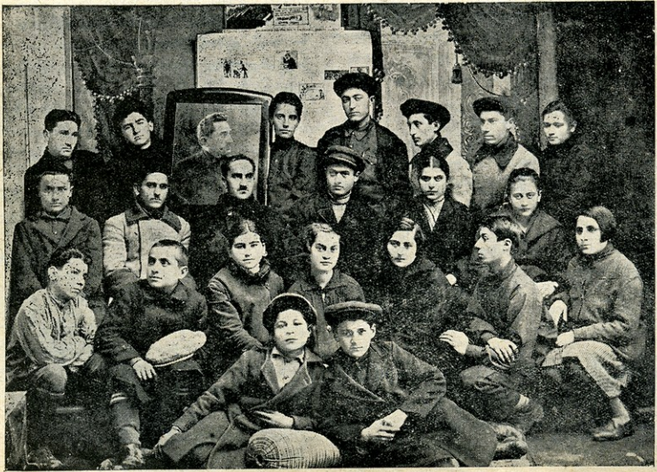
აზ. ხ. ჯუღელის სახელობის ქ. სიღნაღის ნ/მ კოლექტივის საბჭო