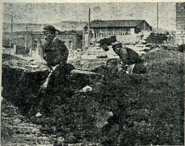
სახლიან სააგურე თიხას

— მაშ ქალაქშიაც არ არის მოწესრიგებული აგურის გაშრობის საქმე? — დაბალი ხმით იკითხა ბესიკომ.