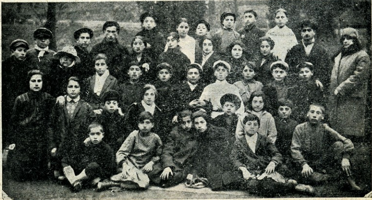
5. კრუპსკაის სახელობის გორის ნ/ა კოლექტივი