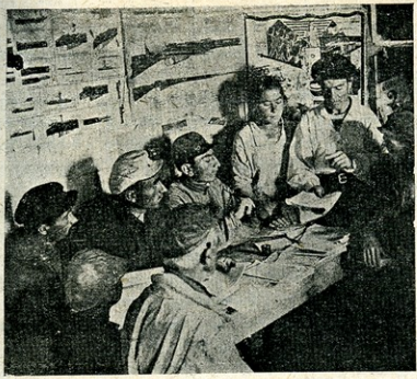
გლეხებს გახეთს უკითხავენ