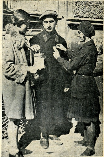
საბავშვო ბაღის სასარგებლოდ

შუალამისას ტყეს აცილდნენ, გადავიდნენ ტრიალ მინდორზე ტენფანების სათიბეში, ქერისა და კარტოფლის ყანეში. გამოიწნა ბოსტენი. ზაფხულობით იქ ძროხები უდგამთ და მწყემსები შიგ ცხოვრობენ, ახლა კი ყველანი ბარში წასულან საზამთროდ. ამიტომაც კვამლი აღარსად არ ამოიღის. წითელარმიელები ფეხებს ბიჯებში ხელით ეხმარებოდნენ, ისე დაილაღნენ. ათეულობით ჩამოირიდნენ ბოსტენში. გაოფლალ მეომრებს შესცივ-