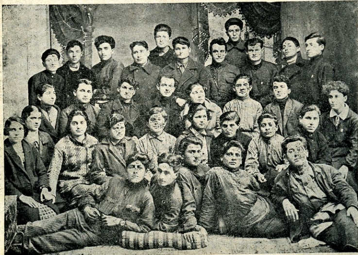
სოლნლის რაიონის კოლექტივის ხელმძღვანელთა გადასამზადებელი კურსების სსმენელები

— ძია! მე როგორ-ღა გავაცნო ჩემი მამა? ჩემი მამიკო ღიდი ხანია წაიდა.