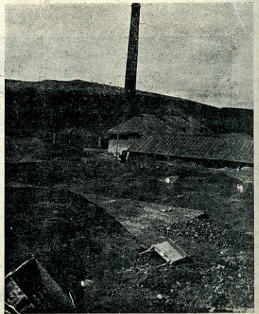
აგურხანის საერთო სახე