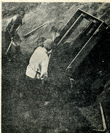
სტარია სააგურე თიხას