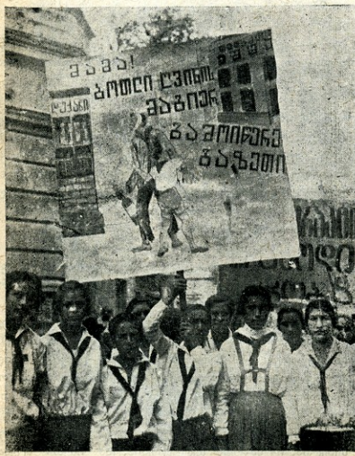
ლაშქრობა ლოთაობის წინააღმდეგ