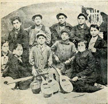
სიღნაღის პიონერთა მუსიკალური წრე

გვიღა „ხარება“ და „ნასესხების“ კვირაც... ალექსის წინასწარმეტყველება თოვლის მოსვლისა და ყაიმეთი ამინდის შესახებ არ გამართლდა, პირიქით, საშინელი მზიანი დარები დაიჭირა გაზაფხულის დასაწყისშივე... თბილი ქარისაგან დასკდა დედამიწის ზედაპირი ღარებ-ღარებდა, და მიწაზე თობის დაკარება შეუძლებელი შეიქნა.