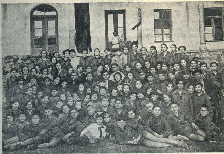
ქუთაისის მუსიკალურ ტექნიკუმთან არსებული ნორა ჰოინერთა საბავშვო ოჯარი

როგორც მისი დისთვის, ოლგასთვის, ოქროს მედალი. მან მიიღო ეს მედალი და შევიდა ყაზანის უნივერსიტეტში, იურიდიულ ფაკულტეტზე. დედამ სიმბირსკში გაჰყიდა სახლი, ზედმეტი ქონება და თავისი დანარჩენი შეიკლებით ვაძმოვიდა საცხოვრებლად ყაზანში. ის ჩავერა, რომელიც ისედაც გულზე მძიმე ლოდით აწვა სტუდენტობას წარსული საუკუნის 80 წლებში, უფრო გამძლიერდა მეფის მოკვლის ცდის შემდეგ (1887 წლის 1 მარტი) რომლის მონაწილე იყვნენ სტუდენტები. სტუდენტების ინსპექტორებად ინიშნებოდნენ ნამდვილი პოლიციელი მამბერები. დახურეს სტუდენტთა საზოგადოებები, დახურეს მათი ყველა ორგანიზაცია, სტუდენტების დაბატონებასა და დაითხოვნას ბოლო არა ჰქონდა. სტუდენტებმა დაიწყეს პროტესტების შეტანა ყველა უნივერსიტეტში. დაიწყო ეგრეთწოდებული „სტუდენტთა არეობა“, უწყსოება ყაზანის უნივერსიტეტში. ვლადიმერ ილიჩმა მიიღო მონაწილეობა ამ არეულობაში და სხვებთან ერთად ისიც გამოიცილეს უნივერსიტეტიდან და გადასახლეს ყაზანიდან სოფელ კოკუშკინოში. უმაღლესი სკოლის კარი გამოხურა მას, მას და მის დას უარი ეთქვა უნივერსიტეტში უკანვე მიღებაზე, რასაკვირველია, იმიტომ, რომ ის იყო ალექსანდრეს ძმა. ამგვარად დამთავრდა სწავლა ვლადიმერ ილიჩისთვის. მაგრამ ის იმდენად შეგნებული იყო,