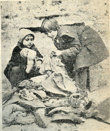
სახინძრეწვის პიონერების კოლექტივი აგროვეებს უფარვის ქაღალდებს, კალოშებს და ჩგრებს

ლეო. ახლა შენ! ამხანაგებო, დღეს ჩვენი პიონერ-კოლექტივი მართავს ძია ლენინის ხსოვნის საღამოს, მისი გარდაცვალებიდან მეექვსე წლის თავზე... ვინ იყო ვლადიმერ ილიას ძე ულიანოვ-ლენინი, ანუ ჩვენგებურად—ძია ილიჩი? ის იყო გენიალური რევოლუციონერი, კარლ მარქსის მოძღვრების საუკეთესო გამოყენებელი ბოლშევიკი, კომუნისტური პარტიის საძირ-