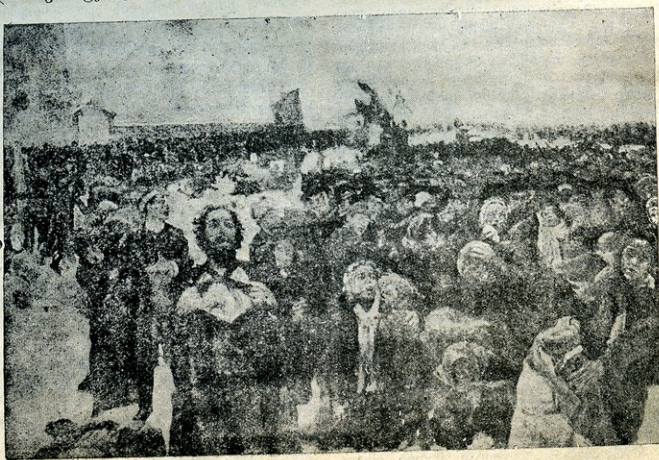
მეფესთან მიდიან ცხუნით, მუდართო

და კვლავ აირთა ხალხი. თითქმის კვლავ რადგამ შეუშალა ხელი წინ მღვლეული.