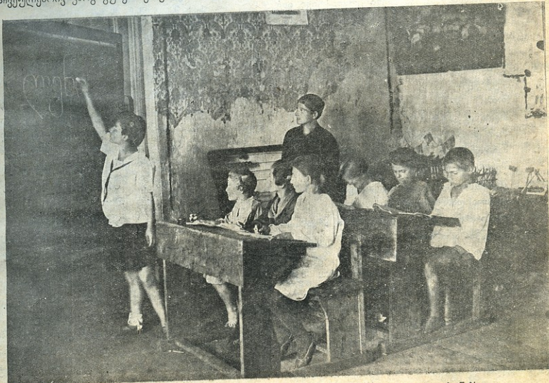
გელათის ნ/3. ბანაის პიონერი ამეცადინეს წერა-კითხვის უცოდინარ შეჯავშირებელ ბავშვებს