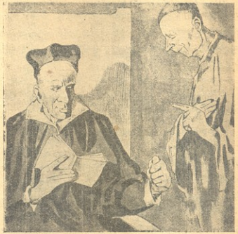
ეს ზომ მწვალელობაა, ვინ გაბედა ამ წინის დაბეჭდა!

მის წინ სავარძლად მანძილზე იღდა ჯერ კიდევ ახალგაზრდა ყმაწვილი ბერის, ტანსაცმელში დაწემა-კურად აცეცედა თვალებს.