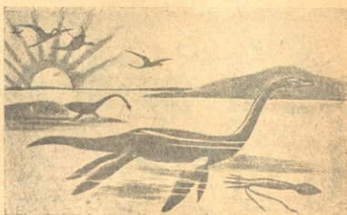
ალეზიზაური, ბელუმბიტი და მფონიეტი კტროდაქტოლები.

განსაზღვრული ნიშნების შერჩევის გზით შეიძლება მოვამრავლოთ, მივიღოთ ახალი მოდგმა—ახალი სახე.