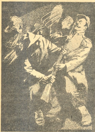
აჯანყებულებმა ენდარმებს იარაღი აპყარეს.

საქირო იყო, რათაც არ უნდა დასჯდომოდა, 2000 მშვიერი კაცის გამოკვება: ვალდებულ პლანს დილაზე ისინი არ უნდა დაენახა ქუჩაში მსხლამარე; თუ დილამდის მოიშორებდა როგორმე, ისინი გაჭირბოდნენ ცუდი სიზმარივით, რომელსაც განთიადი სპობს და ანადგურებს.