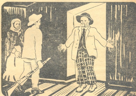
მე უფროსი ვარ ოჯახისა და გიკრძალავთ სახლის დატოვებას, — უთხრა ძიამ სიღვერს.

რაზმი დაეწყო. ტყვეები შუაში მოიქციეს: გარსონესა და მიიორ სიკარდოს გარდა აჯანყებულებმა პიროტიკ დაატუსაღეს და თან მიჰყავდათ; აგრეთვე ხარჯების ამკრეფი და რამდენიმე სხვა მოხელე. აჯანყებულთ კარგად ესმოდათ, რომ ვერ შეიჩინდნენ რეპტიკონურ პლასანს და ამიტომ იქ დემოკრატიული კომიტეტიც კი არ დაუარსებიათ, როგორც სხვა ქალაქებში. რაზმი სოვერის მოედანზე ჩავიდა და დიდი ალყაფის კარით გავიდა, უკან კი კარიგული და მღუმელი ქუჩები დარჩა, რომელზედაც მან გაიარა გრიგალივით. შორს, წინ, მთვარით განათებული გზა იყო.