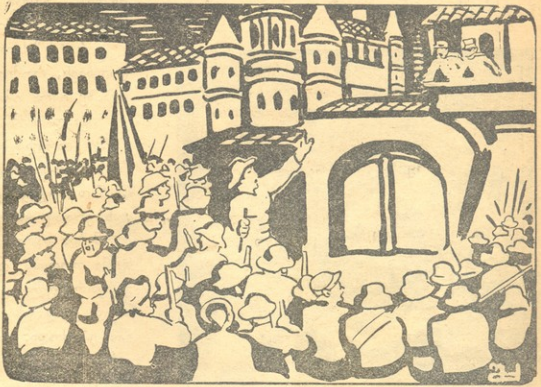
ვინა ხართ და რა გინდათ? — გადაჰყვირა ხმამალა მერმა.

— ოჰ, საძაგუნო! მხოლოდ თითხ ჯარისკაცი რომ მყავდეს, ჩამოვიდოდი და ყურბებს დაგავლეჯდიო, რათა პიტვიტყვა მამეკონებინა თქვეთვის. ეს სიტყვები საჭმარისი იყო, რომ მეტად საშინელი შედეგები გამოეწვია: