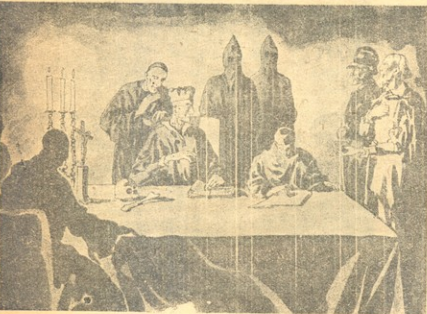
თუქიმდე გაბედავთ ჩვენს წინააღმდეგ გამოცვლას, ვერაფერი ვერ გიხსნისთ.

ღვდამიწა მაინც ბრუნავს! ასეთი სიტყვებით დაასრულა აღექსანდრე ივანეს ძემ თავისი მოთხრობა.