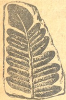
ქვანაშორის ეპოქის გვიწის სახე, ქვანაშორისე დარჩენილი.

მაგალითად, ფრინველი ბაპტოპის 6 მეტრს უდრიდა სიდიდით. იყო აგრეთვე მზეცი მოსტოლონტი, ჩვენი სპილოს მსგავსი, მაგრამ ის ბევრად უფრო იდიო იყო და ოთხი წყვილი ეშვი ჰქონდა. იყო ლომისა და ვეფხვის რაღაც საშუალო მზეცი, რომელსაც ზევითა ებაში ორი დიდი ეშვი ჰქონდა ხანჯლებით და ბევრად უფრო დიდი იყო ჩვენი დროის ლომსა და ვეფხვზე.