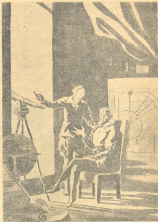
მე რომ ვერ მომეხებრებოდა ამ მანქანის გამოგონება, ჩვენ ახლაც ბრმა ვიქნებოდითო.

კარგად ვერ მჩვენებს მაგრამ რა ვუთხრობდი თუ თო მან, — ყველაფერს ერთბაშად ვერ გააკეთებ. შემდეგი თობანი გააუზღობსებენ ჩემს ჭოგრს. ისინი დანახავენ და გაიგებენ იმას, რაც ჩემთვის საიდუმლოებად დარჩა. ამგვარად კაცობრიობა იგლის წინ და თანდათან განთავისუფლდება თავისი შეცდომისაგან, აღმოაჩენს სულ ახალ რამეებს. ყოველგვარი დედნის, ტანჯვის და მსხვერპლის მიუხედავად, მეცნიერება მაინც გაიმარჯვებს.