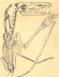
პტეროდაკტილის ჩიხი და რუსტავოცისა.