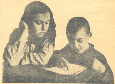
ემზარება პატარა მას.

პიონერის სწავლების საკითხის მოსაგვარებლად საჭიროა აგრეთვე, რომ ამ მიზართულებით მოშაობა მშობლებთან შეთანხმებით ვაწარმოოთ. სასურველია, მშობლებმა იცოდნენ, რას აკეთებენ მათი ბავშვები კოლექტივში და სკოლაში.