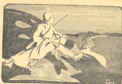
ქალმა სისუსტე იგრძნო და ჩაეძინა.

— არ ვიცი. მე შენსავით დიდი ნაბიჯების გადაღმა მინდა. შენ იქნებ ფიქრობ, რომ მე ჯერ კიდევ ბავში ვარ.