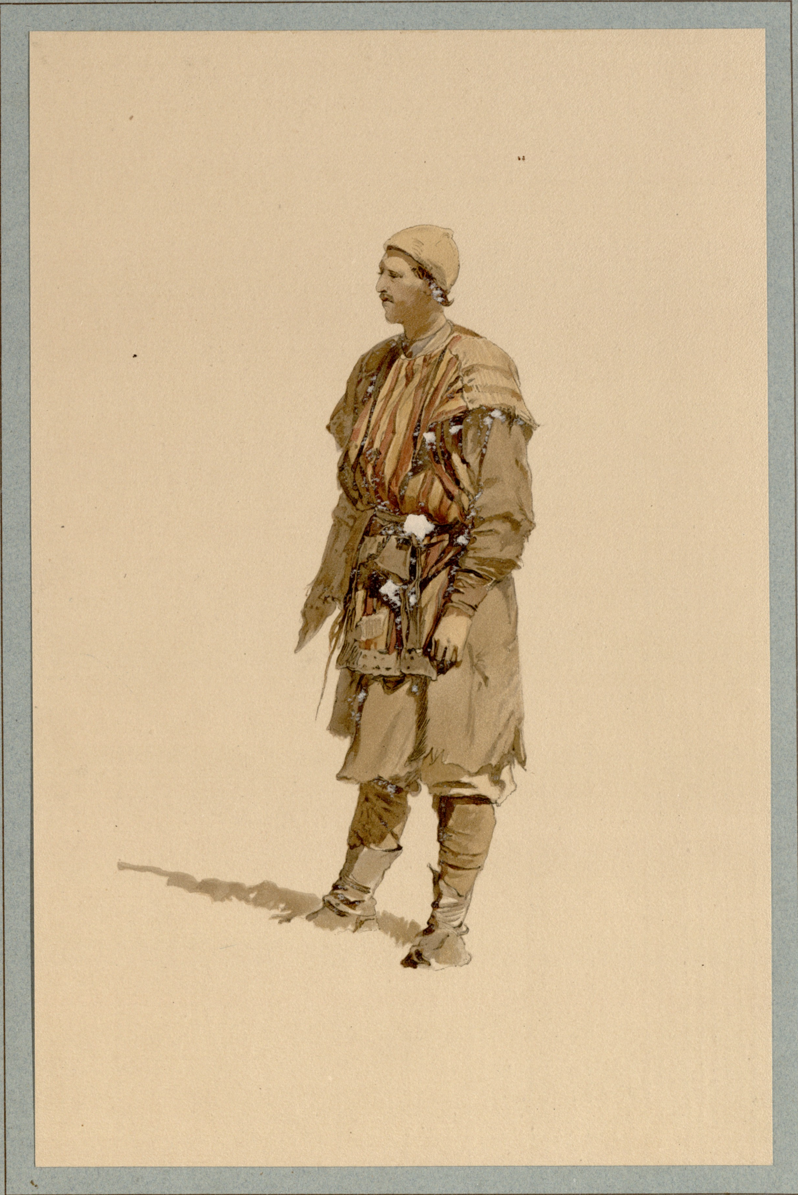
ХРОМОЛИТОГРАФИЯ ЭКСПЕДИЦИИ ЗАГОТОВЛЕНИЯ ГОСУДАРСТВЕННЫХЪ БУМАГЪ.