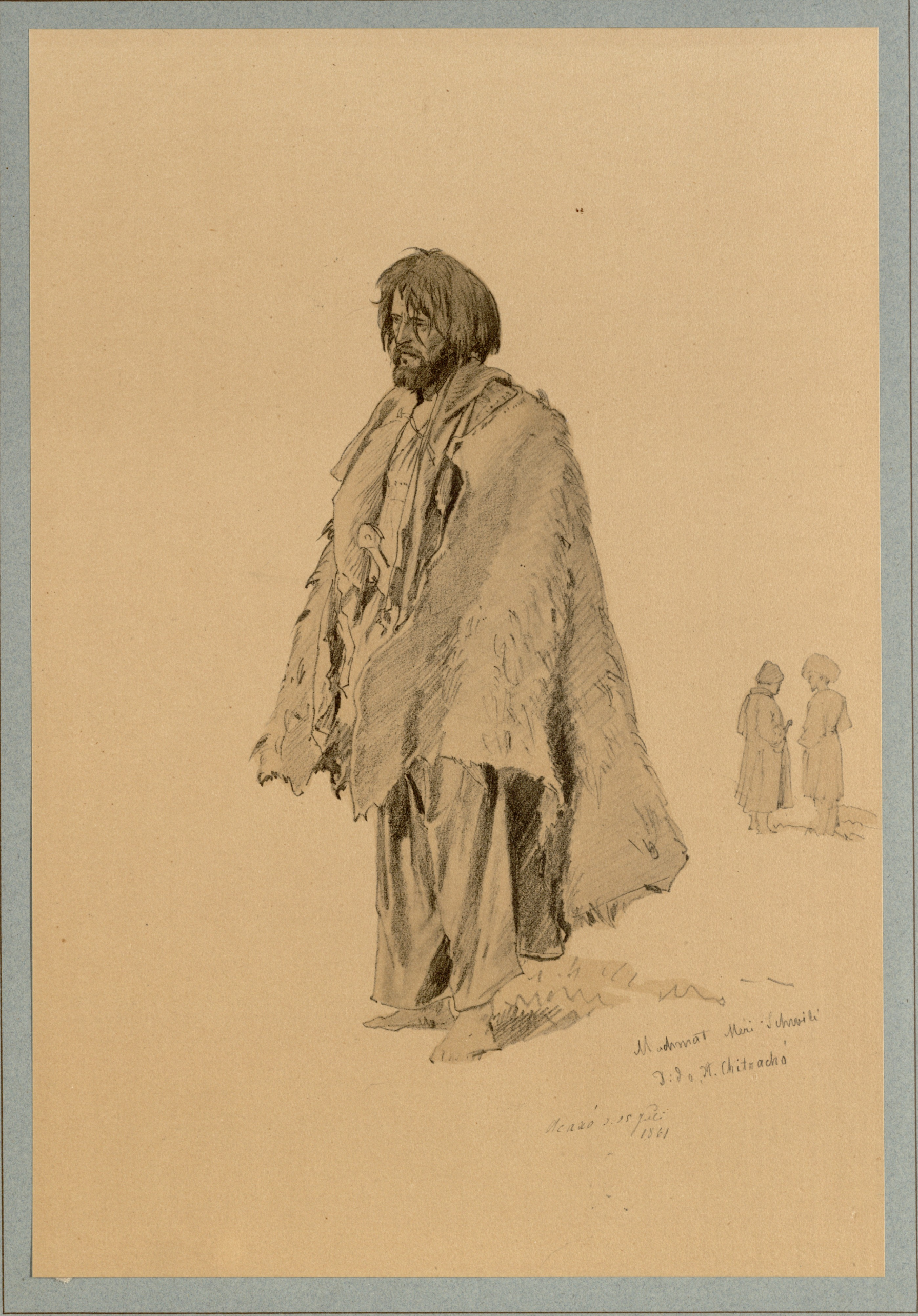
ФОТОТИПЪ ЭКСПЕДИЦІИ ЗАГОТОВЛЕНІЯ ГОСУДАРСТВЕННЫХЪ БУМАГЪ.