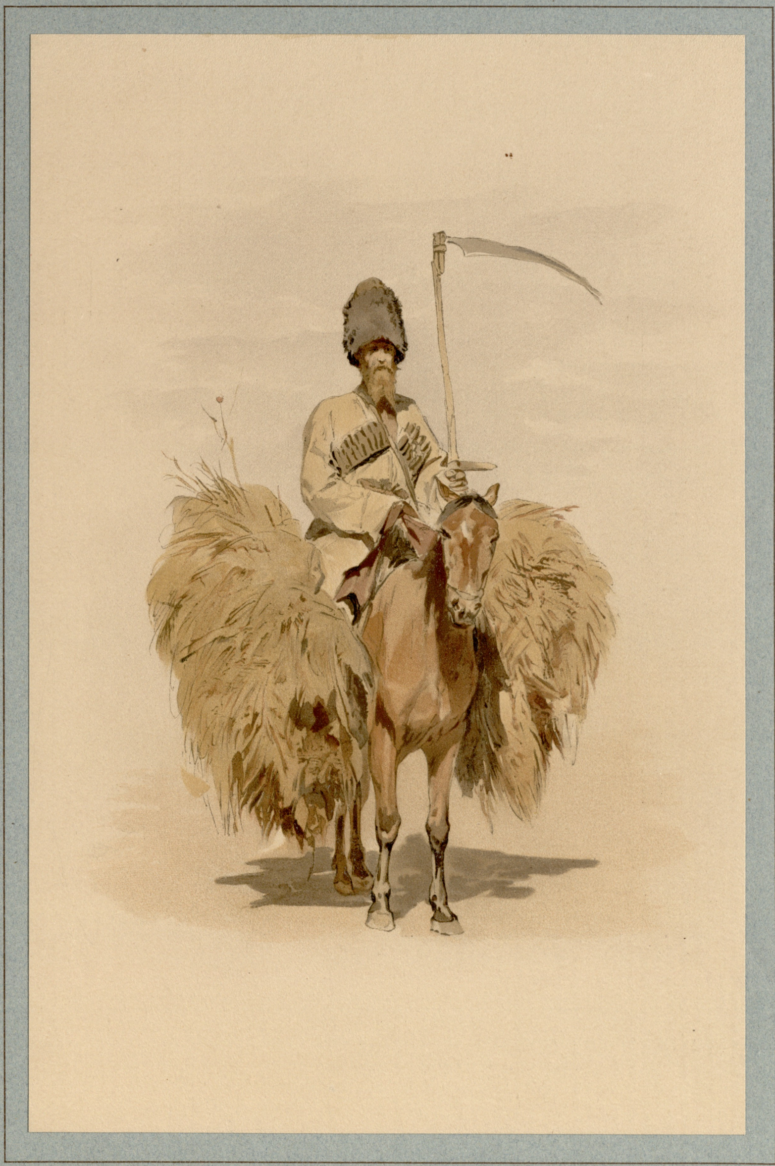
ХРОМОЛИТОГРАФИЯ ЭКСПЕДИЦИИ ЗАГОТОВЛЕНИЯ ГОСУДАРСТВЕННЫХЪ БУМАГЪ.