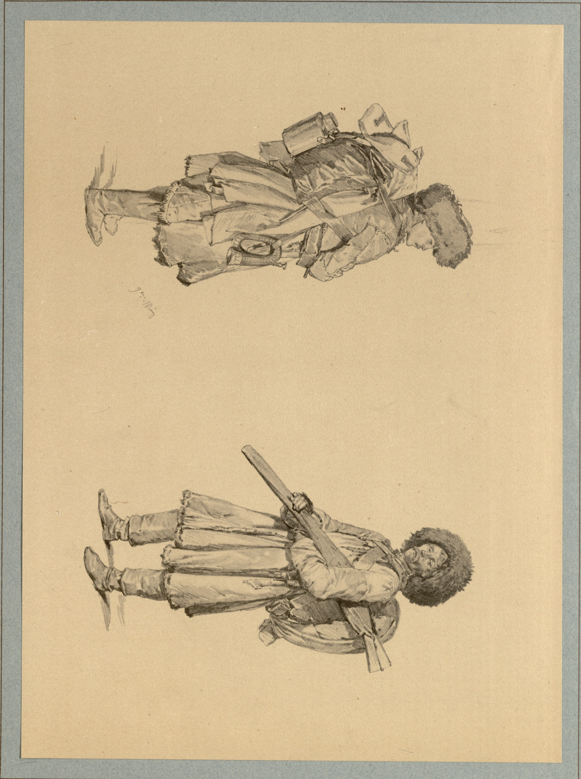
ფოტოგრაფიის აკვირების რატორიანი გოგადარსენიანი. რუმატი.