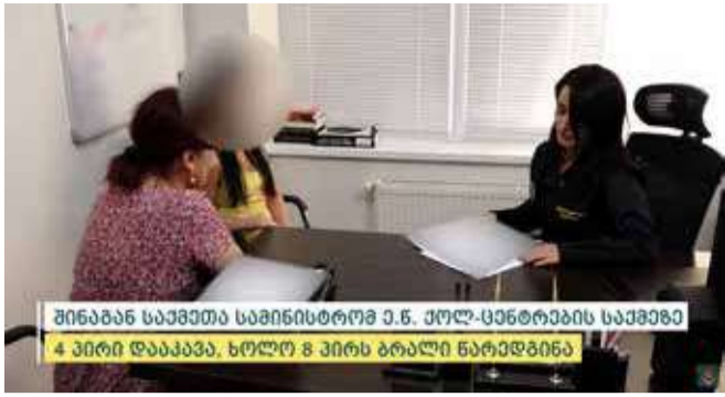
შინაგან საქმეთა სამინისტრომ ე.წ. ქოლ-ცენტრების საქმეზე 4 პირი დააკავა, ხოლო 8 პირს ბრალი წარედგინა

შინაგან საქმეთა სამინისტროს ცენტრალური კრიმინალური პოლიციის დეპარტამენტის ორგანიზებულ დანაშაულთან ბრძოლის მთავარი სამმართველოს კიბერდანაშაულთან ბრძოლის სამმართველოს თანამშრომლებმა, ჩატარებული ოპერატიულ-საგამოძიებო მოქმედებების შედეგად, უცხო ქვეყნების ინტერნეტ-მომხმარებლების მიმართ განხორციელებულ თაღლითობის ფაქტზე, ოთხი პირი დააკავეს, ხოლო რვა პირს ბრალი წარედგინეს.