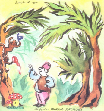
მხატვარი თამარ ძალღანი

- ქუდები! ქუდები გასაყიდა! თითო ათი პენი!